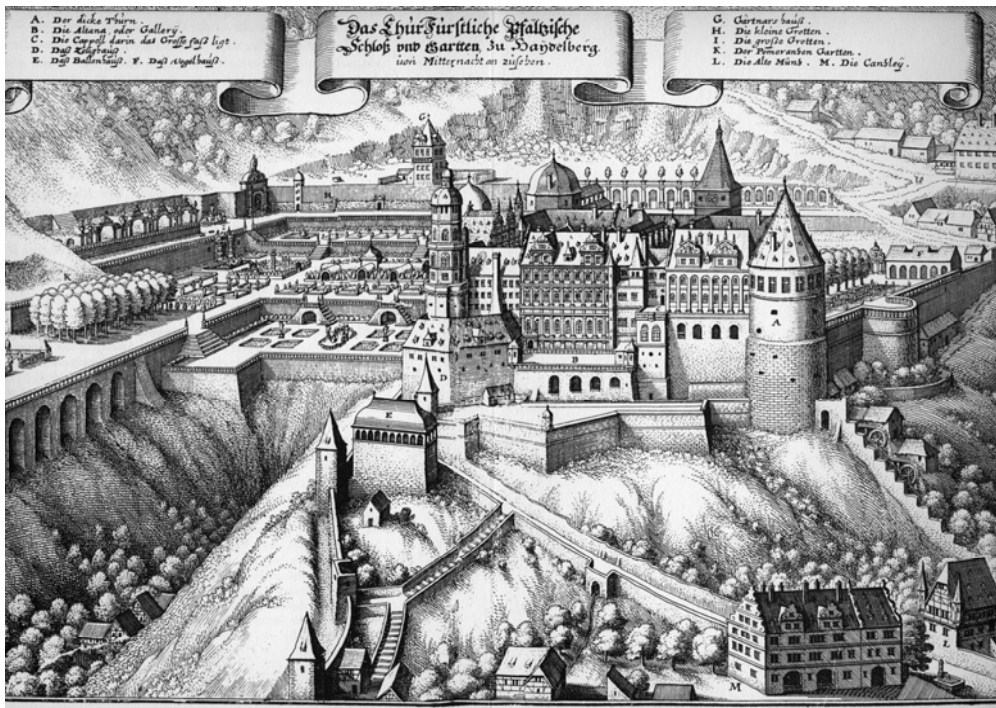
Abb. 2. Heidelberg, Ideale Ansicht von Schloss und Schlossgarten. Aus: Martin Zeiller, Matthäus Merian, Topographia Palatinatus Rheni et vicinarum regionum, Frankfurt am Main 1545.