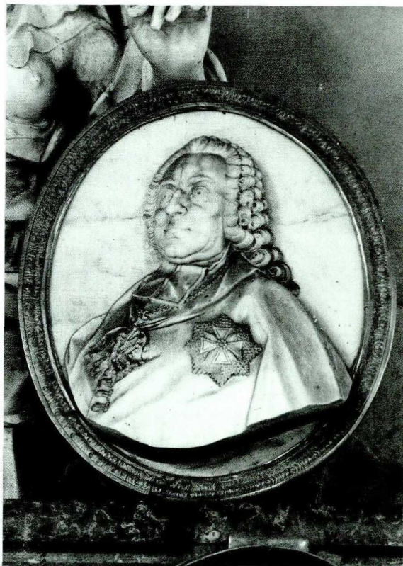
10. Giacomo Monaldi, Medalion z portretem Andrzeja Stanisława Kostki Młodziejowskiego (fragment nagrobka), marmur biały, rama brąz, 1784 r. Kościół Wniebowzięcia NMP w Słubicach koło Gostynina.

go w kościele. W kompozycji pomnika Młodziejowskiego Monaldi wyraźnie nawiązywał do schematu nagrobka prymasa Ostrowskiego, stosując podobne elementy w analogicznej dyspozycji, natomiast układ i sposób opracowania rzeźby figuralnej wykazuje, jak zauważono, bezpośrednią zależność od rzymskich wzorów 80 .