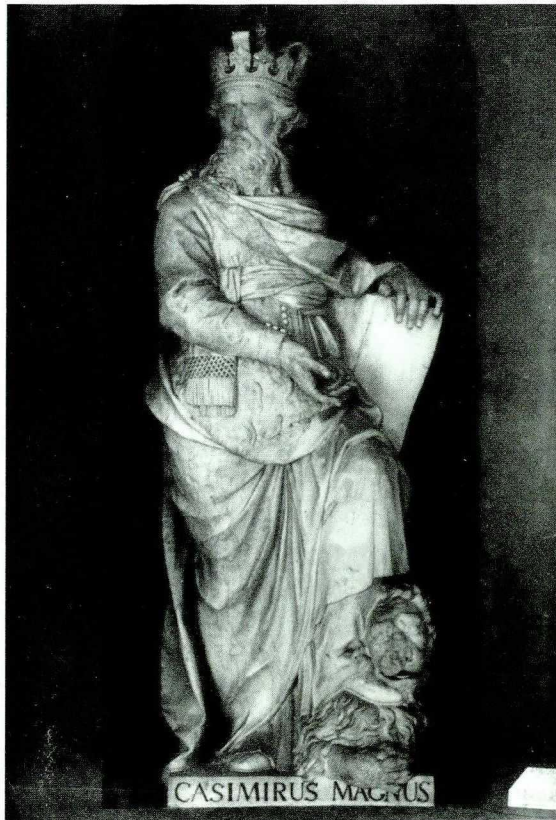
11. Giacomo Monaldi, Kazimierz Wielki , marmur biały, 1793 r. Pałac Na Wodzie w Łazienkach Królewskich w Warszawie.