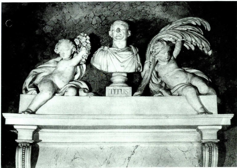
12. Giacomo Monaldi, Titus , marmur biały, 1795 r. Pałac Na Wodzie w Łazienkach Królewskich w Warszawie.