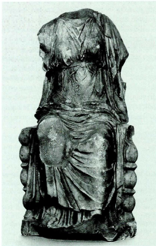
22. Kybele na tronie. Rzym, II w. n.e. (MNW nr inw. 149802).