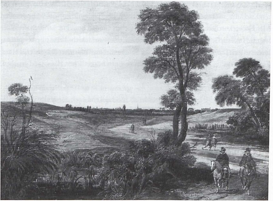
2 Esaias van de Velde: Reiter in einer Landschaft, 1614, Enschede: Rijksmuseum Twenthe.

ausgeführt, die zuvor nur mit einer zarten Imprimitur überzogen wurde (Abb. 2). 47 Durch die dünnen Farbschichten hindurch, die deutlich eine Verarbeitung Nass in Nass verraten, erkennt man die horizontal verlaufende Maserung des Holzes, die zum Stimmungs- und Ausdrucksträger wird. Es ist immer wieder beschrieben worden, dass Esaias van de Velde mit diesem gestalterischen Kunstgriff zum Vorläufer zahlreicher anderer Haarlemer Maler wurde, die diese dünne Malweise schon bald aufgriffen.