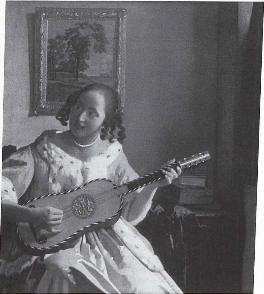
4 Jan Vermeer: Gitarrenspielerin, um 1669–1672, Kenwood: English Heritage as Trustees of the Iveagh Bequest.

wurde der den Zeitgenossen kaum bekannte Maler zur »Sphinx von Delft« und zu dem herausragenden Vertreter einer holländischen Kunst stilisiert, als der er heute weltberühmt ist. 64