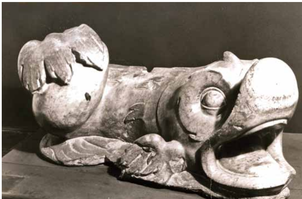
Marmurowy delfin wydobyty w 1906 r., pocztówka z XX w.