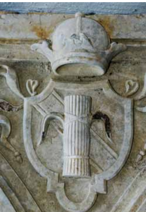
Herb Wazowski (snopek). Fot. Hubert Kowalski (2011)