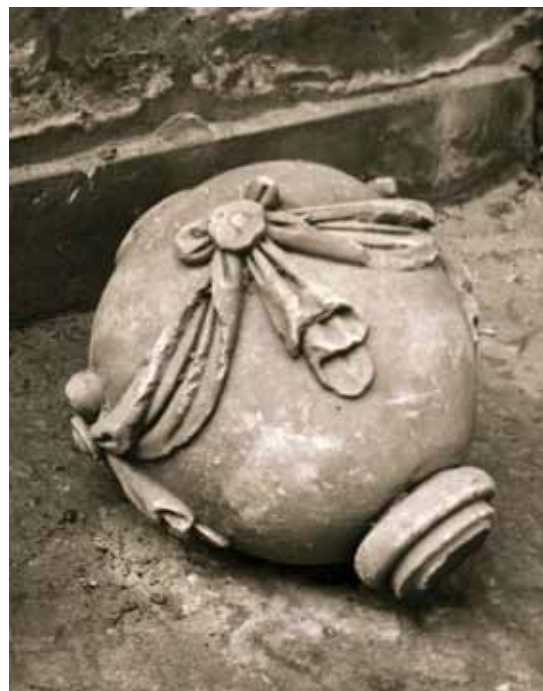
Rzeźby i dekoracje marmurowe wydobyte w 1906 r. przez warszawskich piaskarzy. Fot. z 1906 r.