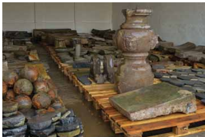
Rzeźbiarskie i architektoniczne elementy wydobyte z dna Wisły. Fot. Hubert Kowalski (2012)