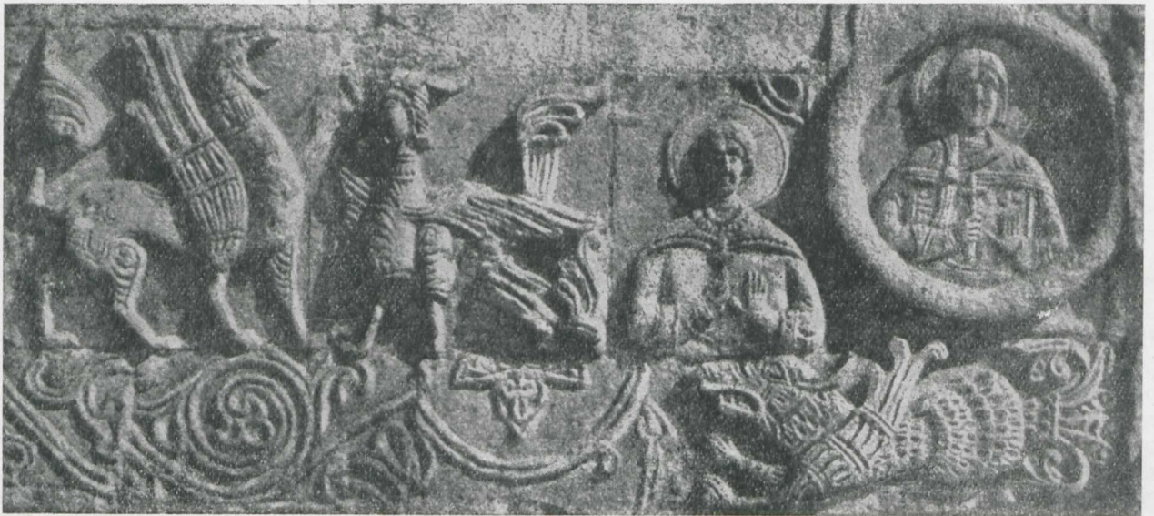
Ryc. 92. Juriew Polski. Fragmenty dekoracji rzeźbiarskiej z Soboru Georgija, wg IKDR, t. 1