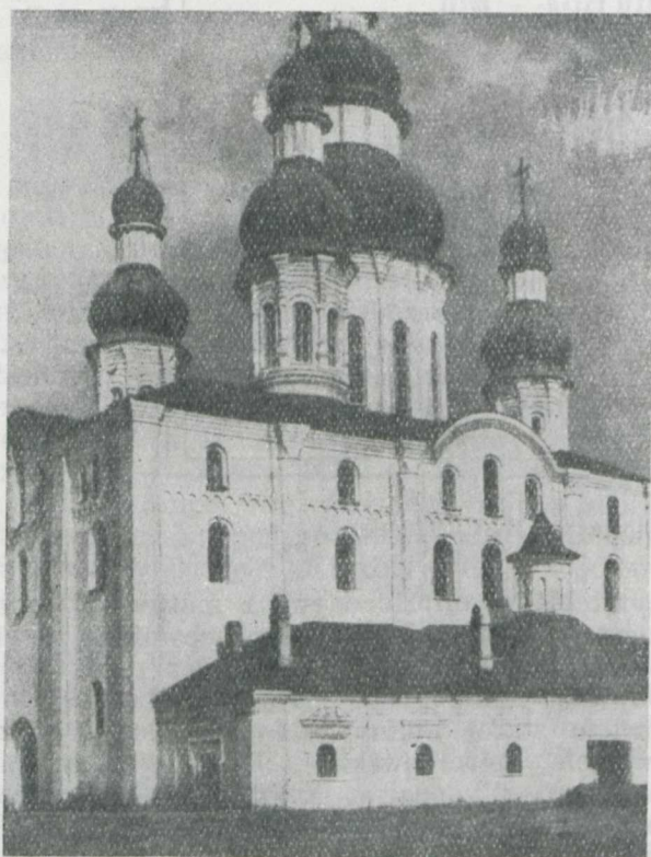
Ryc. 136. Sobór Uspenskiy Jeleckiego Monasteru w Czernihowie (XII w.) wg: Architektura Ukrainy SSR

niałym budowlom sakralnym wielkksiążęcego Kijowa, jakkolwiek były od nich różne. Pierwsze miejsce zajmuje sobór Spaso-Preobrażeński, fundacja brata ks. Jarosława Mądrego, Mściława, ks. czernihowskiego i tmutorokańskiego (um. 1036 r.), najstarszy zachowany budynek wszystkich rus. miast: trójnawowa podłużna,