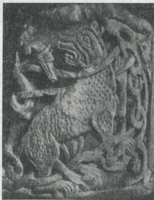
Ryc. 137. Głowice kolumn z ornamentem zoomorficznym. Sobór Borysa i Gleba w Czernihowie wg: Architektura Ukrainy SSR

sześcioramionowa, pięciokopułowa świątynia z emporami, na które prowadzą schody w wieży w rogu płn.-zach. fasady głównej; słupy między nawami uzupełnione są pod kopułą główną dwiema parami kolumn marmurowych, tak że przestrzeń pod kopułą pozostaje tylko częścią nawy głównej. Oświetlenie wnętrza było bardzo mocne, ściany z zewnątrz plastycznie ukształtowane i jasno rozczłonkowane. Z r. 1186 pochodził sobór Błagowieszczeński, pięcionawowy z dominującą nawą główną i transeptem,