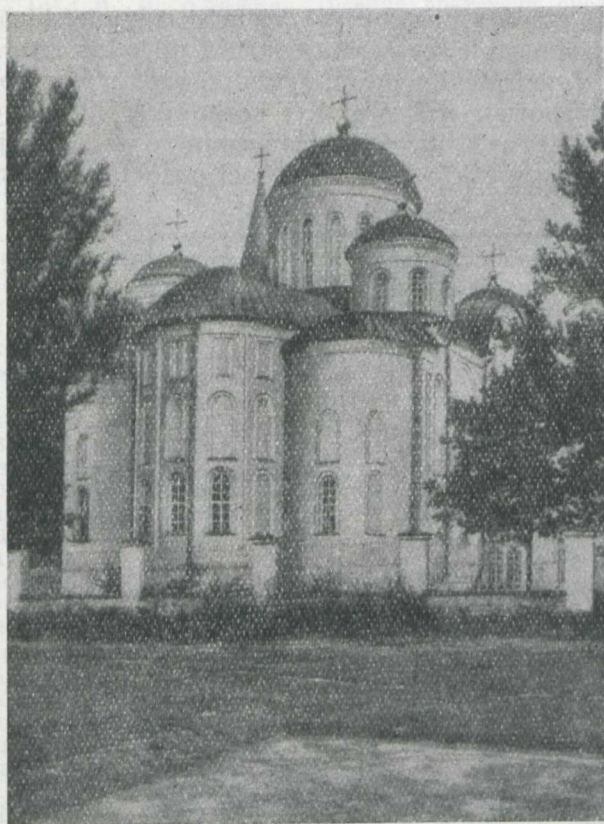
Ryc. 135. Sobór Zbawiciela w Czernihowie (1036 r.). Widok od wschodu wg: Architektura Ukrainy SSR