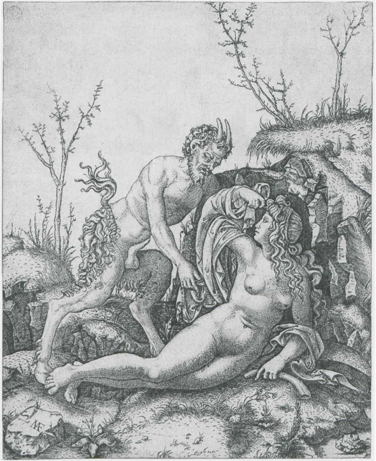
Abb. 4 Marcantonio Raimondi, Satyr nähert sich einer Nymphe , Kupferstich, 21,9 x 17,9 cm, London, The British Museum, Department of Prints and Drawings.

des Holzschnitts, des Kupferstichs oder der Radierung lassen sich neue Bildmodelle eben nicht nur experimentell erproben, sondern zugleich auch öffentlichkeitswirksam verbreiten. Für die Künstler hat dies jedoch zur Konsequenz, dass sie unter steigendem Innovationsdruck stehen: Stets müssen sie sich an den Leistungen ihrer Vorgänger und Kollegen messen lassen. Besonderen Geltungsanspruch erheben im Zuge der Renaissance zum einen die Werke italienischer Künstler, da diese sich der Antike näher wähnen als ihre nordeuropäischen Kollegen – was letztere wiederum zum Widerspruch herausfordert. Zum anderen sind es die druckgraphischen Arbeiten Albrecht Dürers, die den Status mustergültiger Meisterwerke für sich beanspruchen – und auch hier formiert sich, nicht zuletzt unter seinen Schülern und Mitarbeitern, bald ein bildlicher Gegendiskurs. Das Widerspiel von Normsetzung und Normverletzung ist denn auch ein tragendes Leitmotiv des vorliegenden Bandes, der auf vielfältige Weise vorführt, wie Konventionen unterlaufen und Traditionsbestände zur Disposition gestellt werden. Künstlerische Subversion bedeutet hier stets die Infragestellung orthodoxer Ordnungen – von religiösen Institutionen bis hin zum Kanon antiker Meister-