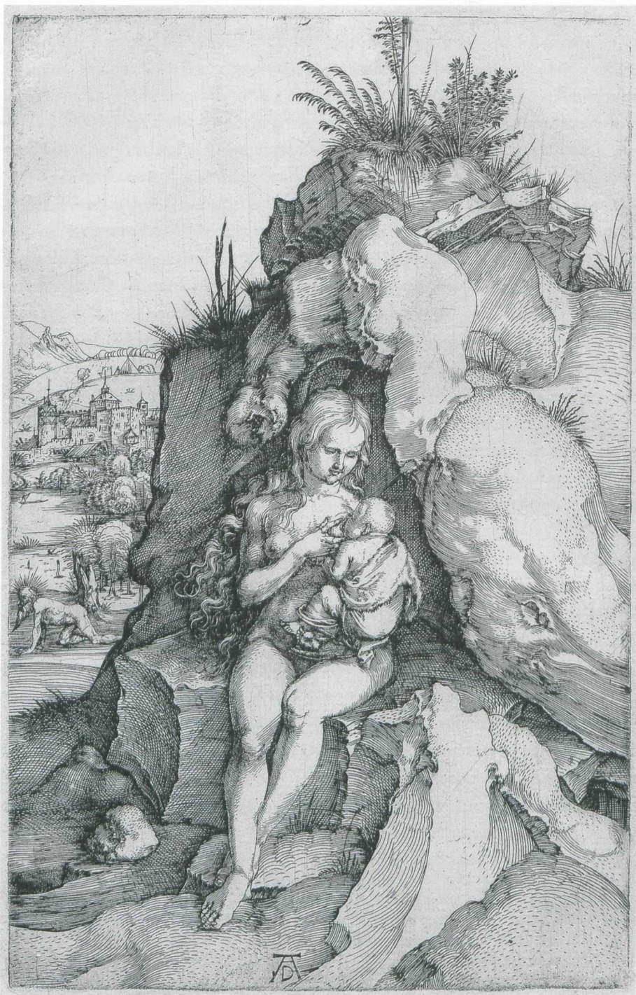
Abb. 1 Albrecht Dürer, Die Buße des Hl. Chrysostomus , Kupferstich, 18,3 x 12 cm, London, The British Museum, Department of Prints and Drawings.