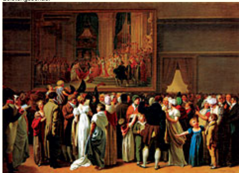
Abb 3: Louis Léopold Boilly, "Zuschauer im Salon bei der Betrachtung des Sacre", 1808/19. - In den Ausstellungen der Royal Academy in London wurde und wird die Kunst in ihrer gesellschaftlichen Relevanz befragt und politisch instrumentalisiert.