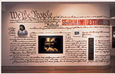
Abb. 9: Group Material, "Constitution", The Temple Gallery, Philadelphia 1987. - Das Konzept des Displays ermöglicht von künstlerischer wie von kuratorischer Seite die Thematisierung stereotyper Wahrnehmungs- und Wertungsmuster.