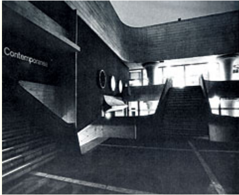
Abb. 17: "Contemporanea", Ausstellung in der Garage der Villa Borghese, Rom 1973/74. - Der Kurator Achille Bonito Oliva transformiert Funktionsräume, wie etwa die Tiefgarage.