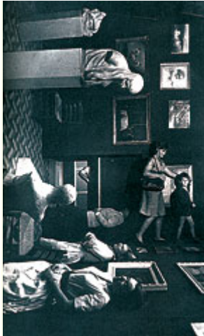
Abb.8: Daniel Spoerri, Installation in der Ausstellung "Dylaby", Stedelijk Museum, Amsterdam 1962. - "Dylaby" verwischte die Grenzen zwischen Ausstellung, Environment und Aktion. form a more perfect Union, establish Justice,