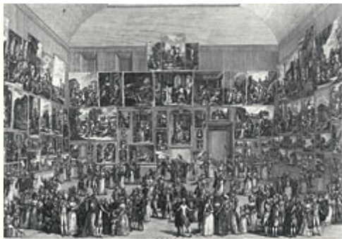
Abb 2: Pietro Martini, "Exposition au Salon de Louvre en 1787", 1787. - Der Pariser Salon bot den frühen Rahmen für die künstlerischen Auseinandersetzungen mit den Implikationen dieser temporären Leistungsschau.