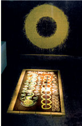
Abb. 21: "Magiciens de la terre", Centre Georges Pompidou, Paris 1989. - "Magiciens de la Terre" musste als eine der ersten Ausstellungen, die den ethnographischen Blick in den Präsentationsort aufnehmen, als Paradebeispiel für die dabei auftretenden Probleme herhalten.