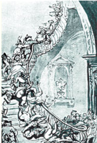
Abb. 1: Thomas Rowlandson, "The Exhibition Stare Case", um 1800. - Kunst findet statt und alle müssen sich beeilen, in kurzen Momenten Gleichzeitigkeit erfahren zu dürfen.

Über die Ausstellung als Ort und Ereignis der Kunst POLEMIK ODER APOTHEOSE?