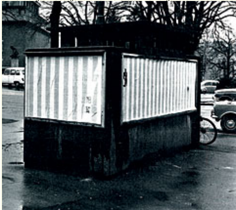
Abb. 14: "When Attitudes Become Form", Kunsthalle Bern 1969, Außenaufnahme mit der Arbeit von Daniel Buren. - Harald Szeemanns Schau thematisierte nicht nur den Raum, sondern führte die Ausstellung über die Grenzen der Berner Kunsthalle hinaus.