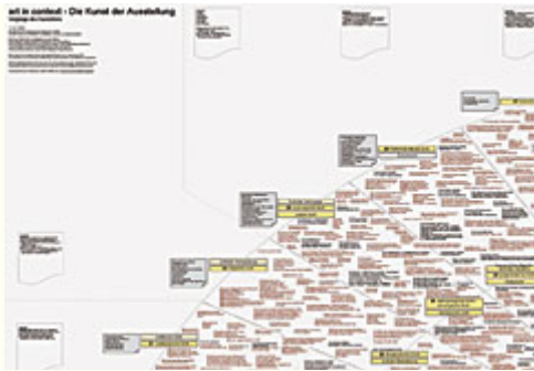
Abb 4: Gerhard Dirmoser, "art in context - Die Kunst der Ausstellung", 1995/2001. - Kunstausstellungen schreiben Geschichte, und die Geschichtsschreibung reiht sie aneinander. An die Stelle einer kohärenten Entwicklung mit synchroner Homogenität tritt vielmehr ein komplexes Geflecht von Typologien.

Die Situation der Ausstellung ist immer eine konkrete. Die künstlerische Geste wird einer Wahrnehmungsdisposition ausgesetzt. Das Museum sucht nach einem gültigen, zeitlosen Platz mit möglichst idealen Bedingungen für eine ungestörte ästhetische Wahrnehmung. Die Ausstellung sucht dagegen die Interaktion aus der Zeitgenossenschaft heraus. Sie konfrontiert Wirkungsansprüche mit Haltungen, die in ihrer jeweiligen Bedingtheit zu Urteilsfindungen führen. Die genauere Bestimmung der möglichen Wahrnehmungshaltungen macht deutlich, dass die Ausstellung ein Podium, ein Labor für mögliche Paradigmenwechsel in der Geschichte der Kunstwahrnehmung bietet.