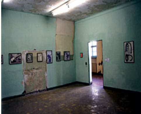
Abb. 18: 4. Berlin Biennale, 2006, Jüdische Mädchenschule, Ausstellungsansicht mit Arbeiten von Dorota Jurczak. - Die Berlin Biennale 2006 "bespielte" eine ehemalige jüdische Mädchenschule, eine Kirche, eine private Künstlerwohnung.