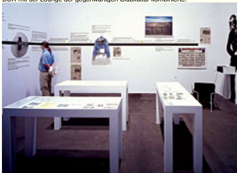
Abb. 19: "Fraktale IV", Palast der Republik, Berlin 2005. - Kurz vor dem Abriss des Palasts der Republik fand eine Ausstellungsreihe ohne institutionellen Hintergrund statt, welche die Ruinenästhetik der DDR mit der Lounge der gegenwärtigen Clubkultur kombinierte.