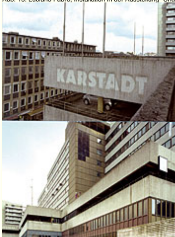
Abb. 16: "Stille der Stadt", Video-Ausstellung im leerstehenden Karstadt-Gebäude, Hamburg-Altona 2006. - Der Kurator transformiert Funktionsräume, wie etwa das Kaufhaus.