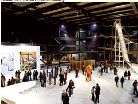
Abb. 19: "Fraktale IV", Palast der Republik, Berlin 2005. - Kurz vor dem Abriss des Palasts der Republik fand eine Ausstellungsreihe ohne institutionellen Hintergrund statt, welche die Ruinenästhetik der DDR mit der Lounge der gegenwärtigen Clubkultur kombinierte.