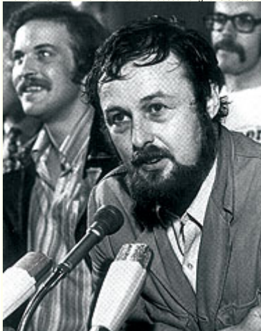
Abb. 23: Harald Szeemann bei der Documenta 5, Kassel 1972. - Abseits von Starallüren hat sich das Verständnis etabliert, dass eine Ausstellung sowohl Thesen und Wertungen formuliert als auch selbstverständlich eine Persönlichkeit als Referenzpunkt bedingt.