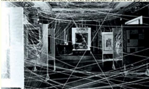
Abb. 7: Marcel Duchamp, Verspannung mit 16 Meilen Schnur in der Ausstellung "First Papers of Surrealism", New York 1942. - Duchamp ließ die klassische Form der Tafelbilder hinter einem Fadengewirr unzugänglich werden und lieferte damit ein frühes Beispiel für den Ausstellungsraum als Erlebnisort.