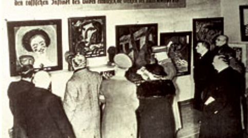
Abb 5: "Entartete Kunst", Haus der Deutschen Kunst, München 1937. - Zweifelsohne das prominenteste Beispiel für ideologischen Missbrauch und Propaganda.