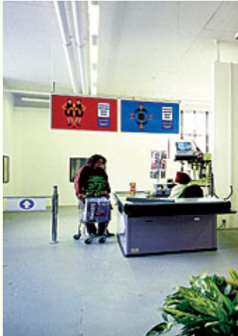
Abb. 13: Rirkrit Tiravanija, "Das soziale Kapital", Ausstellungsansicht "Supermarket", Migros Museum für Gegenwartskunst, Zürich 1998. - Im Kunstort werden die ästhetischen Erfahrungen zurückgebunden an Handlungsanweisungen und Funktionszusammenhänge kunst-fremder Räume.