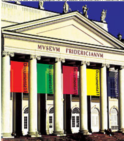
Abb. 22: Documenta 11, Museum Fridericianum, Kassel 2002. Die fünf Banner stehen für die fünf Plattformen. - Okwui Enwezors Idee der Plattformen als Satelliten der Documenta 11 wertete die internationale Kommunikation als Voraussetzung für die Auseinandersetzung mit Kunst und Globalisierung in programmatischer Weise auf.