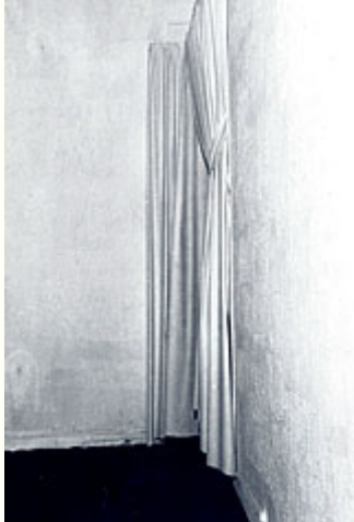
Abb. 11: Yves Klein, "Le Vide", Galerie Iris Clert, Paris 1958. - Für die geladenen Gäste wurde ein aufwändiges Spektakel in Szene gesetzt, um die leere Galerie als immaterielle Zone zu erleben.