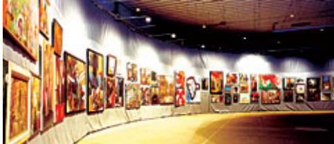
oben: Abb. 6: Aufstieg und Fall der Moderne", Teil III: Offiziell inoffiziell - Die Kunst der DDR, Mehrzweckhalle (Halle der Volksgemeinschaft), Weimar 1999. - Der Streit um die Weimarer Ausstellung wurde nicht nur in den Zeitungen, sondern auch von den Künstlern geführt, die gegen die Präsentationsform Klage erhoben.