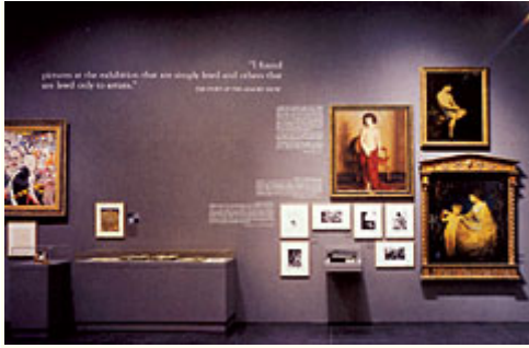
Abb 12: Joseph Kosuth, "The Play of the Unmentionable", Brooklyn Museum, New York 1992. - Kosuth kombinierte ausgewählte Werke der Museumssammlung mit einer Auswahl von Zitaten, die aus der Geschichte der Zensur stammen. Der Künstler bezeichnete sich in diesem Zusammenhang als Autor und die Ausstellung als Text.

Im Medium der Ausstellung wurde die sich verselbständigende Sinnhaftigkeit des Parergons 12 erkannt und bearbeitet und das Werk mit der Komplexität der Bedingtheit des Rahmens konfrontiert. In den transitiven Inszenierungen ließ man das Kunstwerk ebenso zum Kultobjekt wiederauferstehen, wie als Opfer der Schändung preisgeben. 13 Zweifelsohne ist die Ausstellung "Entartete Kunst" von 1937 im Münchner "Haus der Deutschen Kunst" das prominenteste Beispiel für ideologischen Missbrauch und Propaganda. 14 (Abb. 5) Man muss allerdings nicht auf Extremfälle zurückgreifen, um zu zeigen, dass Ausstellungen immer wieder als Manipulationsorte und Verfälschungsgrundlage benutzt wurden. Der Streit um die Weimarer Ausstellung "Aufstieg und Fall der Moderne" von 1999 wurde nicht nur in den Zeitungen, sondern auch von den Künstlern geführt, die gegen die Präsentationsform Klage erhoben. 15 (Abb. 6)