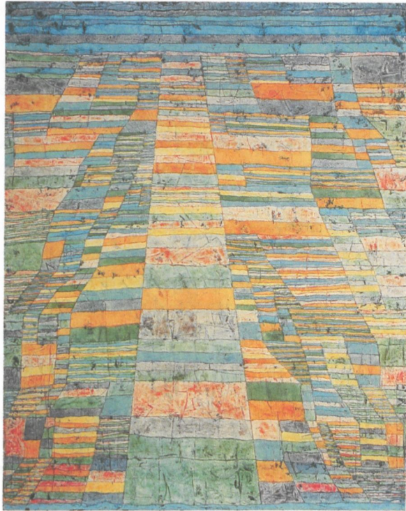
I Paul Klee (1879–1940), Hauptweg und Nebenwege , 1929, 90 (R 10), Ölfarbe auf Leinwand auf Keilrahmen, 83,7 x 67,5 cm, Museum Ludwig, Köln

eine raumzeitliche Bewegung. Auf diese Weise soll, wie Giedion-Welcker mit Hugo Ball formuliert, nicht unbedingt Kunst im ästhetischen Sinne, sondern das «inkorrumperte Bild» hervorgebracht werden. 27 Klees Deutung der Kinderzeichnung signalisiert modellhaft die Abkehr von einer Gegenstandsbeschreibung und die Hinwendung zu einer Art kreativer Erforschung der Welt: «Ein Kind zeichnet und malt, wie es denkt. Seine Bilder – wenn sie rein und unverdorben bleiben – sind Bilder einer inneren Auseinandersetzung, eines inneren Fortschreitens im Durchdringen der Welt. Sie haben in ihrer Natürlichkeit ein eigenes Gesetz. Sie weisen auf ferne Zustände, innige, längst verlorene, die nur mühsam einzuholen sind.» 28