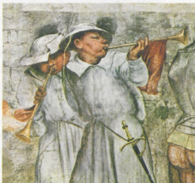
7 Girolamo Romanino: Zwei Soldaten (Detail aus dem Freskenzyklus). Breno, Sant'Antonio

Es ist ein bemerkenswerter Umstand, dass Romanino seine Quellen nie buchstäblich zitierte. Vielmehr passte er diese deutschen Charaktere in seinen eigenen individuellen Kontext ein, mit dem Ziel, eine groteske visuelle Sprache zu entwickeln, die ihren Höhepunkt in den kühnen Fresken erreichte, die er in den späten 1530er Jahren in Sant'Antonio in Breno (Valcamonica) malte (Abb. 7).