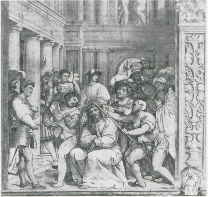
6 Girolamo Romanino: Dornenkrönung Christi. Cremona, Kathedrale

und venezianischer Elemente auf. Im Gegensatz dazu nimmt Romaninos venezianisches Repertoire in den aufsehenerregenden Passionsszenen, die er 1519 im Langhaus der Kathedrale von Cremona freskierte, dramatischere und exzentrischere Züge an. So stehen in der Szene mit der Darstellung der Dornenkrönung (Abb. 6) die klassische Architektur und der giorgioneske ›Dandy‹ im Mittelgrund in krassem Widerspruch zu dem kranken Expressionismus der Figuren im Vordergrund, letztere inspiriert von nordeuropäischen Drucken. Die Drucke lieferten die rhetorischen Instrumente für einen dramatischeren, nahezu brutalen Stil und wurden von nichtkonformistischen Renaissancekünstlern aus der Lombardei häufig konsultiert. 9