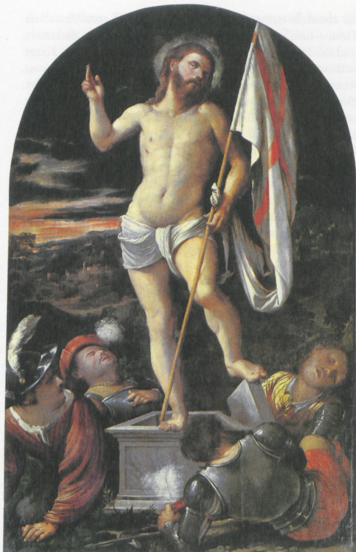
3 Girolamo Romanino: Auferstehung Christi. Capriolo, Pfarrkirche