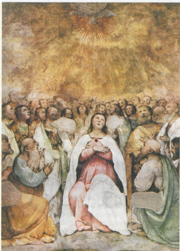
8 Girolamo Romanino: Pfingstdarstellung. Brescia, San Francesco

lern. Cellini, der bei ihm zu Gast war, als er sich auf dem Weg zu König Franz I. befand, beurteilte Bembos Kunstgeschmack zwar recht kritisch, lobte aber seine Großherzigkeit wie auch