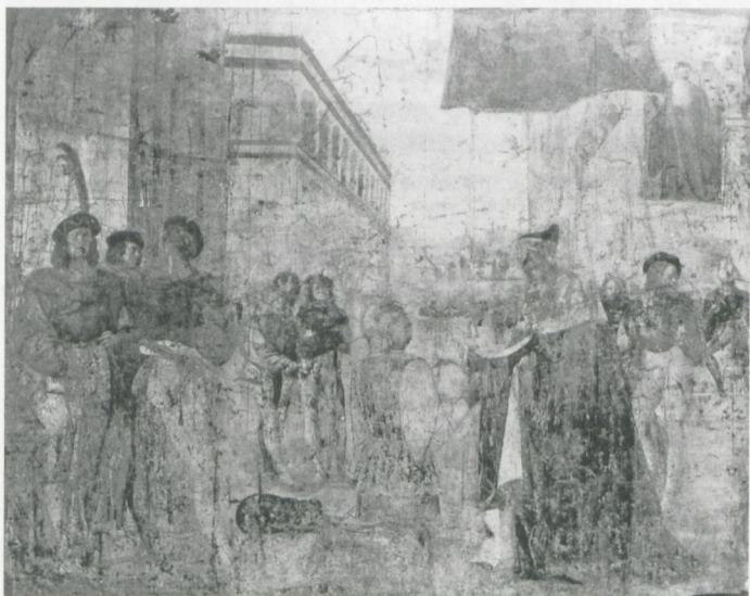
5 Girolamo Romanino: Nicolò Orsini empfängt das Banner vom Dogen von Venedig. Budapest, Szépművészeti Múzeum

Ähnliche Merkmale sind in Romaninos Freskenzyklen zu erkennen. Die fragmentarisch erhaltenen Fresken für die Loggia von Nicolò Orsini in Ghedi (Abb. 5), die 1508/09 ausgeführt wurden, weisen mit ihren Gebäuden im Bramantinostil und den giorgionesken Figuren, alles in tadellosem Hochrenaissancestil gemalt, eine gekonnte Kombination lombardischer