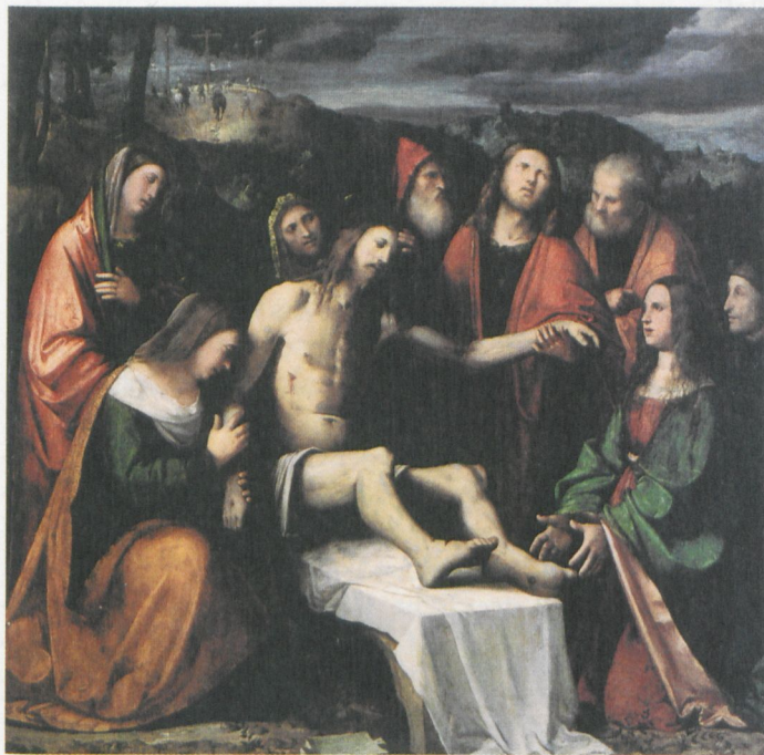
1 Girolamo Romanino: Beweinung Christi. Venedig, Accademia

aus den Ergebnissen zu lernen, die in anderen Forschungsbereichen erbracht worden sind, allen voran im Feld der Literaturgeschichte. Seit den frühen 1980er Jahren haben Wissenschaftler Künstler wie Giorgione und Aspertini im Licht ihrer »literarischen Pendants« erforscht. 6 Ebenso versucht dieser Beitrag, Romaninos Werke im Kontext heterodoxer literarischer Experimente des 16. Jahrhunderts zu lesen, und zwar ganz konkret ihr Verhältnis zu den Veröffentlichungen des begabtesten antiklassischen Schriftstellers jener Zeit zu beleuchten, des Benediktinermönchs Teofilo Folengo. Die Gefahr eines solchen Vorhabens liegt darin, Gemälde als bloßen