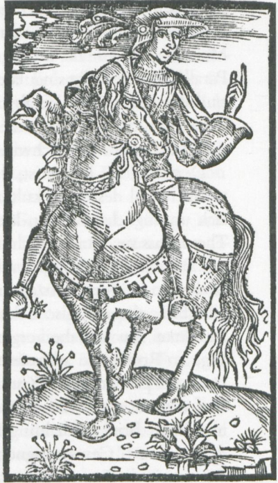
9 Guidone zu Pferd. Holzschnitt aus dem »Opus Merlini Cocaii poetae Mantuani Macaronicorum«, Toscolano

eng mit Santa Eufemia verbunden. 51 Ohne Zweifel ist die zweite Baldus -Ausgabe ein Brescianer Produkt, und damit ist es auch wahrscheinlich, dass die vierundfünfzig Holzschnitte, die dieses ambitionierte Buch illustrieren, ebenfalls in Brescia entworfen wurden. Da dem Holzschnitzer die Übertragung der bizarren Zeichnungen nur schlecht gelungen ist, lässt sich unmöglich nachweisen, dass hinter den Entwürfen dieser Drucke Girolamo Romanino stand; gleichwohl zeigt das Blatt mit der Darstellung Guidones zu Pferd ganz deutlich, dass der Autor offensichtlich als Künstler in Mailand, Cremona und Brescia aktiv war (Abb. 9). Im vorliegenden Kontext ist man versucht, die