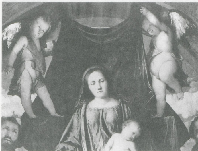
2 Girolamo Romanino: Madonna mit dem Kind und Heiligen (Detail). Brescia, San Francesco