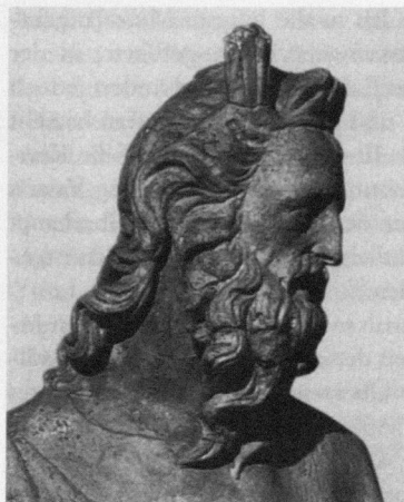
Abb. 7: Giovanni Pisano: Moses von der Sieneser Domfassade , Siena, Domopera, Ende 13. Jahrhundert.

Doch alt' und neue [Künstler] – nimmer ward erfahren, Daß sie gemalt, was in die Zukunft fällt. Und doch hat man Geschichten schon gesehen, Die man gemalt, bevor sie noch geschehen.