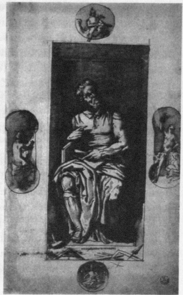
Abb. 8: Federico Zuccari: Michelangelo als Moses , Uffizien, GDS, Inv. 11023.

Auch aus dem Mittelalter ist hohe Wertschätzung von Werken der Bildenden Kunst überliefert, die Person des Künstlers wird jedoch wiederum – mit bemerkenswerten Ausnahmen – selten gelobt. 50 Daß seit dem 14. Jahrhundert in Italien nicht nur dem Werk ( artifitium ; opus ) und der Kunst bzw. der Technik ( ars ) des Künstlers, sondern auch dem artifex höchstes Lob gespendet wird, markiert einen Paradigmenwechsel. Die Künstlerviten Vasaris schließlich sind von einer »Heroisierung des Künstlers« 51 gekennzeichnet, die den individuellen Charakter des Künstlers in neuartiger Weise als Quelle seines Stils be-