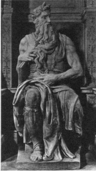
Abb. 4: Michelangelo: Moses , Rom, S. Pietro in Vincoli.