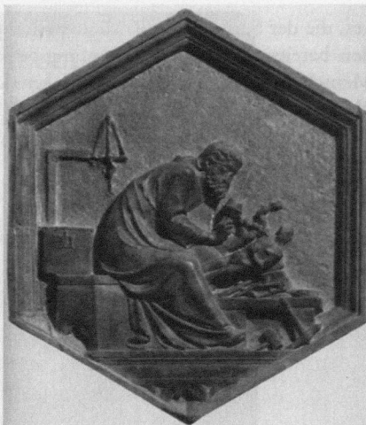
Abb. 2: Andrea Pisano, Campanilerelief: Die Skulptur , Florenz, Domopera (ehemals S. Maria delle Fiore), ab 1334.

Darstellung Gottes, welcher die von ihm zuvor modellierte Gestalt des Adam be-seelt, durch Körperhaltung und Kompositionsschema in eine augenfällige Analogie gesetzt (Abb. 1 und 2).