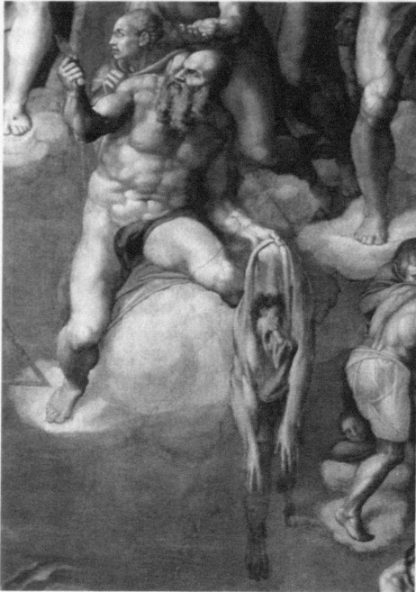
Abb. 9: Michelangelo: Jüngstes Gericht , Rom, Cappella Sistina, Detail.

ursprünglich für sein eigenes Grabmahl bestimmten Pietà des Dom-museums von Florenz in einem Brief als Selbstdarstellung des Bildhauers. 82 Eine autobiographische Deutung des Siegers ist ebenfalls bereits im 16. Jahrhundert greifbar: der Bildhauer Vincenzo de' Rossi hat in eine vor 1584 entstandene Variation dieser Skulpturengruppe Michelangelos, seine Skulptur Herkules und Kakus 83 , ein Porträt Michelangelos eingefügt. 84 Die abgezogene alte Haut des Hl. Bartholomäus aus Michelangelos Jüngstem Gericht (Abb. 9) zeigt nach übereinstimmender Meinung der kunsthistorischen Forschung seit 1925 ein Selbstbildnis Michelangelos, wofür es allerdings keinen zeitgenössischen Beleg gibt. 85