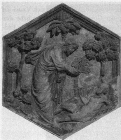
Abb. 1.: Andrea Pisano, Campanilerelief: Erschaffung Adams , Florenz, Domopera (ehemals S. Maria delle Fiore), ab 1334.