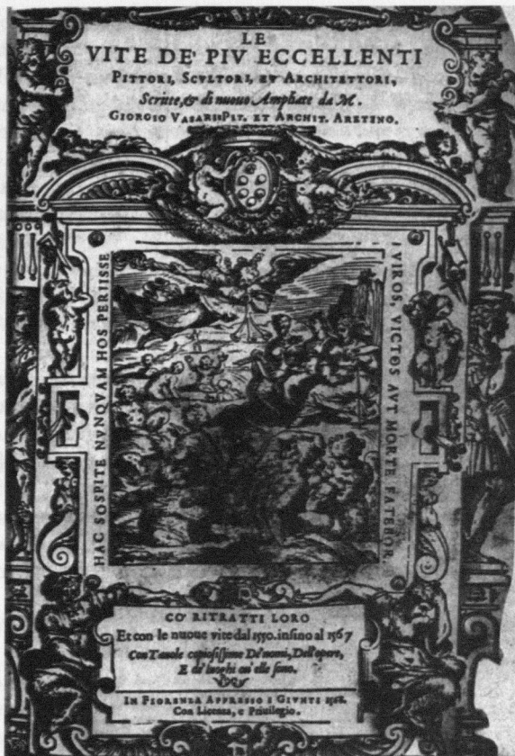
Abb. 3. Giorgio Vasari: Allegorie der Künste und des Ruhmes , Frontispiz der 2. Auflage der Vite von 1568 (Version B).

Vasari akzentuiert hier die topische Analogie zwischen Gott und Künstler in einer Weise um, in der die »Wertnormen des [...] Religiösen in ihrer Gültigkeit zugunsten des Ästhetischen« wenn nicht »ignoriert werden« 5 , so doch relativiert erscheinen. Der pagane Topos von der Lebendigkeit des Kunstwerks und insbesondere figürlicher Statuen gewinnt bei Vasari vor der Folie der christlichen Eschatologie neue Brisanz. Dies macht die sog. Allegorie der Künste und des Ruhmes deutlich, ein Holzschnitt, der nicht nur am Anfang von zwei der drei Versionen der Giuntina von 1568 steht (Abb. 3), sondern auch in allen Versionen dieser zweiten Auflage am Ende er-