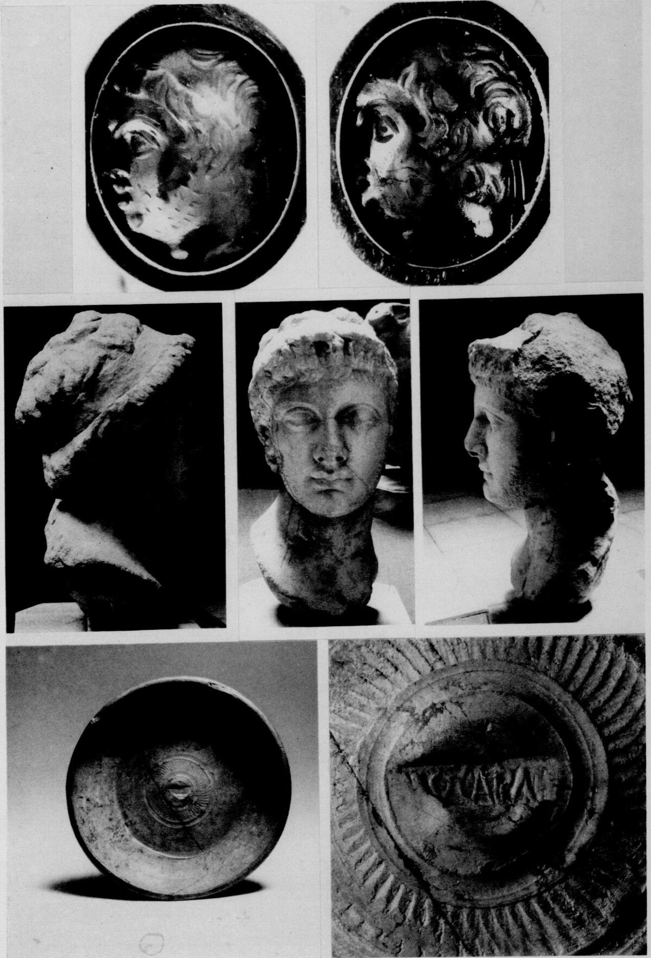
1-3. Hellenistische Gemme. Münster. - 4-5. Hellenistischer Porträtkopf. Antakya. - 6-7. Terra Nigra-Teller aus Everswinkel, Kr. Warendorf. Münster.