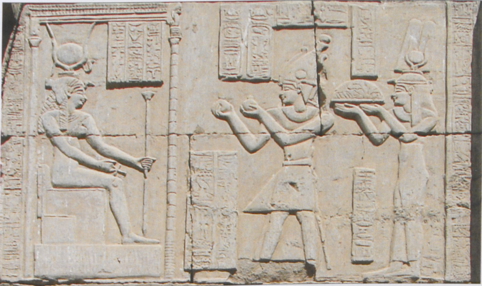
Abb. 5: Kom Ombo, Hathorkapelle: Marc Aurel und Hathor vor Tasenetneferet.

schen Kaiserinnen auch in Ägypten ihren Mann nicht in den Kultszenen begleiten. Denn sie waren ja bereits aus römischer Sicht keine Kaiserinnen, hatten anders als der Kaiser kein imperium . Er wurde zum imperator erhoben, seine Frau aber nicht zur imperatrix . Wenn schon die Römer die Frau des Kaisers sozusagen nicht als „Kaiserin“ ansahen, dann konnte sie ja auch davon abweichend in Ägypten schlecht als Königin erscheinen. 55 Hieraus ergab sich aber, da in der ägyptischen Kunst der König ohnehin sehr häufig allein gezeigt wurde, trotz der wichtigen theologischen Funktionen der ägyptischen Königin für die Darstellungen in der Römerzeit kein besonderes Problem.