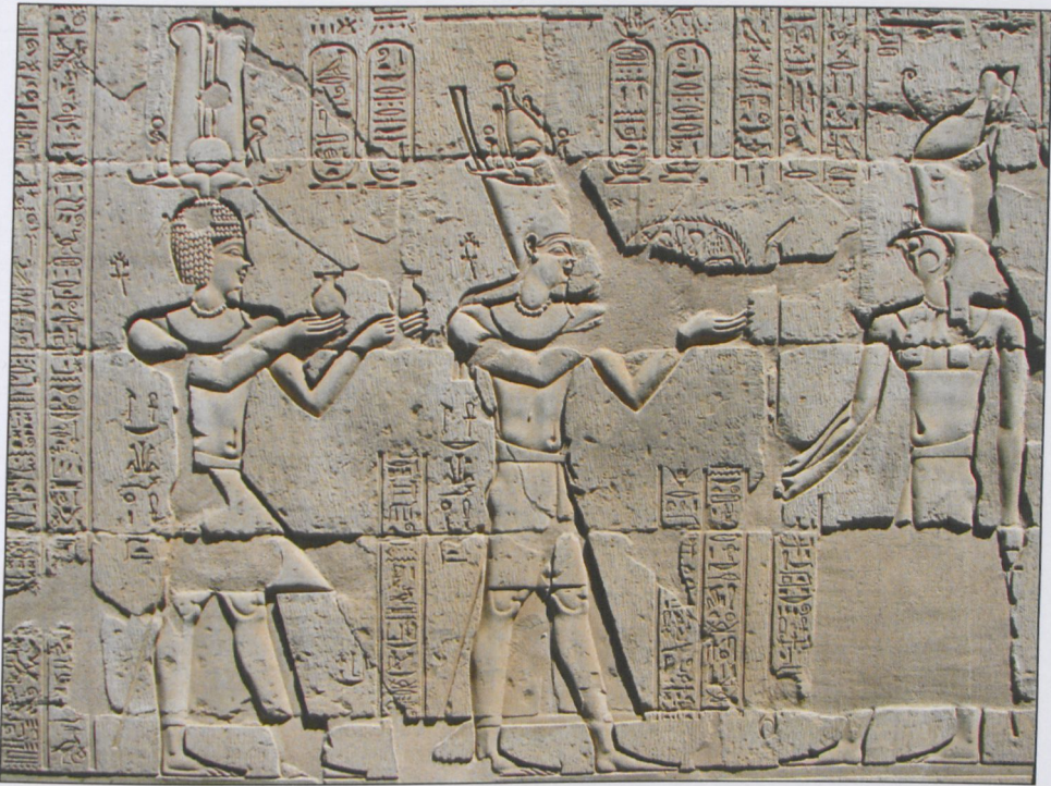
Abb. 3: Kom Ombo, sog. Kaisergang: Marc Aurel und Lucius Verus vor Haroeris.

Ritualszene des sog. „Kaisergangs“, in dessen Darstellungen sich in bemerkenswerter Weise die politischen Verhältnisse des 2. und 3. Jh. n. Chr. niedergeschlagen haben, 51 Marc Aurel und Lucius Verus zusammen beim Opfer abgebildet (Abb. 3). 52 Beide waren am 7. März 161 zu Kaisern erhoben worden. Die daraus resultierende besondere Situation, daß es eben gleichzeitig zwei Kaiser gab, bis Lucius Verus Anfang 169 starb, wurde hier in der Szene berücksichtigt. Spätere Szenen zeigen folgerichtig Marc Aurel allein (dazu sofort mehr).