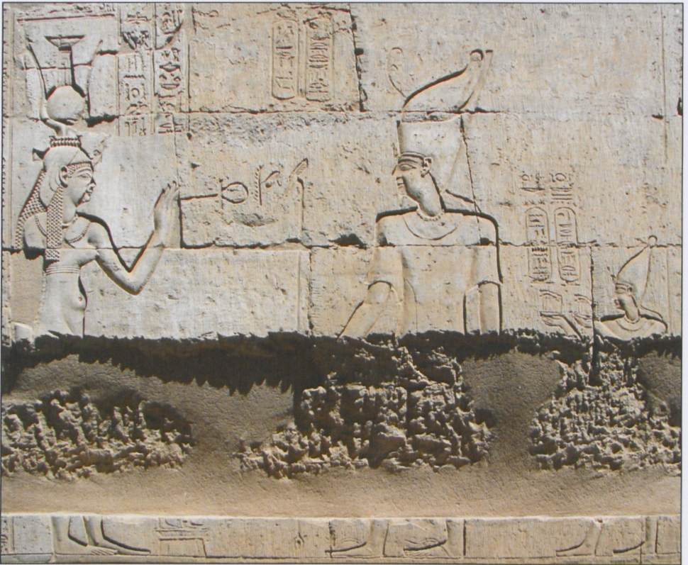
Abb. 4: Kom Ombo, sog. Kaisergang: Macrinus und Diadumenianus vor Nephthys und einer Kindgottheit.

und seinen erst um die zehn Jahre alten Sohn Diadumenianus, der den Caesar-Titel führt. Erst Ende Mai 218 wurde Diadumenianus zum Augustus erhoben – dieser Titel fehlt in der Kartusche; das Relief ist also vorher eingemeißelt worden.