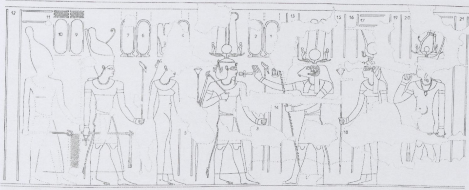
Abb. 2: Esna, Säulenhalle, Szene Esna VI 496: Septimius Severus, Julia Domna, Caracalla und Geta vor Chnum, Nebetuu und Heka.

eigentlich hießen, und in dem Augenblick, als man sich entschlossen hatte, ptolemäische Szenen zu kopieren, auch den Namen „Kleopatra“ für die Königin übernahm. 45