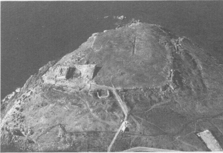
Abbildung 3: Das Demenzentrum Sunion

Die athenischen Demen bildeten als Subeinheiten der Polis zwar auch verfassungsrechtlich konstituierte und entsprechend institutionell ausgestaltete Einheiten mit einem Demarchen an der Spitze und einer eigenen Demenversammlung. Das galt aber für alle Demen, die also unbeschadet ihrer Größe und ihres urbanen Zuschnitts (un-