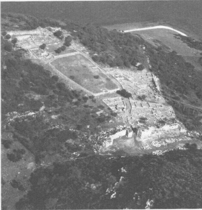
Abbildung 1: Das Demenzentrum von Rhamnus

v. Chr. eine radikale, auf einem rein territorialen Ordnungsprinzip aufbauende Neuordnung des athenischen Bürgerverbandes ins Werk gesetzt. Die Basis dieser Neuordnung bildeten die einzelnen Demen, die allerdings auf der Grundlage eines komplizierten Verteilungsverfahrens zu größeren politischen Einheiten (Phylen) zusammen-