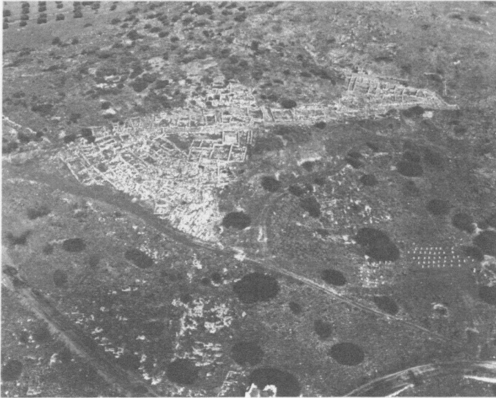
Abbildung 2: Der Westteil des Demenzentrums von Thorikos

Um was es hier vor allem gehen soll, das ist die urbane Siedlungsstruktur eines Teils der attischen Demen, deren besonderer Charakter immer noch allzu wenig wahrgenommen wird. Hans Rupprecht Goette hat jüngst in einem grundlegenden Aufsatz am Beispiel der attischen Demen Piräus, Rhamnus, Sunion und Thorikos den städtischen Zuschnitt der zugehörigen Demenzentren herausgestellt 24 . Von Festungsmauern umgeben verfügten diese Siedlungen über eine dichte Wohnbebauung, öffentliche Platzanlagen, Theater und Heiligtümer; und im Fall von Rhamnus verband sogar eine repräsentative, mehr als 1 km lange Gräberstraße das Südtor des Demenzentrums mit dem extraurbanen Heiligtum der Nemesis (vgl. hierzu die Abb. 1–3).