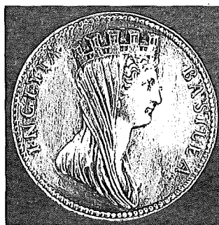
«INCLYTA BASILEA» (berühmte Basilea). Stadtpersonifikation mit Mauerkrone, Ende 17. Jahrhundert.