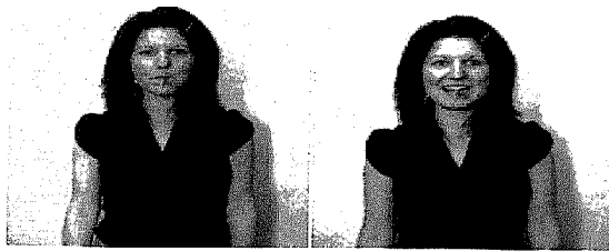
Abb. 5: Stimmungsinduktion bei der Fragebogenbearbeitung Der Stift ist entweder zwischen die Lippen (negative Stimmung) oder zwischen den Schneidezähnen (positive Stimmung)

Insgesamt nahmen 109 Studierende an den Universitäten Salzburg und Heidelberg im Rahmen von zwei Vorlesungen teil (86 Frauen und 23 Männer).