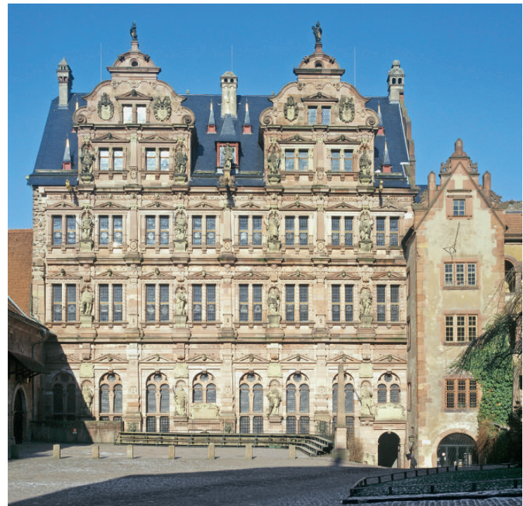
3 Der Friedrichsbau des Heidelberger Schlosses mit wittelsbachischer Ahnengalerie

Im 15. Jahrhundert wurde der große Saal des Heidelberger Schlosses mit einem genealogischen Figurenprogramm der Wittelsbacher seit ihrem Herrschaftsantritt als Herzöge von Bayern 1180 wie als Pfalzgrafen bei Rhein 1214 ausgemalt. Diese Bilder gingen verloren, ein vergleichbarer Zyklus im Amberger Schloss blieb nur mittelbar erhalten. Doch ein Heidelberger Holzschnitt des 16. Jahrhunderts, frühneuzeitliche Abzeichnungen der Amberger Bilder und ein archivalischer Neufund aus der ersten Hälfte des 15. Jahrhunderts erlauben die Rekonstruktion des mittelalterlichen Programms. Es gibt beredt Auskunft über das genealogische Wissen und Wollen der kurpfälzischen Wittelsbacher. Anders als die Bildpropaganda ihrer bayerischen Verwandten in München verzichteten sie auf die Herleitung von sagenhaften Urvätern wie Bavarus oder Norix. Die kurpfälzische Generationenfolge bewegte sich ganz im Rahmen gesicherten historischen Wissens und konzentrierte sich – mit kurzem Rückgriff auf Otto I. als Herzog von Bayern und auf dessen Sohn Ludwig I. – auf die Wittelsbacher im Amt der rheinischen Pfalzgrafen. Otto II. (1228–1253), der Gemahl der pfalzgräfinlichen Erb-