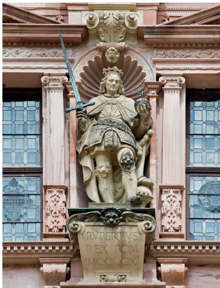
4 Darstellung König Ruprechts in der wittelsbachischen Ahnengalerie des Friedrichsbaus

zur Frau genommen. Noch heute signalisiert die einzigartige Krone aus ihrer Mitgift, im wittelsbachischen Schatz der Münchner Residenz verwahrt, die europäischen Bindungen der Kurpfalz (Abb. 6).