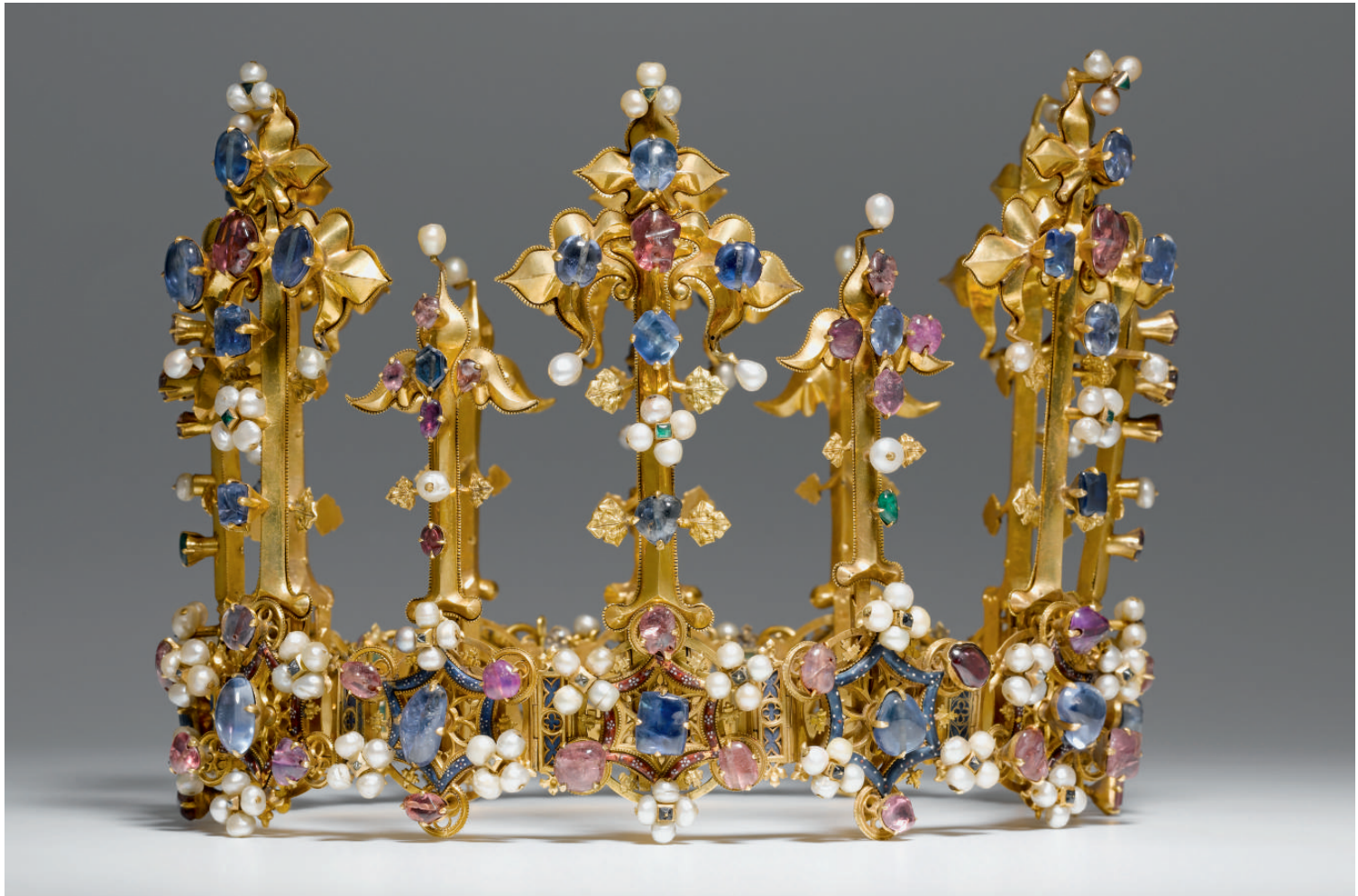
6 Krone aus der Mitgift der Pfalzgräfin Blanca, Tochter König Heinrich IV. von England, ca. 1370/80 | München, Bayerische Verwaltung der staatlichen Schlösser, Gärten und Seen, Residenz München, Schatzkammer

Ihr Erfolg beruhte auf der einzigartigen Herkunft der Pfalzgrafen des 12. und 13. Jahrhunderts, die aus den königsfähigen Familien der Staufer, Welfen und Wittelsbacher stammten. Die Fundamente für den Aufstieg legte Pfalzgraf Konrad (1156–1195), der Halbbruder Kaiser Friedrichs I. Barbarossa. Im Bund mit dem Kaiser organisierte Konrad das Erbe der Salier am nördlichen Oberrhein, das den Staufern zugefallen war. So erhielt die Pfalzgrafschaft neben Bacharach am Mittelrhein mit Heidelberg einen neuen Zentralort, so entstand das Zisterzienserkloster Schönau als eine erste Grablege der Pfalzgrafen. Das auf salischen Fundamenten erblühende Fürstentum fiel nach Konrads Tod an seinen welfischen Schwiegersohn Heinrich (1195–1214, † 1227), den ältesten Sohn Heinrichs des Löwen und Bruder Kaiser Ottos IV. In den wenigen Jahren der unangefochtenen welfischen Monarchie sorgte Heinrich erneut für nützliche Königsnähe. Doch der erneuerte Krieg zwischen Staufern und Welfen um die römische Krone brachte auch das Ende der welfischen Pfalzgrafschaft. Für kurze Zeit hatte Heinrich 1213/14 noch seinen gleichnamigen Sohn an der Herrschaft beteiligt. Aber mit dem Tod dieses jüngeren Heinrichs und mit den Siegen über den welfischen