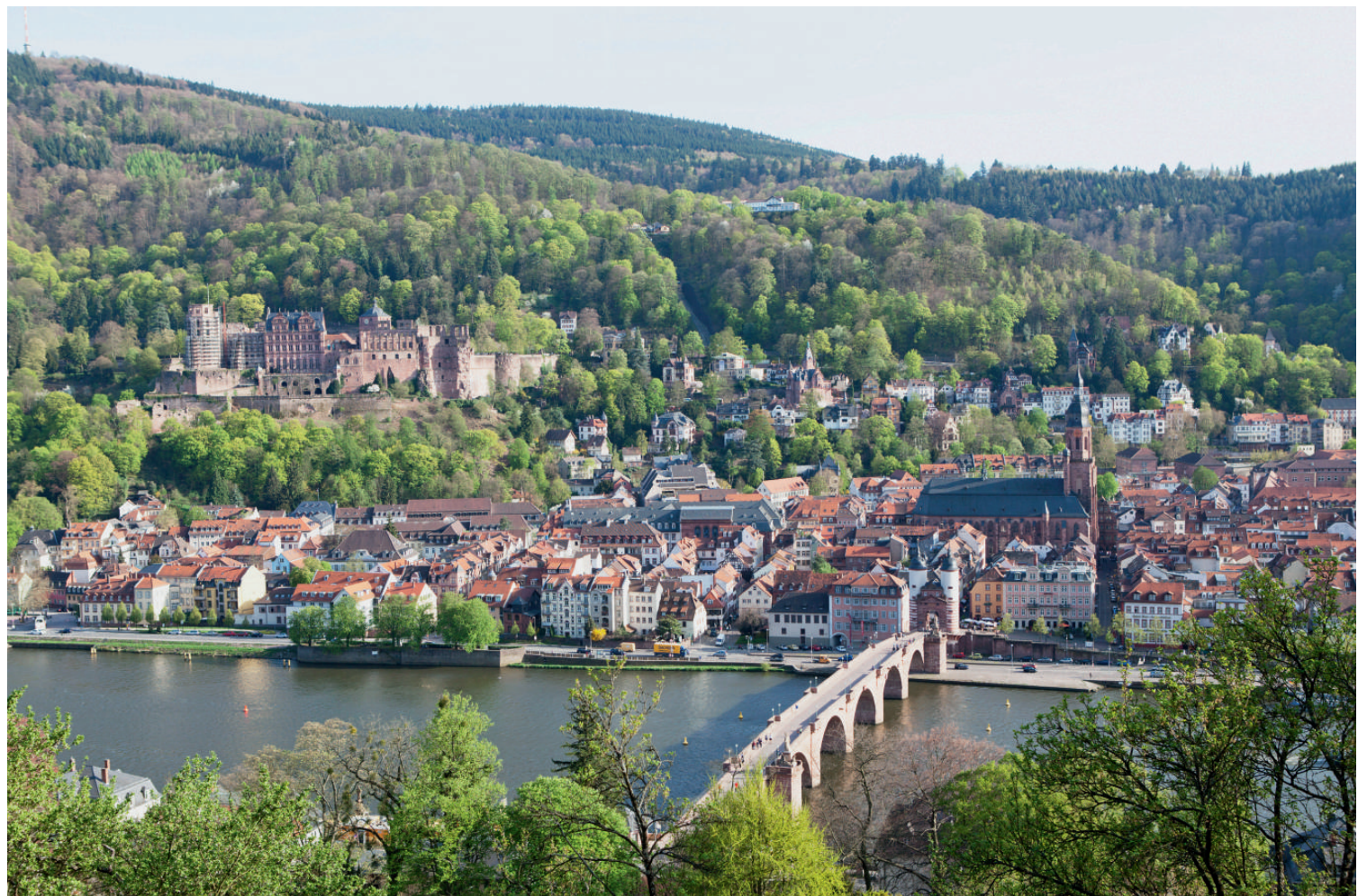
2 Ansicht von Heidelberg mit Schloss, Heiliggeistkirche und Universität

Die zweite Skulpturenreihe präsentiert jene vier Wittelsbacher, die im Mittelalter zum König- oder Kaisertum aufstiegen und damit die Königsfähigkeit ihrer Dynastie demonstrierten. So erinnerte man sich Kaiser Ludwigs IV. („des Bayern“), der 1314 zum römischen König gewählt wurde und 1328 in Rom die Kaiserkrone erlangte. Ihm folgt in der Skulpturenreihe Ruprecht, als Pfalzgraf der dritte seines Namens (1398–1410), als König seit 1400 der erste. Dieser „König aus Heidelberg“ prägte seine Residenzstadt Heidelberg durch ehrgeizige Baupläne von monarchischem Format (Abb. 4). Die Folge der vier Könige am Friedrichsbau wird komplettiert durch zwei Wittelsbacher, die im 14. und 15. Jahrhundert zu Königen in Ungarn und in den skandinavischen Königreichen aufstiegen. Herzog Otto III. von Niederbayern (1290–1312) herrschte als Béla V. (1305/07–1312) im Königreich Ungarn, konnte sich dort aber nicht gegen das Haus Anjou behaupten. Im 15. Jahrhundert erlangte ein Pfalzgraf von Pfalz-Neumarkt die Unionskönigreiche in Dänemark, Schweden und Norwegen. Dieser Christoph III.