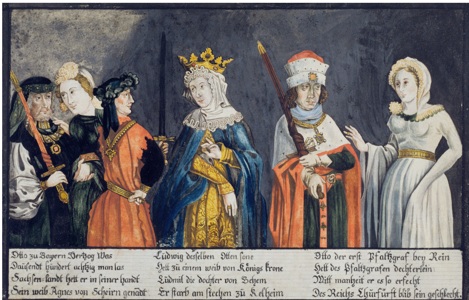
5 Bildprogramm aus dem Heidelberger und dem Amberger Schloss. Frühneuzeitliche Miniaturkopien der Amberger Reihe. Von links nach rechts sind abgebildet: Herzog Otto I. und seine Gemahlin Agnes, Herzog Ludwig von Bayern und seine Gemahlin Ludmilla sowie Otto II. und seine Gemahlin Agnes, 1772/73 | Bayerisches Nationalmuseum München, NN 3605

Ihre Wirkkraft über die Jahrhunderte erwiesen die Verabredungen des Hausvertrags von Pavia. 1329 hatten Kaiser Ludwig IV. („der Bayer“) und seine pfälzischen Neffen die Teilung der wittelsbachischen Herrschaft in der Pfalzgrafschaft und in Bayern sowie das gegenseitige Erbrecht beim Erlöschen eines Zweigs verabredet. Diese Idee vom gemeinsamen fürstlichen Haus, über die Jahrhunderte erneuert, wurde 450 Jahre später politische Wirklichkeit. Beim Aussterben der bayerischen Linien 1777 zog Kurfürst Carl IV. Philipp Theodor aus der Linie Pfalz-Sulzbach mit seinem Mannheimer Hof nach München und trat hier die Nachfolge an. Als auch er 1799 ohne männliche Nachkommen verstarb, folgte ihm Pfalzgraf Maximilian IV. Joseph aus der Linie Pfalz-Zweibrücken. Als Maximilian I. begründete dieser beim Untergang des Heiligen Römischen Reichs 1806 das wittelsbachische Königshaus, das bis 1918 Bayern regierte. Deshalb sind alle heutigen Wittelsbacher in di-