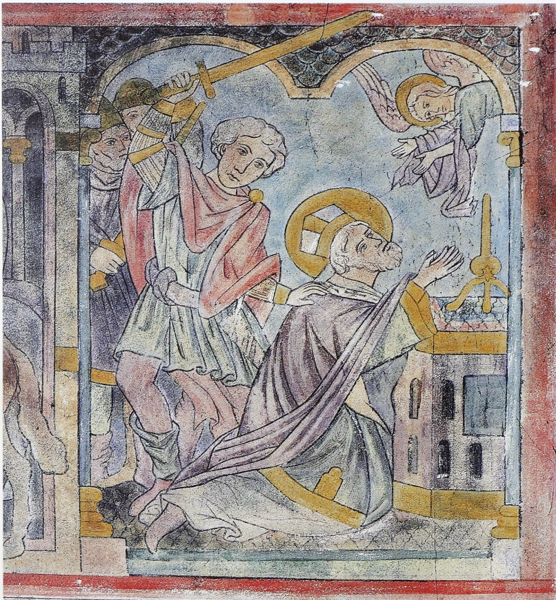
Abb. 6 Geschichte des hl. Thomas Beckett, Wandmalereien im dem Kollegiatstift St. Blasii, dem heutigen Braunschweiger Dom

Am Ende seines Lebens sorgte Heinrich der Lange fürs Jenseits vor. 1226 veranlasste er die Erweiterung des Patroziniums der Stiftskirche (St. Blasius und Johannes der Täufer) um den hl. Thomas Becket. Seiner Vita ist eine Szenenfolge der Wandmalerei an der südlichen Chorwand gewidmet (Abb. 6). Der alternde Pfalzgraf suchte in der Krise welfischer Herrschaft Schutz bei den Heiligen. Sein Grab fand der am 28. April 1227 verstorbene älteste Sohn des Löwen wie selbstverständlich in der Braunschweiger Stiftskirche St. Blasii, ganz in der Nähe seiner Eltern und seines kaiserlichen Bruders. 26