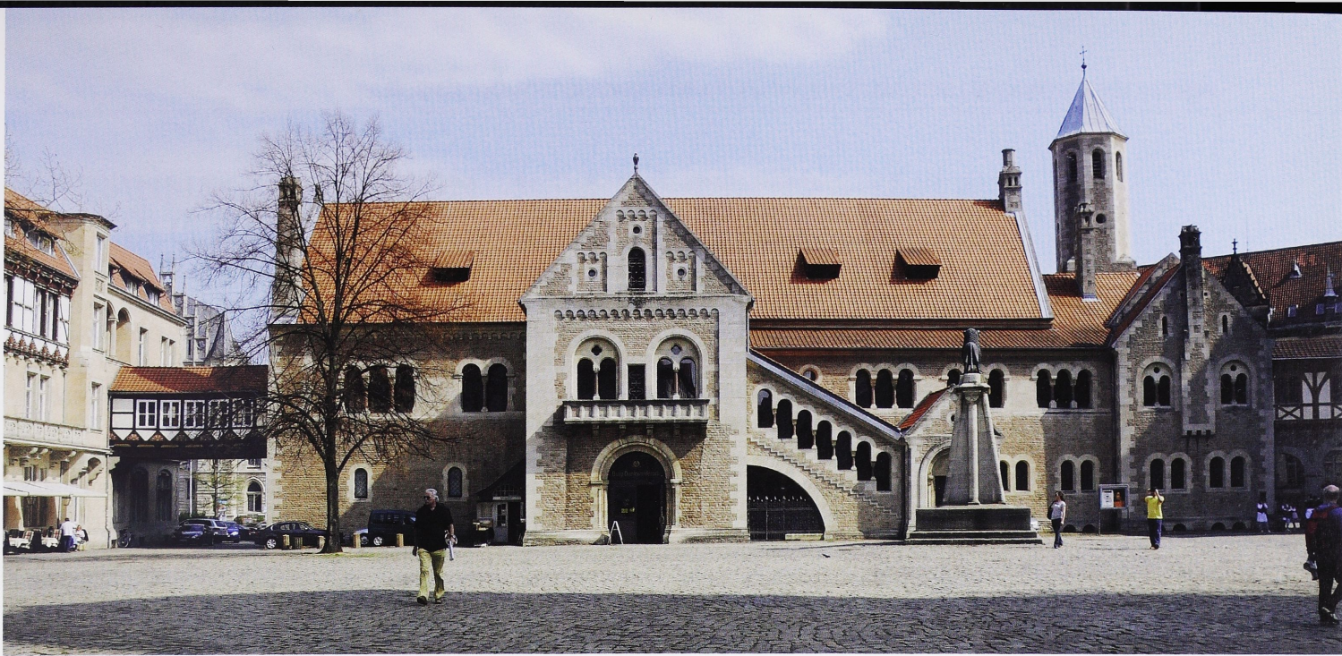
Abb. 2 Der Braunschweiger Burgplatz mit dem Löwenstandbild und der Burg Dankwarderode

Heinrich der Lange erhielt mit den Gütern und Ansprüchen westlich einer Linie, die von der Elbe über Dalle, Hannover, Northeim, Göttingen bis Hanstein reichte, die schwierigste Aufgabe. Im Westen des ehemaligen Herzogtums Sachsen mussten die Zugriffsrechte der Welfen nämlich aktualisiert oder durchgesetzt werden. Wilhelm erlangte den östlichen und nördlichen Teil vom Ostharz bis zur Elbe. Mit dem Land um Lüchow, Dannenberg, Hitzacker, Dahlenburg und Lüneburg fiel ihm das Erbe der früheren billungischen Herzöge von Sachsen zu. Im Benediktinerkloster St. Michael zu Lüneburg wurde Wilhelm später bestattet.