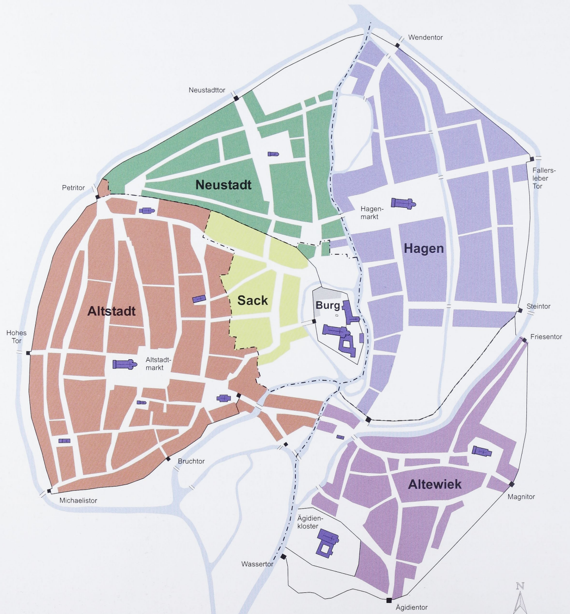
Abb. 1 Karte der braunschweiger Weichbilde im 13. Jahrhundert

1202 heiratete der jüngere Bruder Ottos IV. und Heinrichs, Wilhelm (1184–1212/13), Helene (um 1180–1233), die Schwester König Knuts von Dänemark. Aus dieser Ehe ging später Otto das Kind hervor, der einzige überlebende Welfe in direkter männlicher Linie und Stammvater aller Welfen bis auf den heutigen Tag. Im gleichen Jahr, im Mai 1202 in Paderborn, verabredeten Heinrich der Lange, König Otto IV. und Wilhelm die Aufteilung welfischer Rechte und Güter in Sachsen. Dabei fiel der Herrschaftsmittelpunkt Braunschweig an Otto IV. 8