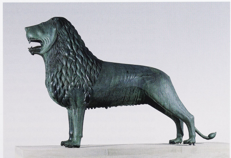
Abb. 3 Braunschweiger Löwe, 1160er Jahre, Höhe 178 cm, Original heute im Knappensaal der Burg Dankwarderode

Seit dem Januar 1199 lässt sich Otto wiederholt in Braunschweig nachweisen. Damals urkundete er