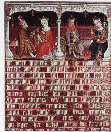
Abb. 5 Gedächtnistafel mit Heinrich dem Löwen, Otto IV. und ihren beiden Gemahlinnen, frühes 15. Jahrhundert, Kat. 167