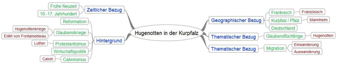
Abb. 5: Beispiel für eine Mindmap (Erstellt mit FreeMind)

Mit der auf Grundlage der Begriffsmatrix erstellten Mindmap werden die Begriffe visualisiert und erweitert. Synonyme, verwandte Begriffe und Begriffe in anderen Sprachen können ausgespart werden.