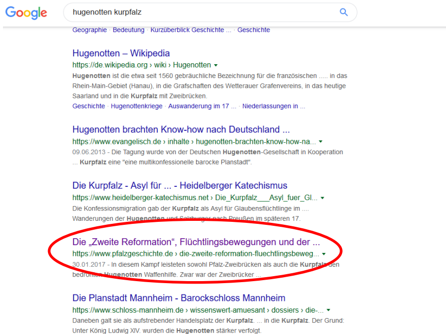
Abb. 1: Screenshot Google-Suche

Abgesehen von den Wikipedia-Artikeln sind die übrigen Treffer bei einer thematischen Google-Suche i.d.R. Zufallstreffer. In unserem Fall ist der auf der ersten Seite aufgelistete Aufsatz „Die „Zweite Reformation“, Flüchtlingsbewegungen und der steinige Weg durch das katastrophale 17. Jahrhundert“ von Christian Decker, der über die Seiten des Instituts für pfälzische Geschichte und Volkskunde veröffentlicht wurde, sehr geeignet.