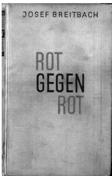
Abb. 1: Einband der Erstausgabe

Arbeitszeugnis bescheinigt, daß er die französische Sprache in Wort und Schrift perfekt beherrsche. 1926 korrespondierte er erstmals mit André Gide, und in den folgenden Jahren knüpfte er immer vielfältigere Beziehungen zu deutschen und französischen Autoren. Eine besonders enge Freundschaft verband ihn mit Jean Schlumberger, den er als seinen geistigen Vater betrachtete. Bereits seit 1929 überwiegend in Frankreich lebend, zog Breitbach im November 1931 nach