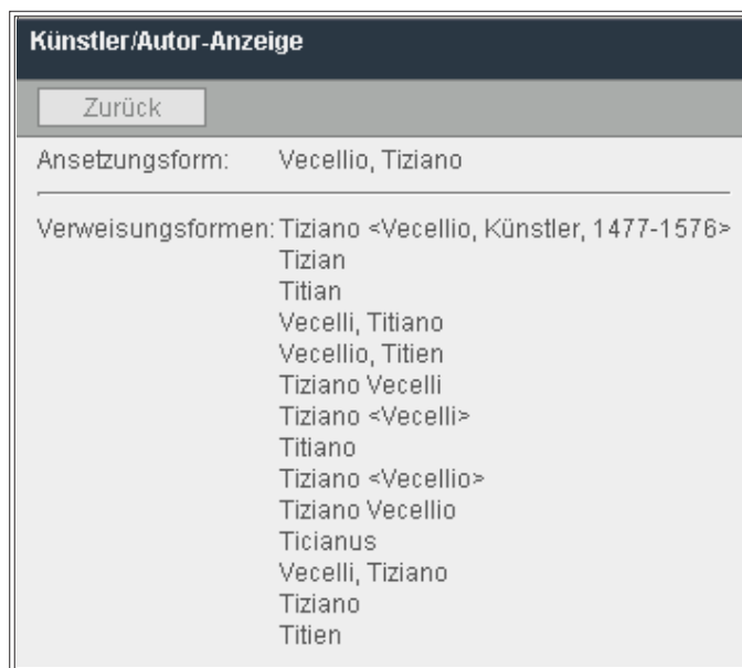
Abb. 4: Beispiel für ein Personenschlagwort der SWD mit Ansetzungs- und Verweisungsformen

Abteilung Sacherschließung gemäß den „Regeln für den Schlagwortkatalog (RSWK)“ nach den auch für die Literaturschließung üblichen Verfahren in der Schlagwortnormdatei neu erfasst, in HeidICON zur Verfügung gestellt und die entsprechenden Bilder mit diesem verknüpft.