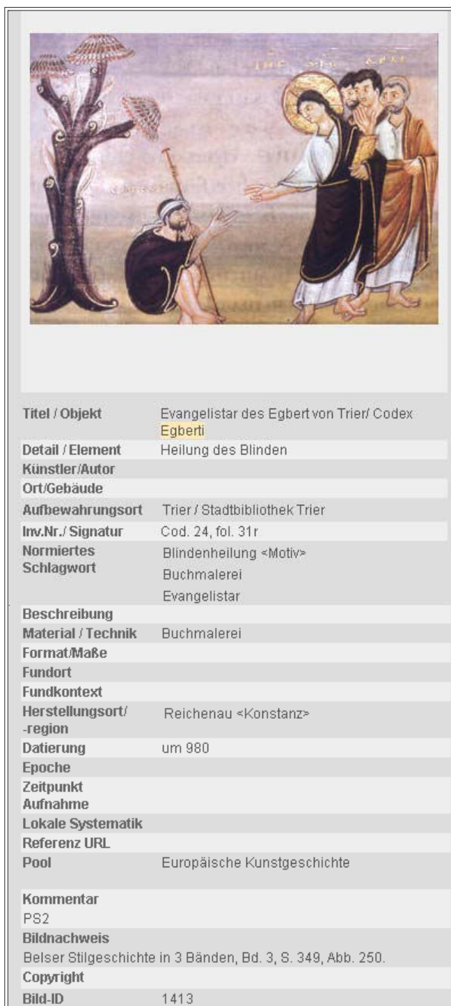
Abb. 3: Beispiel für ein ausgefülltes Datenblatt

Indices vorhandenes Vokabular Verwendung finden sollte. Die sechs „Indexfelder“ („Künstler/Autor“, „Ort/Gebäude“, „Aufbewahrungsort“, „Schlagwort“, „Herstellungsort“ und „Fundort“) sind mit dem Vokabular der Schlagwortnormdatei (SWD) hinterlegt, das deutschlandweit für die Literaturschließung eingesetzt wird. So können verschiedene Schreibweisen eines Namens und Pseudonyme mit einer einzigen Suchanfrage abgedeckt werden. Zudem garantiert der Einsatz