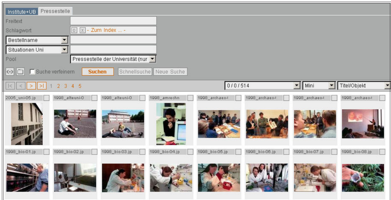
Abb. 6: Suchmaske und Bildmaterial der Pressestelle der Heidelberger Universität