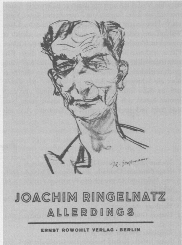
Abb. 67 Allerdings , Einband von Rudolf Großmann, 1928

delt, beim Ringkampf schien er sich im Gemenge mit sich selbst zu verdoppeln, beim Athleten dehnte er sich vor den Augen der Zuschauer zu einem Kraftmenschen , der sich der Venus von Milo nennt, und beim Bettler behauptete er nicht nur: Ich kann so urplötzlich ganz mager werden , das kleine schmale, verbogene Männchen wurde tatsächlich noch viel magerer, ein Häufchen Elend, das nur noch Hose, Barfuß und Hemd trägt. Niemand aber kann ein dümmlicheres Gesicht haben, als Ringelnatz es machte, wenn er das Publikum war, das noch stundenlang wartete auf Bumerang , der nicht mehr zurück kam. Ringelnatz konnte zaubern. [...] Als virtuoser Pantomime führte er auch das Gedicht vor Ein Freund erzählt mir , das sich selbst erst hinterher als rückwärtsgedrehte Zeitlupenaufnahme eines Films erklärt. Nicht minder wirkungsvoll waren pantomimische Zeilen wie die über die Karpfen in Kassel: Sie murmeln Formeln wie die Zauberer, als würde dadurch ihr Wasser sauberer . Ringelnatz schnappte stumm karpfenartig nach Luft, mehrfach, immer karpfenähnlicher. 43 Vor allem seine Mimik machte allem Anschein nach auf die Zuhörer stärksten Eindruck. So beschrieb ihn Bruno Werner 1934 in seinem Nachruf in der Deutschen Allgemeinen Zeitung als einen