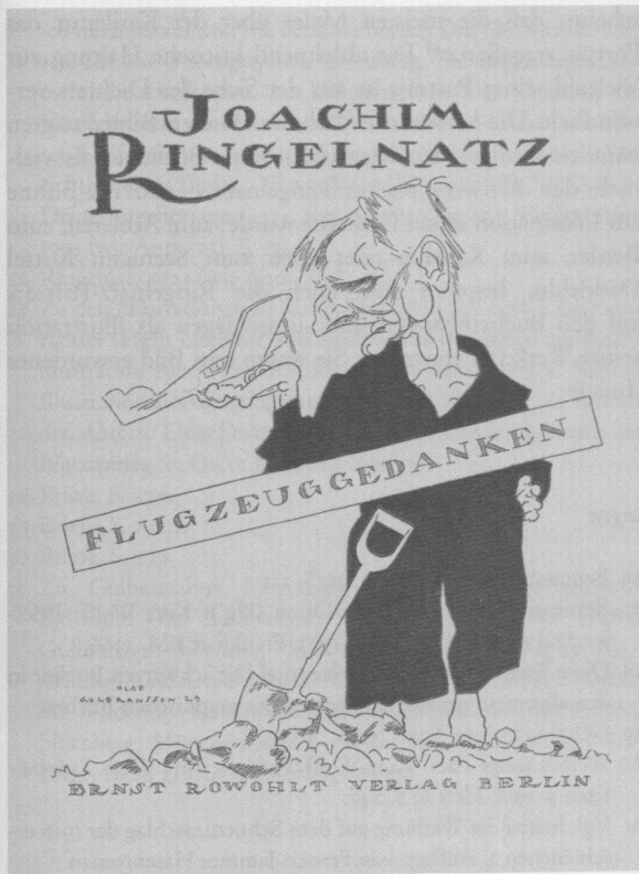
Abb. 66 Flugzeuggedanken , Einband von Olaf Gulbransson, 1929

delt, beim Ringkampf schien er sich im Gemenge mit sich selbst zu verdoppeln, beim Athleten dehnte er sich vor den Augen der Zuschauer zu einem Kraftmenschen , der sich der Venus von Milo nennt, und beim Bettler behauptete er nicht nur: Ich kann so urplötzlich ganz mager werden , das kleine schmale, verbogene Männchen wurde tatsächlich noch viel magerer, ein Häufchen Elend, das nur noch Hose, Barfuß und Hemd trägt. Niemand aber kann ein dümmlicheres Gesicht haben, als Ringelnatz es machte, wenn er das Publikum war, das noch stundenlang wartete auf Bumerang , der nicht mehr zurück kam. Ringelnatz konnte zaubern. [...] Als virtuoser Pantomime führte er auch das Gedicht vor Ein Freund erzählt mir , das sich selbst erst hinterher als rückwärtsgedrehte Zeitlupenaufnahme eines Films erklärt. Nicht minder wirkungsvoll waren pantomimische Zeilen wie die über die Karpfen in Kassel: Sie murmeln Formeln wie die Zauberer, als würde dadurch ihr Wasser sauberer . Ringelnatz schnappte stumm karpfenartig nach Luft, mehrfach, immer karpfenähnlicher. 43 Vor allem seine Mimik machte allem Anschein nach auf die Zuhörer stärksten Eindruck. So beschrieb ihn Bruno Werner 1934 in seinem Nachruf in der Deutschen Allgemeinen Zeitung als einen