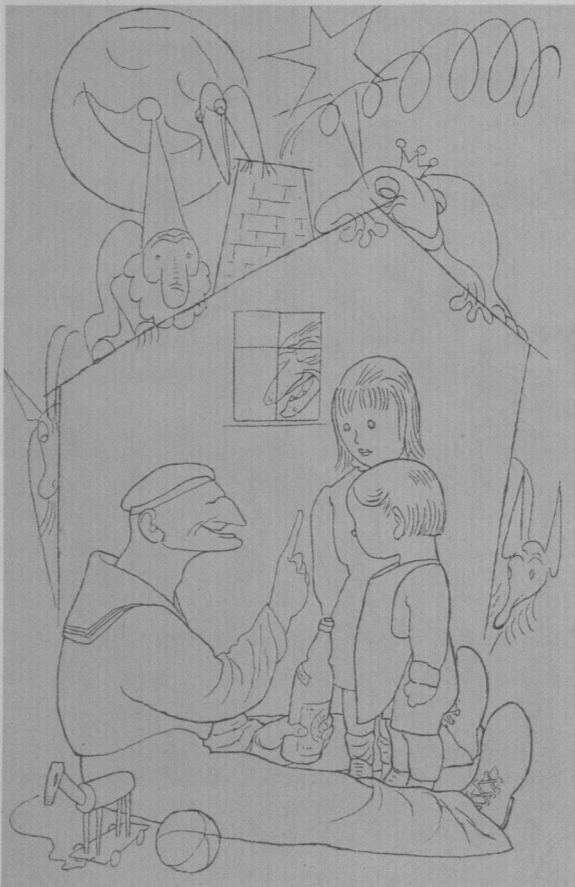
Abb. 65 Kuttel Daddeldu , Illustration von Karl Arnold, 1923

Die Zeichnung macht zugleich die Atmosphäre des Gedichtes wie die Märchenwelt des Seemanns Kuttel Daddeldu lebendig, der sicher nicht zufällig die Gesichtszüge des Dichters Ringelnatz trägt. 27 Auch die Illustrationen zu den Turngedichten sind eine kongeniale Ergänzung der Verse. Etwa das in dösigem Erwartung aus dem Buch starrende