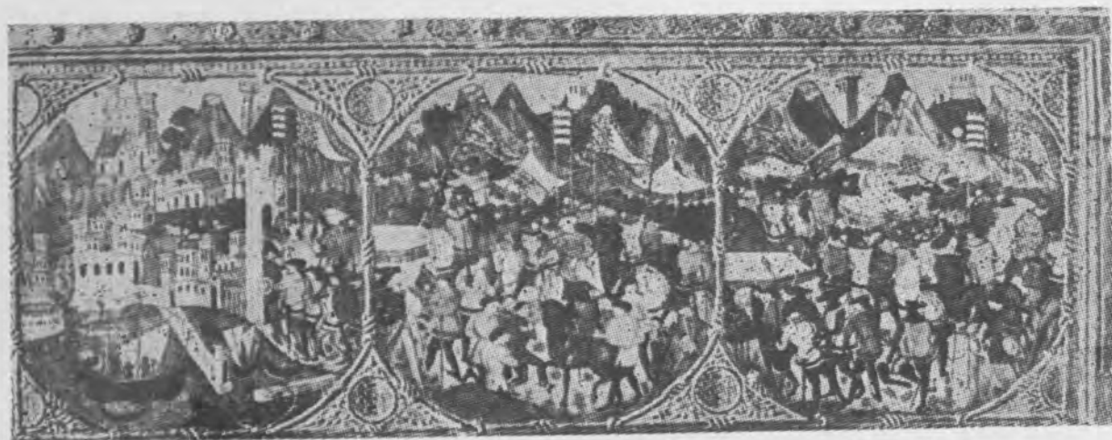
Il. 5 Frontowa ściana cassone, Nowy Jork, Metropolitan Museum of Art, pocz. XV w.

chia Poïphili z 1499 r. 21 We wszystkich przytoczonych wypadkach wieńczenia byka jest jednym z epizodów cyklu ilustracji, w których zawsze pojawia się co najmniej jeszcze jedna scena z bykiem unoszącym na grzbiecie Europę. Można jednak wskazać przykłady występowania jedynie sceny wieńczenia, jak m.in. ilustrację w weneckim wydaniu Ars amatoria Owidiusza z 1509 r. 22 , (il. 11). Wśród bujnych traw łąki leży tam dorodny byk, na przeciwko którego siedzi Europa zakładająca wieniec na jego rogi. Jeszcze jeden wieniec leży u stóp królowej, inne przygotowują towarzyszące jej damy dworu.