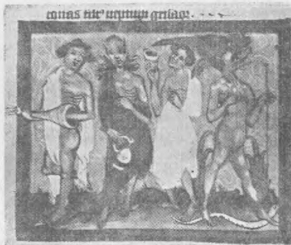
Il. 13 Bogowie pogańscy, miniatura w rękopisie De rerum natura Rabana Maura, 1 poł. XV w., Rzym, Biblioteca Apostolica Vaticana, Palat. Lat. 291, fol. 190

W swym znanym artykule o Apollonio di Giovanni Ernst H. Gombrich pisał, że malowidła casone miały z jednej strony odznaczać się splendorem, tzn. „cieszyć oko”, z drugiej zaś miały być warte pamiętania, a więc ukazywać interesujące tematy 58 . Jest zupełnie prawdopodobne, że obydwa te aspekty brane były pod uwagę także w przypadku naszego dzieła. Cassone krakowskie z wyobrażeniami strojnych niewiast, złotoskrzydłego Merkurego i okazałej budowli emanującej promienie oraz ze złożoną dekoracją ornamentalną u góry i u dołu, dającą malowidłom, by użyć słów Vasari’ego, bellissimo vedere , bez wątplenia charakteryzowało się splendorem 59 . Co zatem miało być warte pamiętania — czyli jakimi treściami przemawiały owe malowidła będące tak dokładną, a przez to unikatową w sztuce nie tylko XV w., ilustracją ostatniej części II księgi Metamorfoz , gdzie głównymi bohaterami są Merkury i Europa 60 ?