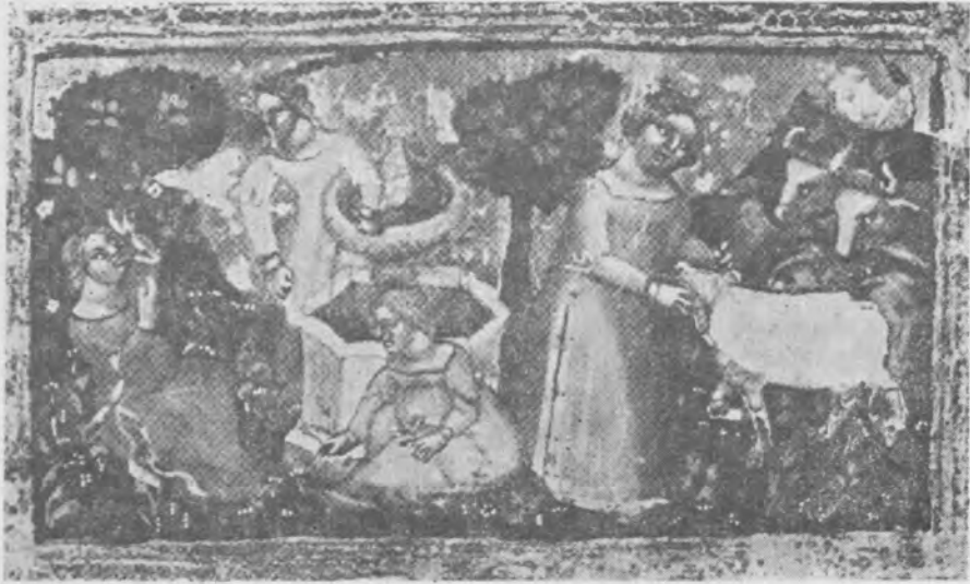
Il. 9. Scena z mitu o Europie, miniatura w rękopisie Ovidius moralizatus Petrusa Berchoriusa , koniec XIV w., Gotha, Forschungsbibliothek , Membr. I. 98, fol. 16 v

Merkuremu Aglauros zostaje zamieniona w kamień, podobnie jak wcześniej Battus. Owidiusz niewiele mówi o Herse — obiekcje pozażądań Merkurego, skupiając swą uwagę, zgodnie z tytułem dzieła, na metamorfozie Aglauros. Kim zatem jest dama, na którą wskazuje skrzydlaty bóg?