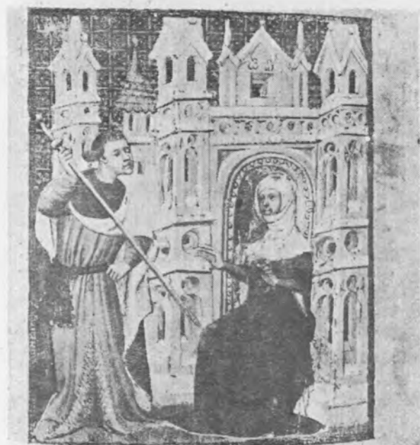
Il. 23 Merkury i Aglauros, miniatura w rękopisie Christine de Pisan Epistre d'Othéa, początek XV w., London, British Library, MS. Harley 4431, fol. 104v (fot. The Warburg Institute), nie publikowana