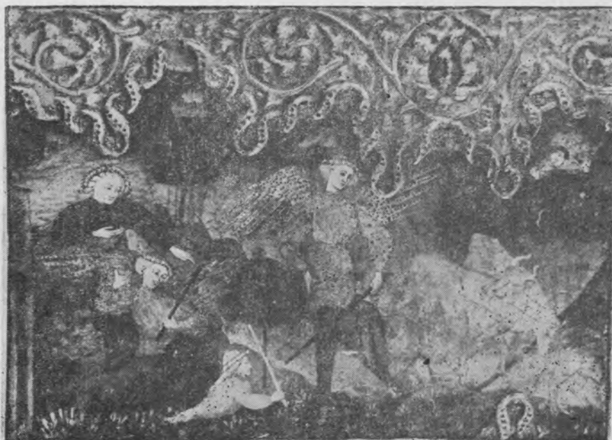
Il. 2. Fragment cassone (obraz prawy, B), Kraków, Muzeum Czartoryskich

długie, zwinięte ku dołowi wici. Tego właśnie środkowego elementu w kształcie mandroli brak jest między naszymi obrazami, gdy ogląda się je zestawione razem. Proponowana tu rekonstrukcja (il. 3) pozwala przypuszczać, że malowidło utraciło około 15 cm środkowej partii, która zawierała zapewne główną część budowli. O tym, jak pod względem dekoracji ornamentalnej mógł wyglądać front krakowskiego cassone poucza najlepiej porównanie z cassone z pałacu Strozich, wykonanym według Schubringa około 1430 r. we Florencji 5 , (il. 4).