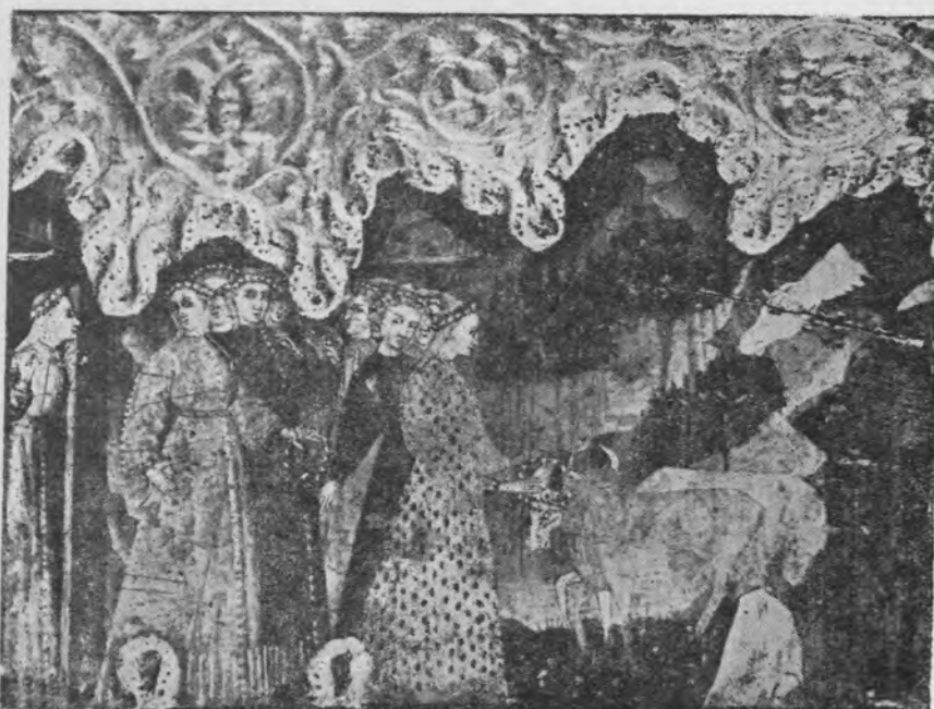
Il. 1 Fragment cassone (obraz lewy, A). Kraków, Muzeum Czartoryskich

liczące trzy sztuki stado bydła z bykiem kroczącym na przedzie (na skutek obcięcia obrazu widocznym tylko w tylnej części). Skrzydlaty „pasterz” i jego trzoda obserwowani są przez mężczyznę z kijem czy może maczugą w lewej ręce, ubranego w czerwony płaszcz z kapturem zarzuconym na głowę, skrytego za kępą drzew, w górnym prawym rogu obrazu. Po lewej występują jeszcze trzy inne postacie — dwóch mężczyzn i kobieta, wszyscy w wieńcach, ukazani jakby jedno nad drugim, wychylający się znad pagórków i skał. Mężczyzna na dole, ujęty profilowo, z długimi złotymi włosami opadającymi na plecy i w czerwonym płaszczu, podąża w prawo trzymając przed sobą złoty kij (lub laskę) 4 . Bez trudu można dostrzec, że drugi mężczyzna jest owym skrzydlatym osobnikiem z centrum obrazu. Przedstawiony frontalnie, z tym samym czarnym, prostym kijem w lewej ręce wskazuje kciukiem prawej, w kierunku niewiasty usytuowanej powyżej na intensywnie czerwonym tle. Kobieta ukazana jest spoza ska-