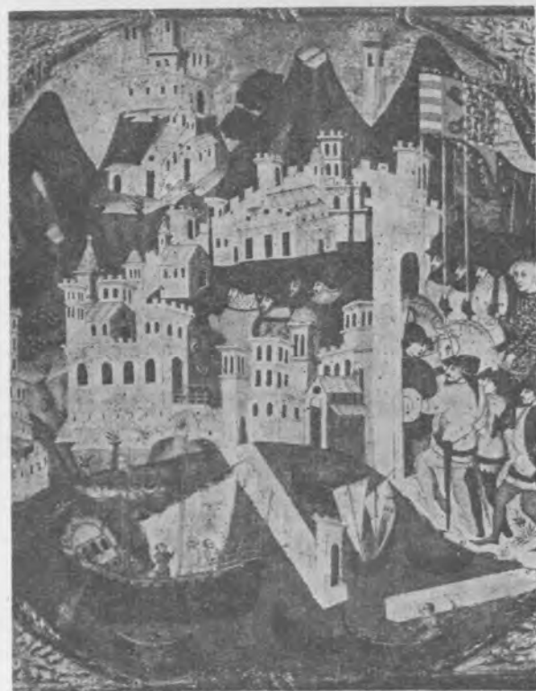
Il. 7 Fragment cassone z Metropolitan Museum of Art