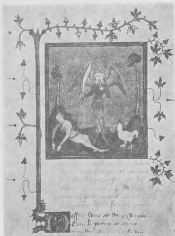
Il. 16 Merkury z Argusem, miniatura w rękopisie Ovide moralisé en vers , koniec XIV w., Rzym, Biblioteca Apostolica Vaticana, Reg. Lat. 1480, fol. 241r, nie publikowana