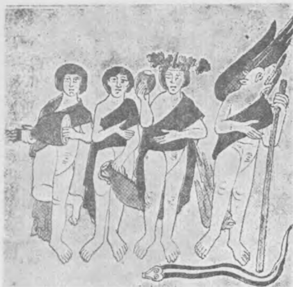
Il. 12 Bogowie pogańscy, miniatura w rękopisie De rerum natura Rabana Maura, 1023 r., Monte Cassino, MS. 132, fol. 386

Nie ma głosu, jej usta w głąz się przemieniły. Siedzi jak martwy posąg, lecz i posąg bład Zachowuje na twarzy dawnych uczuć ślady (II, 829 nn.) 55