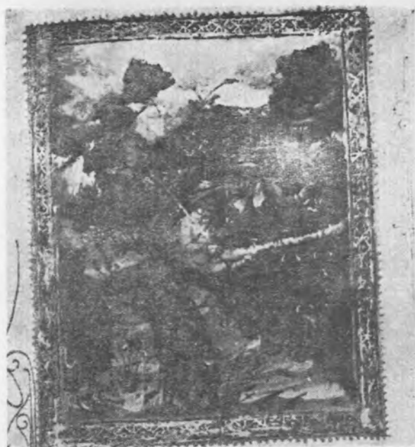
Il. 21 Merkury i Battus, miniatura w rękopisie Ovidius moralizatus, koniec XIV w., Gotha, Forschungsbibliothek, Membr. I, 98, fol. 15r, nie publikowana