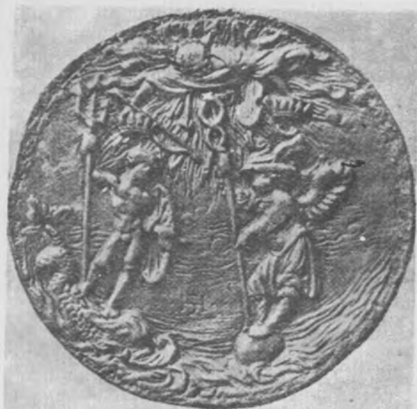
Il. 19 Medal Jacob'a Fugger, XVI w. (fot. wg Brink)