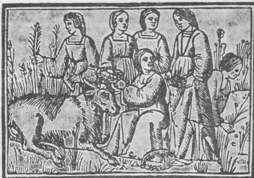
Il. 11 Scena z mitu o Europie, drzeworyt w Ars amatoria Owidiusza. Venetiae 1509 (fot. wg Prince d'Essling II, 1.189)

nie jak Owidiusza, bardziej interesował moment przemiany Aglauros w kamień i ten właśnie epizod został zapewne ukazany na cassone .