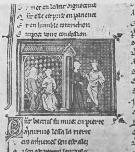
Il. 22 Merkury i Aglauros, miniatura w rękopisie Ovide moralisé en vers, 1 ćw. XIV w., Rouen, Bibl. Municipale, MS. O. 4., fol. 64v, nie publikowana