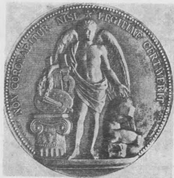
Il. 20 Hermes-Merkury, opiekun sztuk, medal, Barcelona, Real Academia de Bellas Artes de San Fernando, 1948

1974, il. 12, z określeniem: „arte dell'Italia centro-settentrionale”.