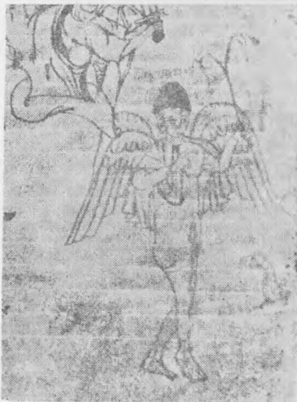
Il. 15 Merkury, fragment miniatury w clm. 14271, fol. 11r

jako messaggero d'amore występował nawet w zwyczajach dworów książęcych i królewskich. Francesco da Barberino w dziele Del reggimento e de'costumi delle donne podaje np., że królowa przesłała girlandę lub wieńiec swojemu małżonkowi nazajutrz po notte d'amore 63 . Innym istotnym elementem omawianej sceny jest ukazana w „sferze nieba” głowa białego byka. Być może autor „programu” krakowskiego cassone nawiązał do passu w tekście Mitografa III: Agenor... qui in Tyro et Sidone regnavit, filiam habuit mirificae formae, nomine Europam, quam Juppiter in specie candidi tauri rapuit. Unde postea in signum honoris taurus translatus est in caelum, et ex eo factum signum quod dicitur Taurus (XV, 2) 64 . Taurus jest zodiakalnym znakiem środka wiosny (19 kwiecień—20 maj), gdy ziemia znajduje się pod wpły-