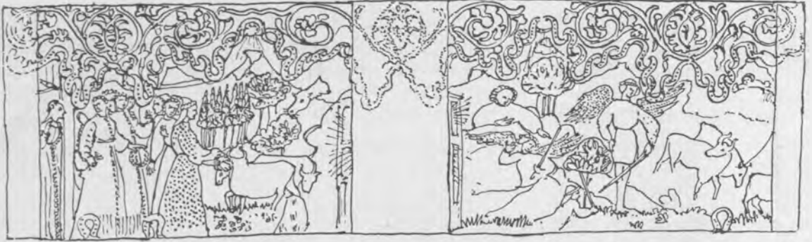
Il. 3 Próba częściowej rekonstrukcji frontowej ściany cassone z Muzeum Czartoryskich, oprac. J. Miziołek, rys. J. Kowalczyk

że krakowskie cassone powstało najprawdopodobniej w tym samym warsztacie, co cassone z Metropolitan Museum of Art. Należy je też datować na początek lub na pierwsze dziesięciolecie XV w. Przemawia za tym również studium ubiorów, jak choćby sukni kobiet; są to bowiem cipriany , charakteryzujące się dużą ilością małych guzików, noszone powszechnie w XIV w. i na początku następnego stulecia 9 . Pod tym względem krakowskie cassone porównać można jeszcze z cassone w Bargello, namalowanym — jak twierdzi Ferdinando Bologna — przez twórcę cassone z Metropolitan Museum of Art, przedstawiającym historię Saladyna i messer Torello (Dekameron X, 9) 10 . Wystarczy tylko rzut oka na jedną ze scen (il. 8) by dostrzec, że żona Torello ubrana jest w niemal identyczną cipriane jak jedna z niewiast na krakowskim malowidle. Podobieństwo dotyczy koloru i wzoru materiału oraz obszycia dołu futrem; dodatkowym elementem wspólnym jest też wieniec na głowie.