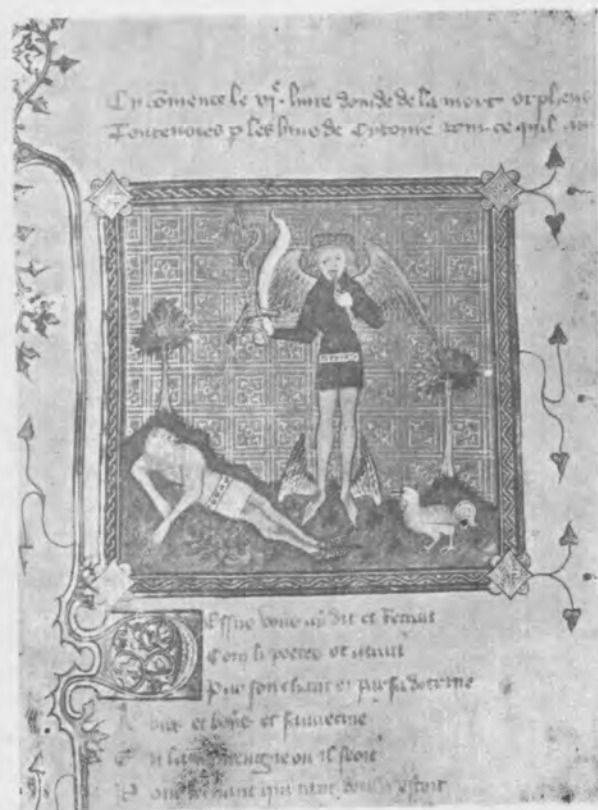
Il. 17 Merkury z Argusem, miniatura w rękopisie Ovide moralisé en vers, koniec XIV w., Genewa, Bibliothèque Publique et Universitaire, MS. fr. 176, fol. 239r, nie publikowana

wem planety Wenus. Trudno, zaiste, byłoby znaleźć bardziej odpowiedni temat na ozdobienie skrzyni, przeznaczonej przecież jako prezent ślubny. Należy w tym miejscu wspomnieć, że w 1407 r., właśnie w czasie, gdy Słońce znajdowało się w znaku Byka, dokładnie 23 kwietnia, miały miejsce zaślubiny Władysława z Durazzo, króla Neapolu, o którym była już wcześniej mowa, z księżną Tarentu późniejszą królową Sycylii, Marią d'Enghien 65 . Czy zatem cassone z Muzeum Czartoryskich, które zdaje się przynależać do dzieł malarstwa południowowłoskiego, nie było czasem jednym z pary cassoni , jakie zwyczajowo powinna otrzymać w prezencie ślubnym księżna Tarentu?