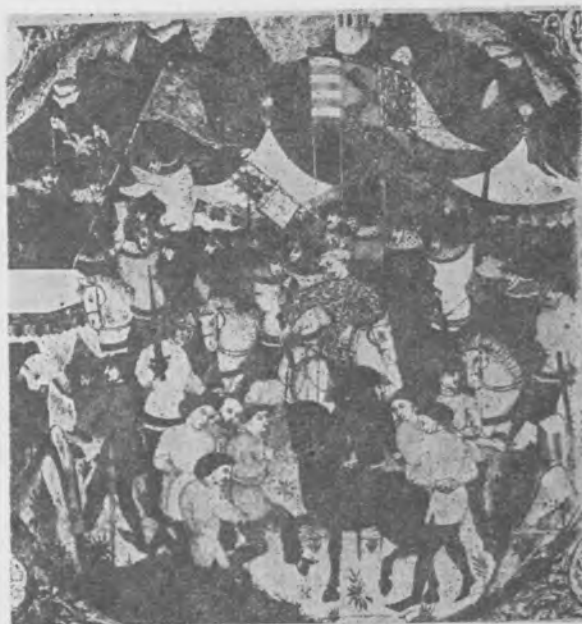
Il. 6 Fragment cassone z Metropolitan Museum of Art

Wspomniana w tekście Berchoriusa encyklopedia Rabana Maura, De rerum natura (znana powszechniej pt. De Universo ) z IX w. opatrzona była ilustracjami. Oryginał nie dotrwał do naszych czasów, posiadamy jednak jego słynną kopię z 1023 r. wykonaną w klasztorze w Monte Cassino 33 . Jedną z ilustracji (fol. 386) (il. 12) ukazuje, wśród czterech antycznych, bogów Merkurego z głową psa, a więc jako Anubisa (Hermanubis) 34 i — co dla nas ważne — z wielkimi skrzydłami (lub