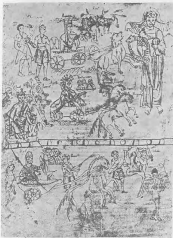
Il. 14 Bogowie pogańscy, fragment miniatury w komentarzu Remigiusza z Auxerre do De nuptiis... Martiana Capelli , około 1100, Monachium, Bayerische Staatsbibliothek, clm. 14271, fol. 11r

Porwanie Europy to temat wielokrotnie występujący na malowidłach cassoni . Łatwo czytelny był bowiem związek między córką Agenora a panną młodą, która „porwana” z grona przyjaciółek zaczynała nowe życie 61 . W naszym przypadku — jak się zdaje — nie o porwanie jednak chodzi sensu stricto lecz o wieńczenie byka-Jupitera, która to scena zdaje się nabierać szczególnego znaczenia. Pochód zwieńczonych i niosących wieńce niewiast, na którego przedzie znajduje się postać, mającej być niebawem porwaną Europą robi wrażenie pochodu weselnego ( pompa nuziale ). W epoce Trecenta i Quattrocenta wzajemne obdarowywanie się wieńcami przez zakochanych było bardzo rozpowszechnione 62 . Wieńce z kwiatów