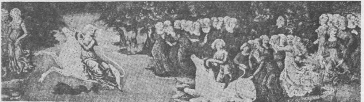
Il. 10 Francesco di Giorgio Martini. Porwanie Europy. Cassone z około 1470 r., Paryż, Louvre (fot. wg Die Verführung der Europa )

wersje mówią dużo więcej o Herse niż właściwy tekst Metamorfoz ; chwalona jest w nich jej uroda i zalety ducha a nadto dowiadujemy się o szczęśliwych zaślubinach z Merkurym 50 . Istnieją także ilustracje do Ovide moralisé en verse w manuskryptach w Rouen i Paryżu, gdzie ukazane są zaślubiny młodej pary 51 . Ikonograficznie i kompozycyjnie niewiele jednak mają one wspólnego ze sceną na krakowskim cassone , a nadto występuje w nich wiele postaci. Ilustratorów kodeksów, podob-