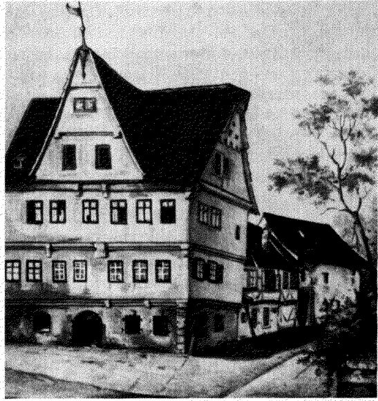
Oben: Das 1857 abgebrochene Rechbergische Haus in der Rinderbachergasse.