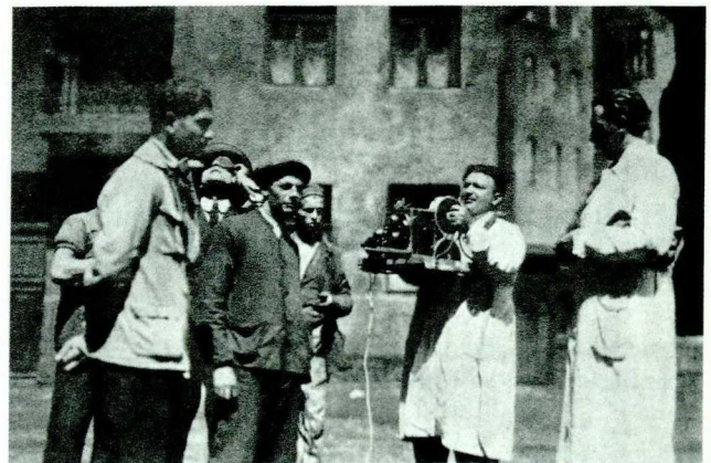
Abb. 10 Dreharbeiten zu »Der letzte Mann« mit Karl Freund an der Handkamera.