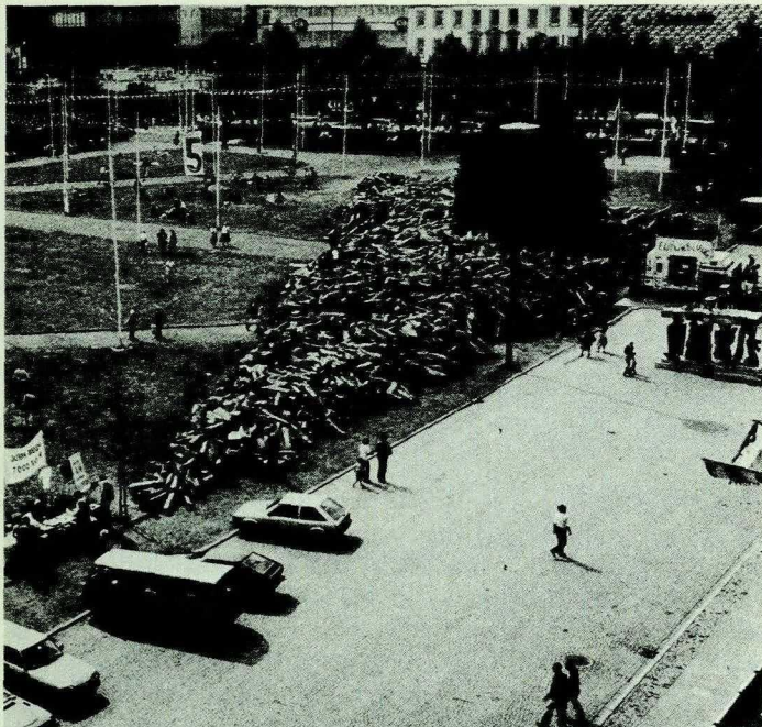
154. Joseph Beuys: Stadtverwaltung . Pflanzsteine auf dem Kasseler Friedrichsplatz. 1982

liefert einen Gegenentwurf sowohl zum traditionellen Kunst- und Kunstwerkbegriff, wie zur gesellschaftlichen Realität; sie ist sinnstiftende Utopie. Zwei Konzepte also, die uns auf die Schwierigkeiten im Umgang mit historischer Kunst hinweisen, bzw. gegenwärtiger Kunst einen neuen Ort, eine neue Funktion im Leben zuweisen wollen. Somit erweist sich, kein Wunder, am Ende unserer Überlegungen die Frage nach der Funktion der Kunst als offen.