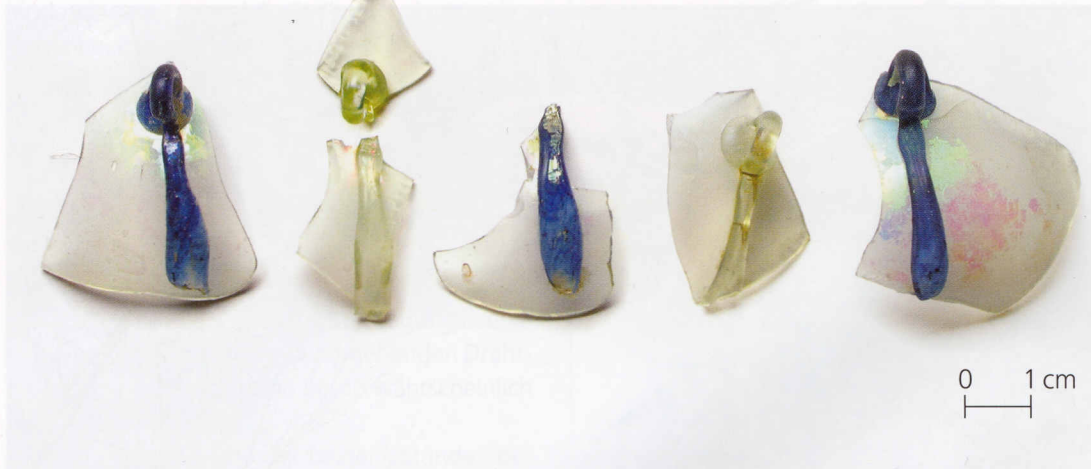
1 Ulm, Vestgasse. Aufhängeösen von Lampen orientalischen Typs.

mat dieses speziellen Lampentyps. In Italien, wo auch das Ulmer Fundstück entstanden sein dürfte, ist deshalb auch von „lampade da moschea“ (Moscheeampeln) die Rede.