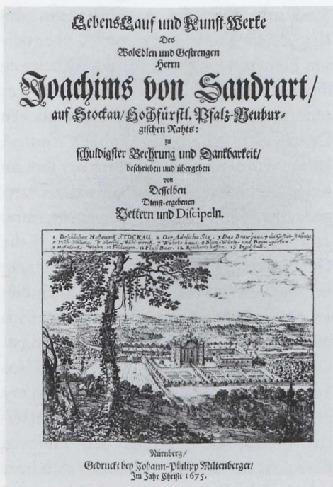
Abb. 4: Lebenslauf und Kunst-Werke // Des // WolEdlen und Gestrengen // Herrn // Joachims von Sandrart // auf Stockau // Hochfürstl. Pfalz-Neuburg= // gischen Rabts., mit der Darstellung von Stockau, Titelblatt, Nürnberg, Germanisches Nationalmuseum

Portraitaufträge anlässlich des Nürnberger Friedensexekutionskongresses. Ab 1649 arbeitete Sandrart, wie viele weitere Künstler von den großen Auftragsmöglichkeiten angezogen, in der Reichstadt: „Als unläng hernach A. 1649, nach dem leidigen dreißig-jährigen Kriegsgewitter / die liebe lang-verlangte goldene Friedens-Sonne das betäubte Teutschland wieder angeblicket / und die Stände des Reichs / samt den hohen Generalen der inn- und ausländischen interessirten Cronen / theils in Person / theils durch ihre fürtreffliche Abgesandten / zur Execution und Vollziehung des Friedensschlusses / sich nach Nürnberg versammellet: hat auch die / mit vollen Ruhmstrahlen das Reich durchleuchtende Kunst-Sonne / unser Herr von Sandrart / von hoher Hand dahin beruffen 50 / daselbst sich einfinden müssen. Allhier bekame nun sein unvergleichlicher Kunst-Pinsel volle Arbeit / und Gelegenheit / sich der Welt verwunderbar zu zeigen.“ 51 Die Menge der Gemälde gibt Sandrart selbst mit „allein auf Swedischer Seite wol Achzig“ 52 an! An Sandrarts Seite stand u. a. Daniel