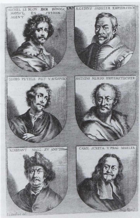
Abb. 5: Philipp Kilian nach Sandrart, Portraits der Künstler Le Blon, Sadeler, Petel, Merian, Rembrandt und Škreta ; Nürnberg, Germanisches Nationalmuseum

Hier in Nürnberg erschien nun in dichter Folge sein schriftstellerisches Werk, für das er schon lange vorher das Material zusammengetragen hatte. Nicht immer berücksichtigt Sandrart darin die Auswirkungen des Krieges auf die individuellen Künstlerbiographien. So bleibt in der „Teutschen Academie“ unerwähnt, daß nach 18 Jahren in Italien Johann Schönfelds Heimkehr im Herbst 1651 nach Deutschland auffallend mit dem Ende des Dreißigjährigen Krieges zusammenfällt. Dafür weiß Sandrart aber von der glücklichen Rückkehr des aus Prag vertriebenen Carolo Scretta zu berichten, der über Bologna und Florenz 1634 nach Rom kam. Er „perfectionirte sich daselbst durch Aemsigkeit und Fleiß dergestalt / daß er sich reich genug schätzte / wieder in sein Vatterland Prag zuruck zu kehren / und daselbst die Früchte seines Füll-Horns aus zuschütten. Als er daselbst von denen Anverwandten und Kunstliebenden bewillkommet worden / fand er die edle Mahl-Kunst in einem tieffen Schlamm äußerster Verachtung stecken / und gleichsam gar aus der Stadt verbanisiret / dannhero bemühte er sich möglichst / dieselbe durch fürtreffliche Kunstwerke wieder zu erheben / und den Schmutz von ihrem Gesichte abzuwaschen / wie er dann sie wieder auf ihre vorige Stelle gesetzt / und in Flor gebracht / sich selbst aber durch seine schöne Qualitäten / Freundlichkeit und löblichen Tugendwandel / bey hohen und niedern Stands-Personen beliebt und geehrt ge-