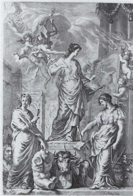
Abb. 2: Carl Gustav Amling nach Sandrart, Frontispiz zur „Teutschen Academie“ mit den Personifikationen von Bildhauerei, Malerei und Architektur ; Nürnberg, Germanisches Nationalmuseum

dienten eine nähere Untersuchung 11 – so die Michael-Herr-Zeichnung „Allegorie auf die Gerechtigkeit, Kunst und Krieg“ 12 von 1630 und vom gleichen Künstler die Handzeichnung „Allegorische Darstellung: Gesetz, Kunst und Krieg als Herrscher der Welt“ 13 oder weitere Zeichnungen von Rudolph Meyer, wie „Die ruhenden Künste und Wissenschaften des Dreißigjährigen Krieges“ 14 von 1632 und „Mercur als Friedensbringer weckt die schlafenden Künste nach dem Krieg“ 15 von 1632 – doch soll, am Beispiel Sandrarts, auf die Kunstliteratur selbst eingegangen werden.