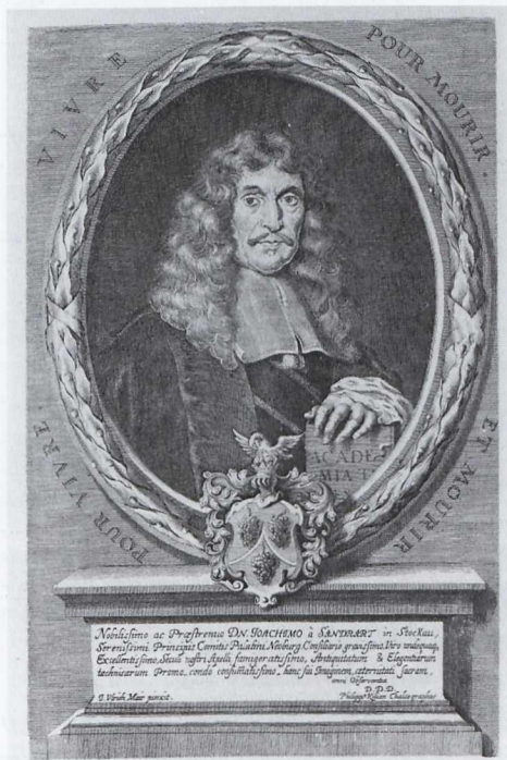
Abb. 1: Philipp Kilian nach Johann Ulrich Mayr, Joachim von Sandrart, in: Teutsche Academie; Nürnberg, Germanisches Nationalmuseum

Daß Joachim von Sandrarts (1606–1688) Einschätzung der Situation der deutschen Künstler im Dreißigjährigen Krieg, sie hätten die Wahl zwischen „Spiß oder Bettelstab“ gehabt, nicht vollständig der Grundlage entbehrte, werden wir zu zeigen haben. Nichtsdestoweniger sind aber bisherige Vorstellungen, der Krieg habe insgesamt die Kunstproduktion des 17. Jahrhunderts zum Erliegen gebracht, zu revidieren. 2 Schon Sandrarts eigener Werdegang, der im Vergleich mit weiteren zeitgenössischen Künstlern eingehender betrachtet werden soll, belegt genau das Gegenteil dieser oft vorgetragenen Auffassung vom Niedergang der Künste: „Das gnädige Schicksel erbarmete sich dieser Finsternis / und ließe der Teutschen Kunst-Welt eine neue Sonne aufgehen: die die schlummernde Freulin Pictura wieder aufweckte / die Nacht zertrieb und ihr den Tag anbrechen machte. Dieser ist / der Wol-Edle und Gestrenge Herr Joachim von Sandrart / auf Stockau / Hoch-Fürstl. Pfalz-Neuburgischer Raht: welchen die Natur mit einem solchen Geist begabet / der nicht anders als leuchten konte / und / durch seine Liecht-volle