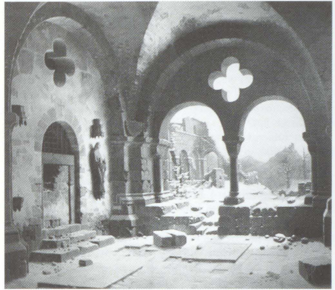
Abb. 5 Carl Georg Adolf Hasenpflug, Klosterhof, datiert 1846. Privatbesitz

Die Architektur des Gemäldes ist perspektivisch aufgefaßt, der Bildaufbau durch den seitlichen Fluchtpunkt diagonal geordnet. Malerische Nuancen sind etwa der bröckelnde Putz am Gewölbe, aber auch die emporrangenden Pflanzen. Die Öffnung des mittleren Abschnittes (dadurch erscheint die Fassade