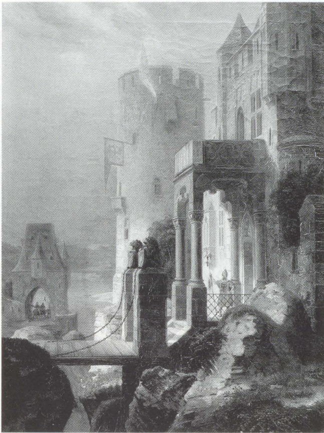
Abb. 2 Adolf Wegelin, Burg auf felsigem Untergrund, mit heruntergelassener Zugbrücke. Ehemals Köln Wallraf-Richartz-Museum (WRM 1653, 1943 verbrannt)

Ferner wird noch ein in Berlin gezeigtes Bild erwähnt: Teil der St. Lambertuskirche in Düsseldorf (1832 auf der Berliner Kunstausstellung zu sehen).