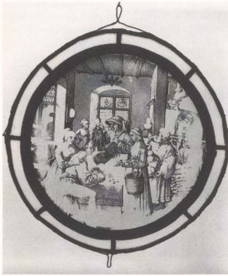
5 Monatsscheibe Oktober mit Darstellung von Rundscheiben in den Oberlichtern der Kreuzstockfenster; nach einem Entwurf von Jörg Breu d. Ä. Augsburg, um 1520. Augsburg, Städtische Kunstsammlungen

die auf Jörg Breu zurückgehen (Abb. 5). Nachdem sein Sohn bis zu seinem Tod im Jahre 1548 die Tradition seines Vaters fortgeführt hatte, wurden in Augsburg schließlich italienisch geschulte Niederländer tätig, die den Kabinettsscheiben ein neues Gepräge gaben 13 .