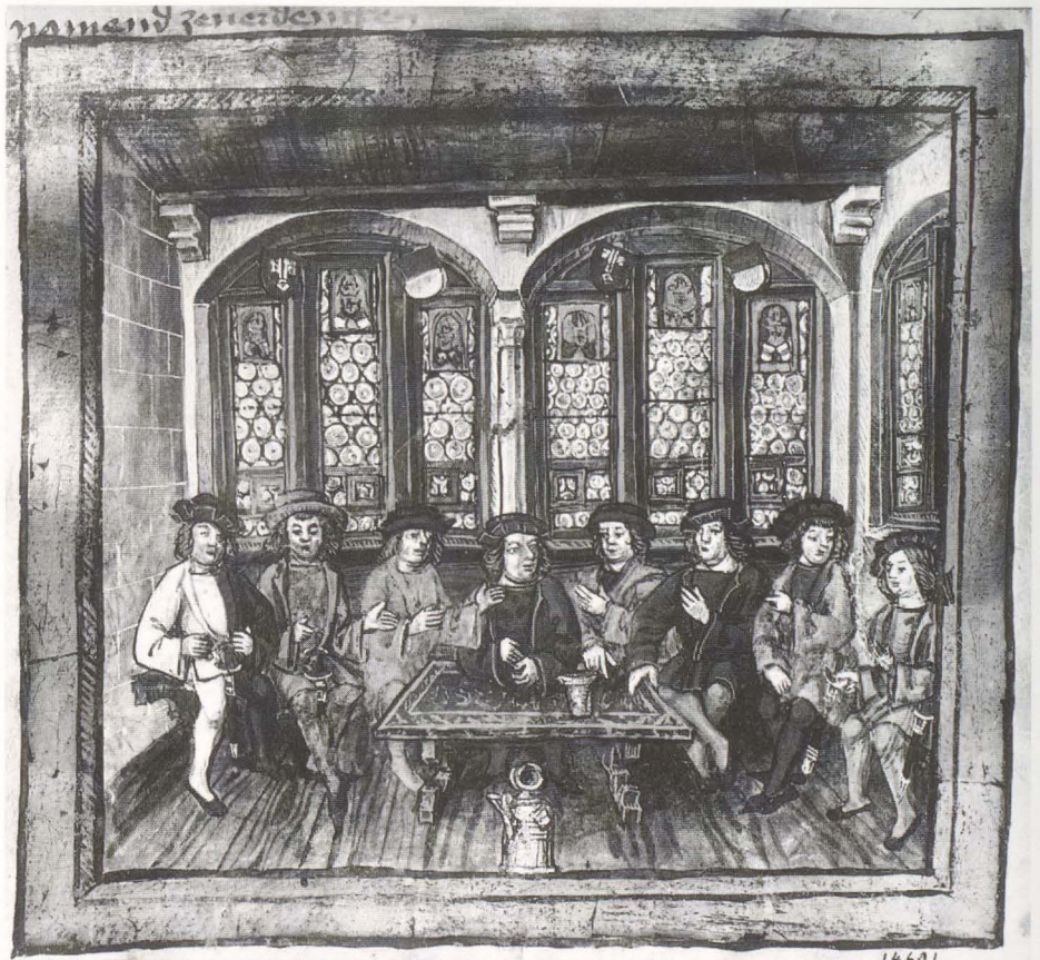
6 Ratsstube von Stans mit gotischen Trippelfenster und darin eingesetzten Standesscheiben von Luzern, Ob- und Nidwalden, Schwyz, Uri, Zug und Zürich. Schweizerische Bilderchronik des Diobold Schilling, Luzern 1513, fol. 124v (Luzern, Korporationsverwaltung)

Die Mitte des 16. Jahrhunderts markiert nicht nur in Nürnberg und Augsburg, sondern auf dem ganzen Kontinent den Niedergang der traditionellen, erst im 19. Jahrhundert wieder zu neuem Leben erweckten monumentalen Glasmalerei. Neben der Reformation und der damit einhergehenden Zerstörung zahlloser Farbfenster muß dafür der gewandelte Geschmack und die Entwicklung der Emailmalerei verantwortlich gemacht werden. Indem die Farbe fortan auf die Glasoberfläche aufgemalt werden konnte, wobei die Trennlinien des Bleinetzes wegfelen, erlangte die Kabinettsscheibe eine bislang selbst mit Mitteln wie dem Ausschliß unerreichte Preziosität und Kleinteiligkeit. Auf Grund dieser Errungenschaften erlebte sie eine zweite Blüte, wengleich die ausgesuchte Virtuosität der Emailmalerei zu einer gewissen Gleichförmigkeit und Erstarrung führte. Die mit religiösen und mythologischen Szenen, mit Jagd-, Kampf- und Festmotiven bereicherte Wappenscheibe erlebte dabei eine erstaunliche Verbreitung, wobei die Hauptproduktion in den Niederlanden, der Schweiz und am Oberrhein lag. Die in der patriotischen Euphorie des 19. Jahrhunderts als Sonderleistung der Schweizer Kunst gefeierte und deshalb mit dem unscharfen Begriff Schweizerscheibe bezeichnete Kabinettsscheibe stellt folglich nur insofern einen Spezialfall dar, als ihre Tradition ungebrochen bis in das 20. Jahrhundert fort dauerte 14 .