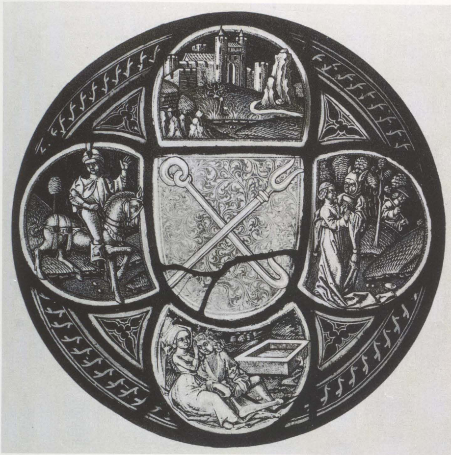
4 Nach nebenstehendem Entwurf ausgeführte Rundscheibe mit Waldstromer-Wappen. Nürnberg, um 1490. Ehem. Berlin, Kunstgewerbemuseum

trockene Pinselzeichnung, die als allgemeines Merkmal nürnbergischer Kabinettglasmalerei gelten kann, wurde gegen 1530 durch eine malerisch »lavierte« Flächenbehandlung in Verbindung mit Schmelzfarben abgelöst. Trotz dieses radikalen technischen Umschwungs kam die Nürnberger Glasmalerei gegen 1550 zum Erliegen; Schweizer Glasmaler belieferten die Reichsstadt fortan mit ihren Erzeugnissen 12 .