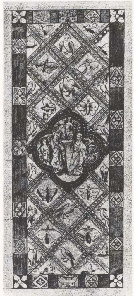
1 Grisaillefenster mit einer Szene aus der Quintinuslegende (Nachzeichnung um 1845/50). Ehemals Stiftsbibliothek von Saint-Quentin. Frankreich, Anfang 14. Jh.

Da im deutschen Sprachraum frühe Kabinett-scheiben weitgehend fehlen, erfolgte der entscheidende Schritt in der Ausbildung dieser Gattung offenbar erst im Laufe des 15. Jahrhunderts 6 . Als Wegbereiter im weltlichen Bereich diente wohl die Wappenscheibe, die mittlerweile auch Einzug in öffentliche Räume wie Zunftstuben und Ratssäle gehalten hatte. Neben den Ende des 14. Jahrhunderts entstandenen Wappenscheiben der Frankfurter Metzgerzunft hat sich in der Mährischen Galerie in Brünn ein Zyklus von acht Wappenscheiben aus dem Rathaus oder dem Versammlungssaal des Landtags im Dominikanerkloster erhalten, der um 1439 entstanden ist und neben Wappenschilden Motive wie wilde Männer, spielende Jünglinge und singende Mädchen enthält 7 . Auftraggeber war wahrscheinlich das Patriziat, das mit dem auf die höfische Buchmalerei aus der Zeit König Wenzels zurückgehenden Motivschatz das Erbe der aristokratischen Kultur angetreten hatte. Die wachsende Beliebtheit und weite Verbreitung der Kabinett-scheibe wurde auch im weiteren Verlauf des 15. Jahrhunderts durch diesen Vorgang entscheidend befördert, wie sich noch zeigen wird.