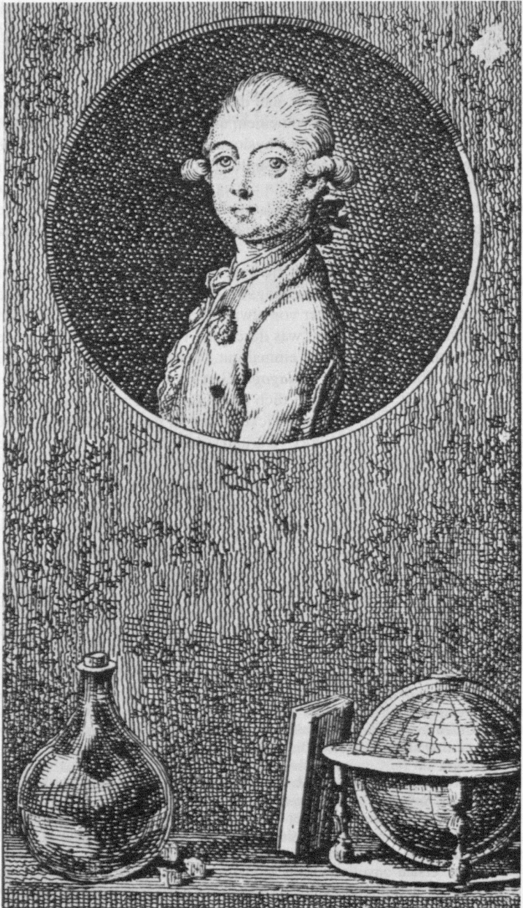
Abb. 6: Chodowiecki, Der Fortgang der Tugend und des Lasters , Blatt 1, 1777, Radierung.