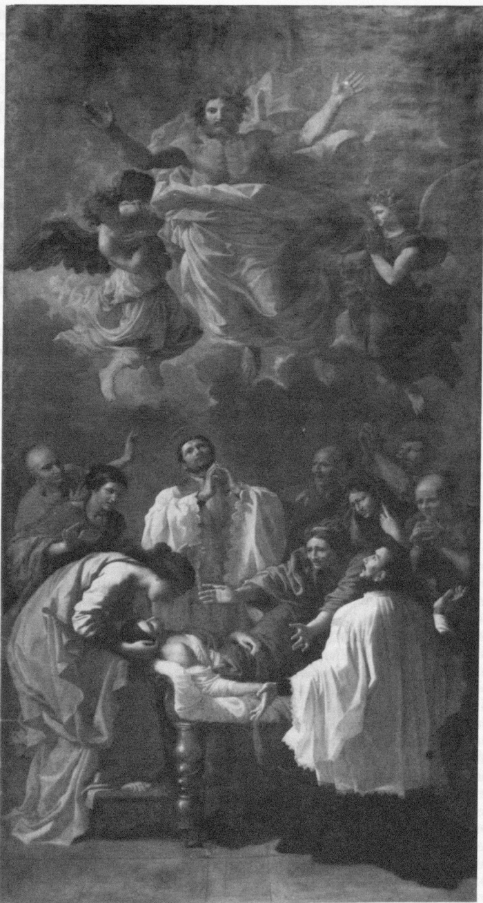
Abb. 4: Nicolas Poussin, Miracle de St. François-Xavier (Paris, Louvre).