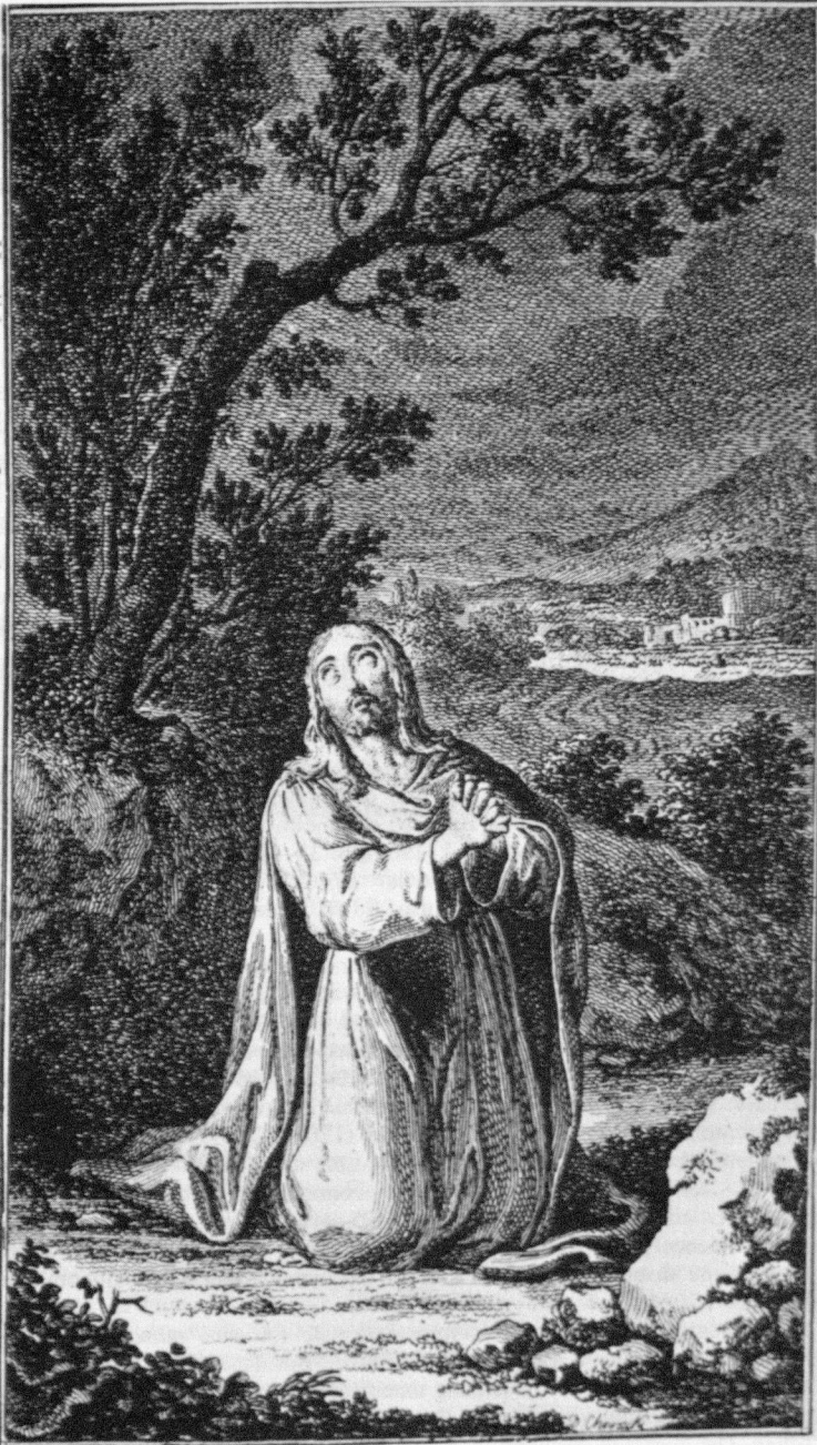
Abb. 5: Chodowiecki, Illustration zu Johann Caspar Lavaters Jesus Messias , 1783/84, Der betende Jesus , Radierung.