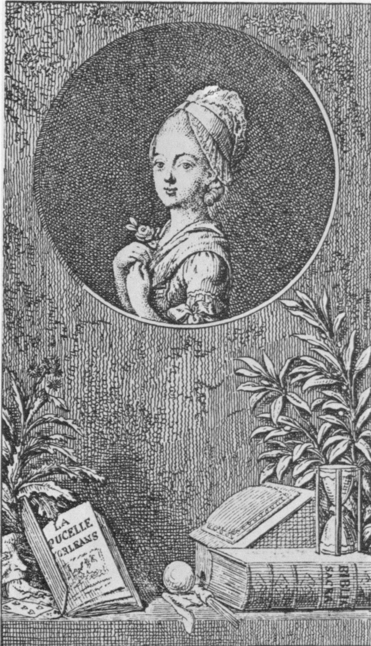
Abb. 7: Chodowiecki, Der Fortgang der Tugend und des Lasters , Blatt 7, 1777, Radierung.