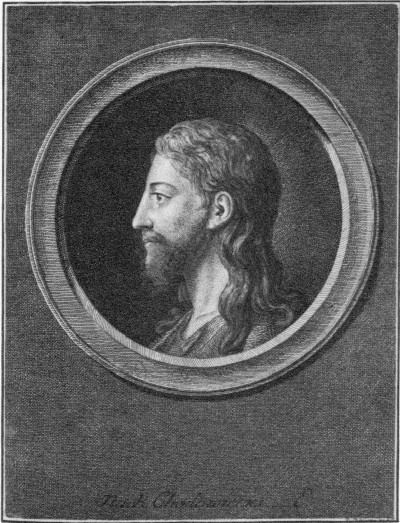
Abb. 3: Chodowiecki, Christuskopf in Lavaters Physiognomischen Fragmenten , Bd. 4, 1778, Radierung.