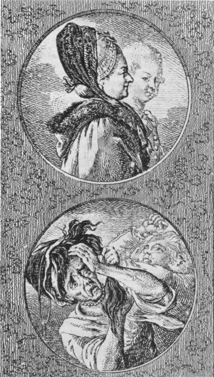
Abb. 9: Chodowiecki, Der Fortgang der Tugend und des Lasters , Blatt 11, 1777, Radierung.