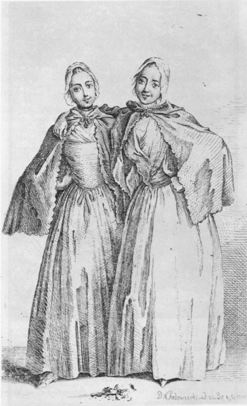
Abb. 1: Chodowiecki, Die beiden stehenden Damen (Demoiselles Quantin) , 1758, Radierung.