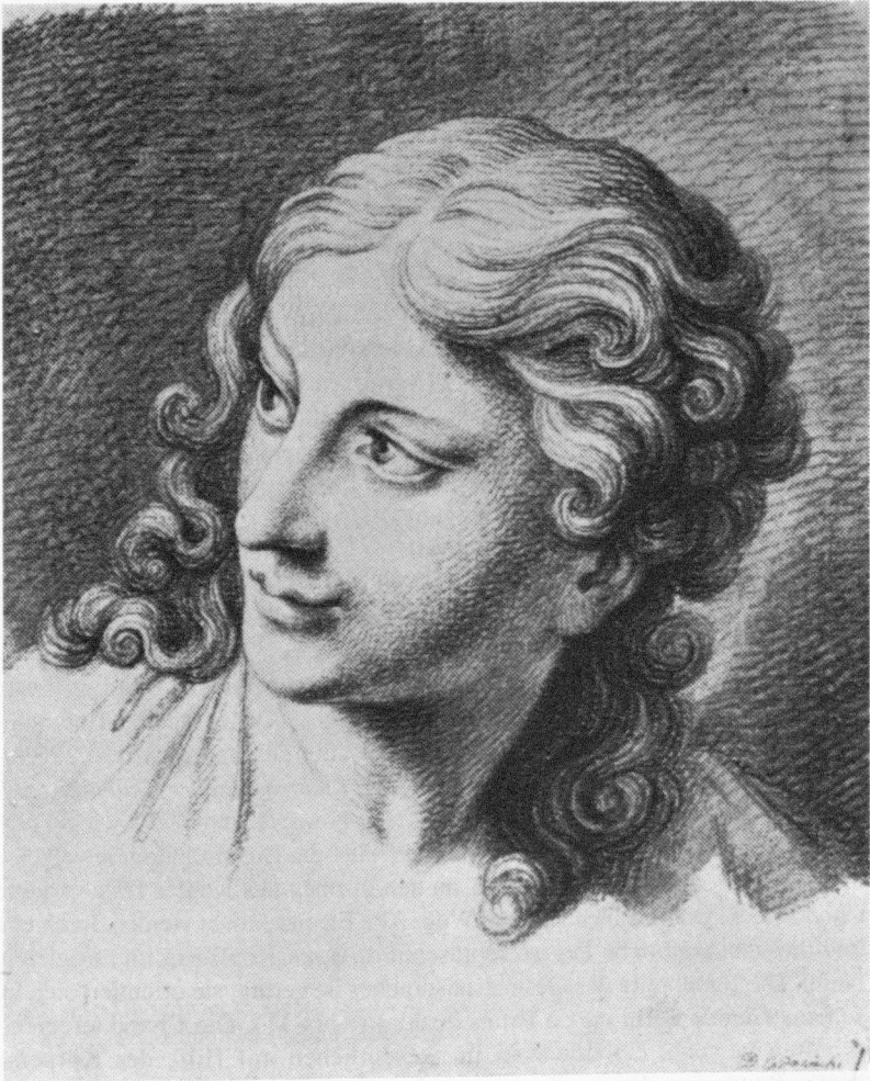
Abb. 10: Chodowiecki, Studienzeichnung , Rötel.