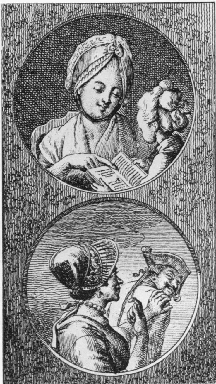
Abb. 8: Chodowiecki, Der Fortgang der Tugend und des Lasters , Blatt 10, 1777, Radierung.