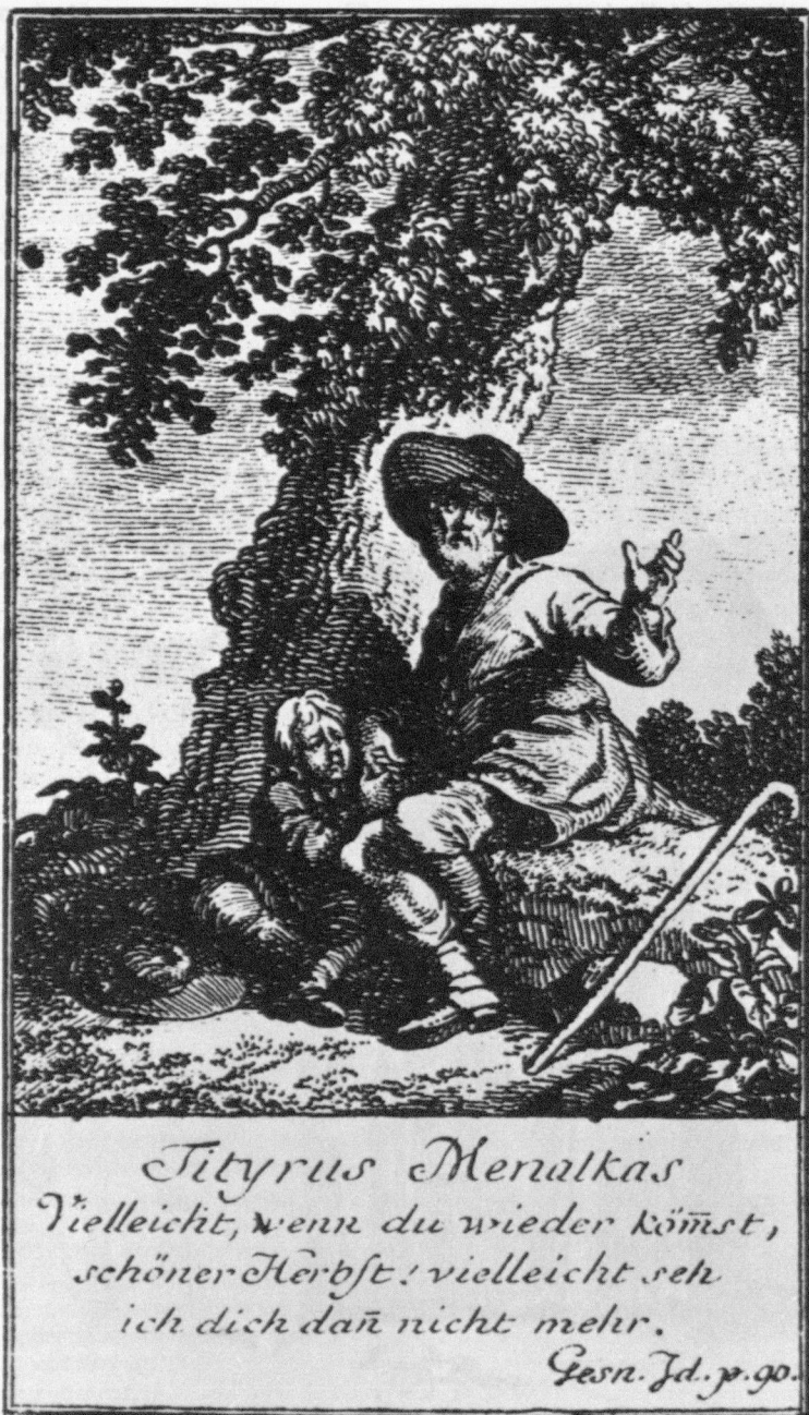
Abb. 2: Chodowiecki, Illustration zu Salomon Gessners Idyllen , 1771, Tityrus Menalkas, Radierung.