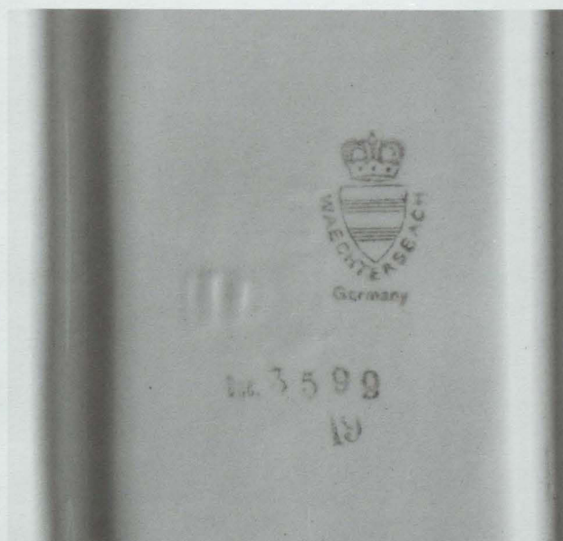
Abb. 3: Pressmarke, sogenannte Kronenmarke, und Dekornummer auf der Unterseite der rechteckigen Platte. GNM, VK 4270/3

von 1920 sind zudem mehrteilige Trink- und Speiseservice angeboten, die dem Bezeichnungssystem der allgemeinen Wächtersbacher Produktion folgend deutsche Städtenamen tragen. Hierin ist auch die Form des ins Germanische Nationalmuseum gelangten Kinderspielgeschirrs fotografisch abgebildet und in der Rubrik „Kinder-Spiel-