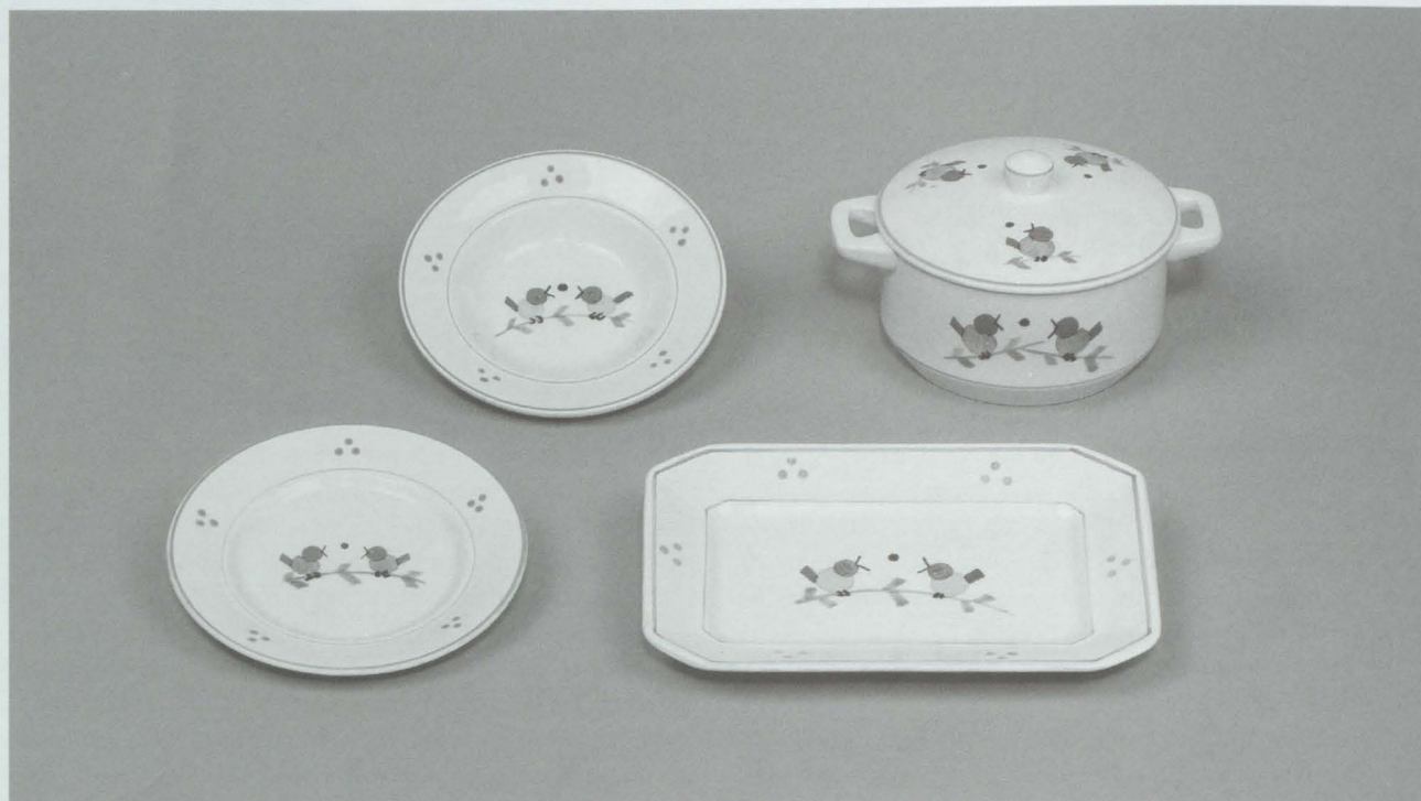
Abb. 2: Teile des Kinderspielservices „Düsseldorf“, Dekor „3599“, Wächtersbacher Steingutfabrik, zwischen 1932 und 1939, Steingut. GNM, VK 4270/1–10