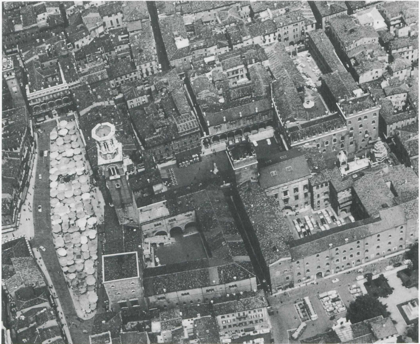
1. Verona, Piazza delle Erbe und Scaligerpaläste, Luftaufnahme von Osten