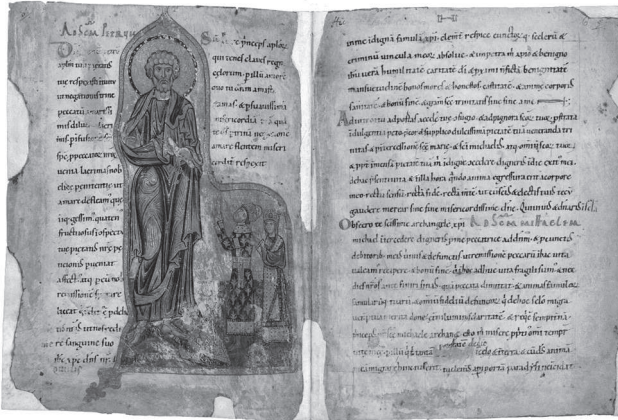
Псалтир Егберта, арк. 5v—6r

доповнень. Причому автор першої, будучи художником візантійського вишколу, імітував західні іконографічні зразки, а другий, навпаки, будучи західного походження, послуговувався візантійськими моделями. Щодо місця виконання, то окрім традиційних версій про Київ і волинські міста, в яких правив Ярополк, Е.С. Смирнова вказує на Туров, який також входив до Ярополкових володінь. Датування відповідно визначається на час правління Ярополка в цих містах, тобто між 1078 (роком смерті його батька Ізяслава) та 1085 (роком вигнання Ярополка і переїзду Гертруди до Києва). Символічне значення композицій Е.С. Смирнова інтерпретує у тісному зв'язку з іншими Гертрудиними доповненнями. Так, перша мініатюра (арк. 5v), на думку дослідниці, є візуалізацією молитов до апостола Петра, написаних обабіч зображення, а мініатюра на арк. 10v, яка зображає коронацію Ярополка, об'єднується в мініцикл з двома іншими, що їй передують (арк. 9v та 10r відповідно). Ці дві мініатюри, репрезентуючи Різдво Христове та Розп'яття, символізують початок і кінець Євангельської історії, а мініатюра з коронацією, оскільки містить образ Христа у Славі, відсилає до теми Старшого суда. Таким чином, виникає цикл, який оповідає про земний шлях Христа, Його жертву та спасіння, що гряде.