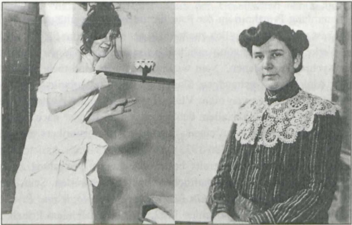
Abbildung 1: ›Vorher – Nachher‹. Anonyme Fotografien aus der Anstalt Weilmünster 1905-1914

Die Bürgersfrau im Zustand der Manie erscheint uns heute ›gesünder‹, glücklicher, freier als in ihrer gehemmten und angepassten Erscheinung beim Verlassen der Anstalt. Tatsächlich waren die Psychiater damals hilfloser als heute. Während dieser Tage die meisten, die eine psychische Krise durchleben, nur kurz stationär behandelt, das heißt mit Hilfe verschiedener Therapien und Medikamente resozialisiert werden, blieben damals die meisten Menschen mit der Diagnose Dementia praecox (vorzeitige Verblödung) – ab 1911 allmählich Schizophrenie – auf Dauer interniert. Sie wurden oft dreißig bis vierzig Jahre lang bis zu ihrem Tod weggeschlossen in Institutionen, wo man außer Bettbehandlung, Beruhigungsmitteln, Zwangsmaßnahmen (Dauerbad, Fixierungen, Tobzelle) und Arbeitstherapie keine Behandlungsmöglichkeiten kannte. Die Folge