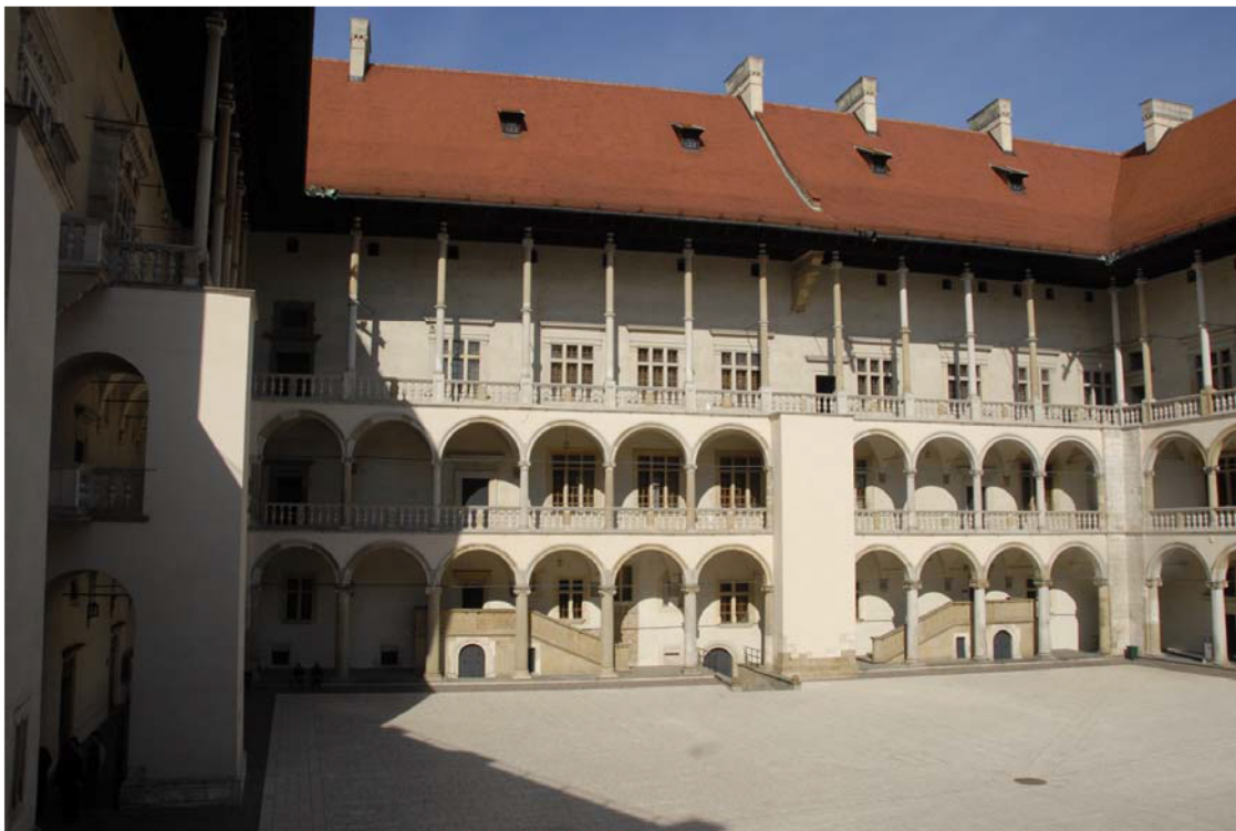
Loggien vor dem Nordflügel

Den unfertigen Bau übernahm 1506 König Sigismund I. und ließ ihn nach neuen Plänen seines Baumeisters Franciscus Italus bis 1516 ausbauen. Bis 1510 war es ein Zweiflügelbau, der auf der Hofseite mit einem Erker in toskanischen Dekorformen aufgelockert wurde. Danach setzte sich der Entwurf mit Loggien durch, was Nachrichten von Säulenvorbereitungen in einem schlesischen Steinbruch bestätigen; sehr wahrscheinlich bewilligte der König zu diesem Zeitpunkt das Konzept eines Kastells mit einem geschlossenen Arkadenhof.