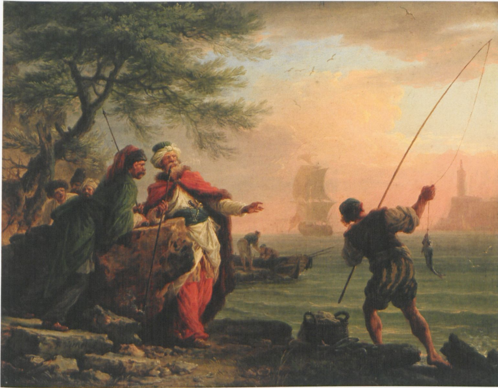
5 Joseph Vernet: Vornehme Türken beim Fischfang zusehend, Staatliche Kunsthalle Karlsruhe

schaften, etwa von Jean Pillement oder Joseph Vernet (Abb. 5), 9 wozu hier auch die Hirtenstücke Bouchers gezählt werden.