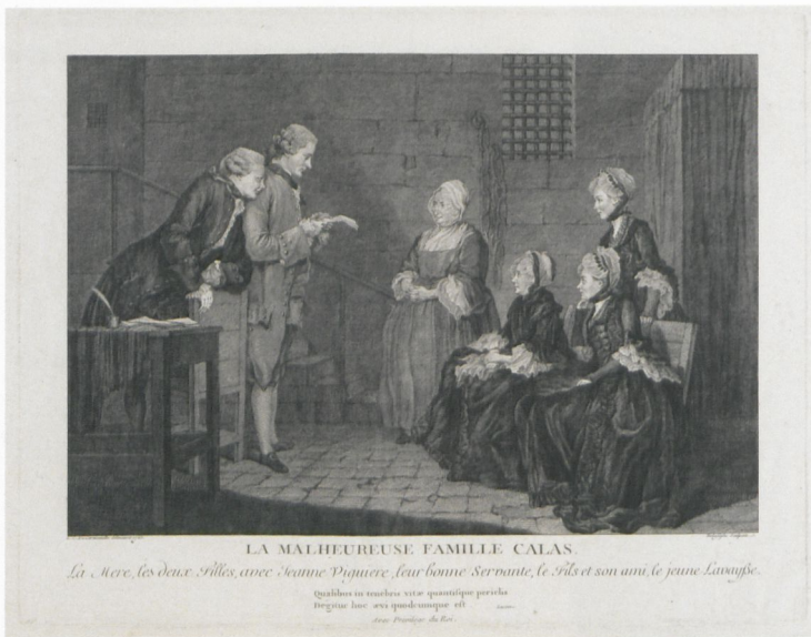
8 Jean-Baptiste Delafosse (nach Louis Carmontelle): La malheureuse famille Calas, 1765, Staatliche Kunsthalle Karlsruhe

die sich nicht mehr über die Akzeptanz eines königlichen Hofes definierte, sondern sich an eine politisch interessierte, zugleich auch kunstinteressierte Öffentlichkeit wandte und die mit den neuen aufklärerischen Zielen einherging, ja sich als ein Sprachrohr dieser Ziele verstand. Und diese Rolle konnte die Kunst im ganz besonderen Maße in der Druckgrafik spielen.