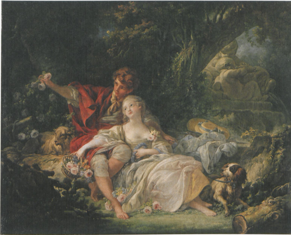
7 François Boucher: Schäfer und Schäferin, 1760, Staatliche Kunsthalle Karlsruhe

die Sammlung eingegangen sind. Bei den beiden hier genannten Beispielen kann jedoch davon ausgegangen werden, dass die Erwerbungen von Karoline Luise getätigt wurden. Das erste Beispiel wurde bereits genannt, es handelt sich um Jean-Baptiste Greuze, heute befinden sich vierzig Blätter nach seinen Werken im Karlsruher grafischen Kabinett. Indes sind die meisten dieser Grafiken erst nach dem Abschluss des Malereikabinetts entstanden, beschreiben somit eine spätere Entwicklung der Sammeltätigkeit. Die Markgräfin besaß Grafiken nach den berühmtesten Kompositionen von Greuze: Der Gelähmte , Die Dorfbraut , Die geliebte Mutter , Die Wohltäterin , Der väterliche Fluch , Der bestrafte Sohn und viele andere. Nun galt Greuze als der Künstler, der im besonderen Maße bürgerliche Werte thematisierte, im Mittelpunkt seiner Werke steht die bürgerliche Familie als Keimzelle der Gesellschaft. Dem widerspricht nicht, dass viele seiner Werke von Angehörigen des hohen Adels erworben wurden, von dem Marquis de Marigny oder sogar von Katharina der Großen. Die grafischen Reproduktionen, deren Beschriftung nicht selten die bürgerlichen Moralvorstellungen expressis verbis benennen, scheinen hingegen stärker für ein bürgerliches Publikum bestimmt gewesen zu sein.