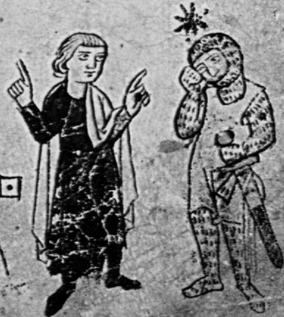
3. Wolfram von Eschenbach, „Willehalm“, München, Bayer. Staatsbibliothek, Cgm 193/III, fol. 1r: Willehalm und Irminschart, Willehalm mit seiner Schwester, Willehalm um Giburg trauernd