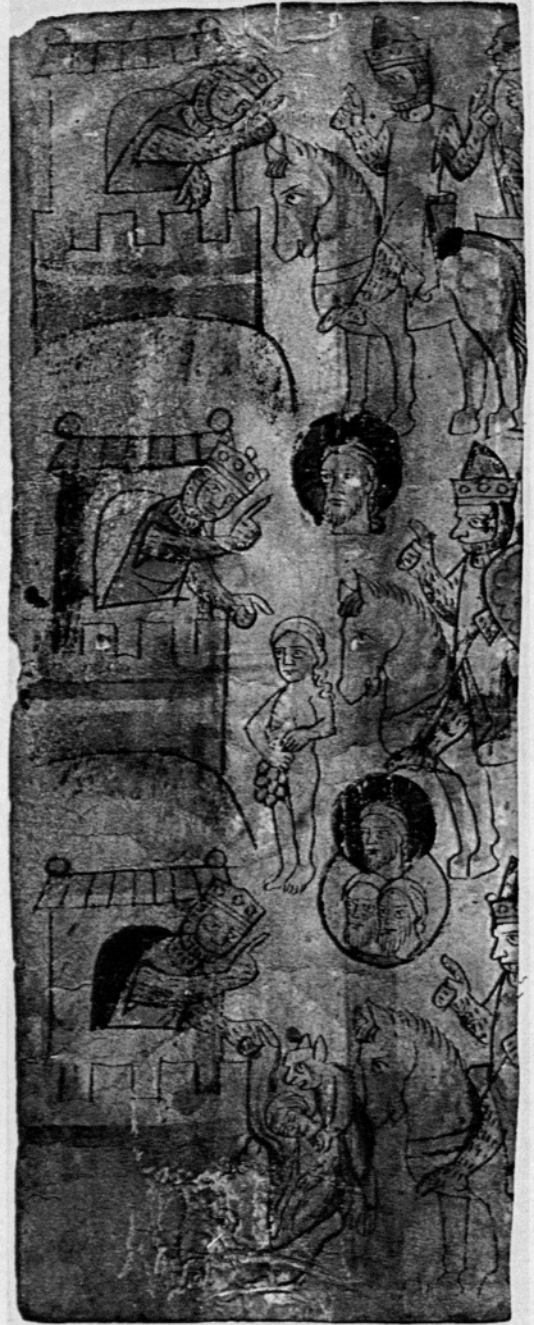
5, 6. Wolfram von Eschenbach, „Willehalm“, Nürnberg, Germanisches Nationalmuseum, Kupferstichkab., Hz 1104 und 1105: Religionsgespräch zwischen Giburg und Teramer