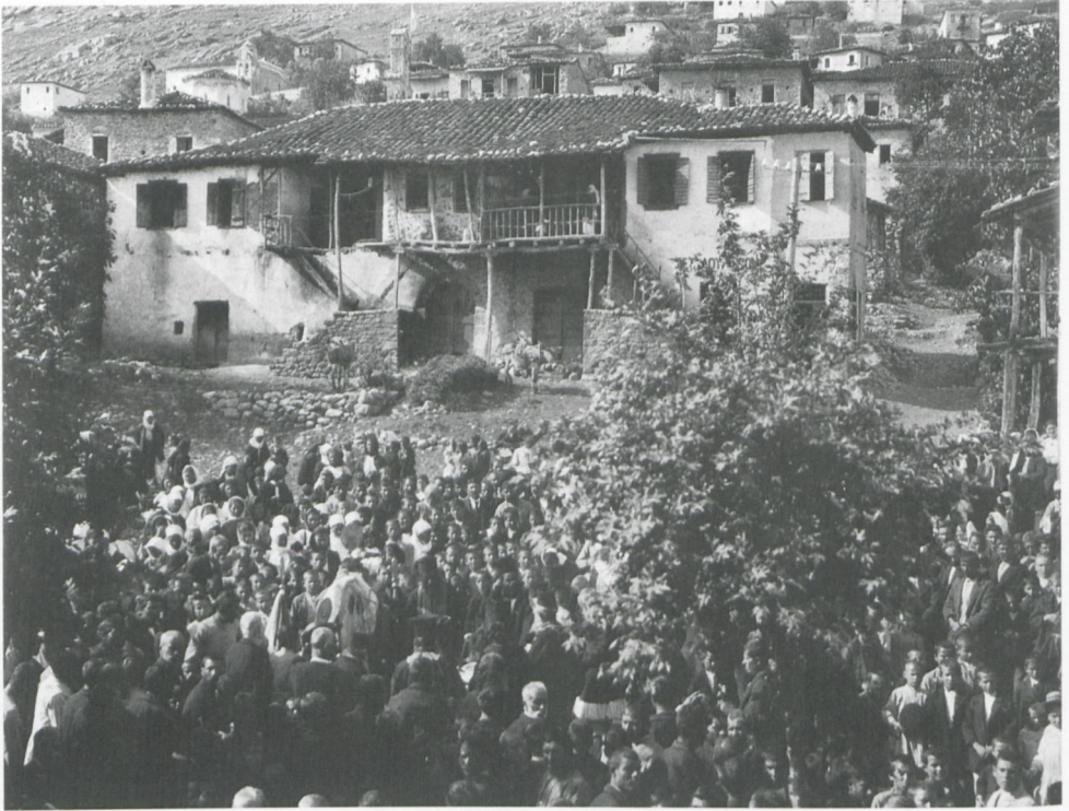
Taf. III.17a: Waldemar Deonna: Regenlitanei, Mai 1905, Dadhi, Griechenland, Fotografie, aus: Chamy, Jacques/Courtois, Chantal/Rebetez, Serge (Hg.): Waldemar Deonna. Un archéologue derrière l'objectif de 1903 à 1939 (Ausst. Kat.), Genf 2000, Abb. 80

spricht dann zuerst die gängigen Verfahren der Ausgrabung und der Einordnung der Funde in Detailanalysen (S. 21–40). Er geht zudem auf die Praxis der Zuschreibung antiker Werke an historische Individuen ein, hält aber eine solche Künstlergeschichte für schwer realisierbar und eigentlich für uninteressant (S. 41–70, hier S. 51). Die nächste Stufe bestünde in Teilsynthesen, etwa zur altgriechischen Kunst, die aber für sich genommen noch immer unbefriedigend seien (S. 71–89).