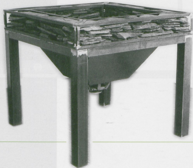
Jens Geelhaar, Die neue Sprachlosigkeit im Kommunikationszeitalter, 1996

Geelhaar is curious enough to always utilise the latest technologies such as the internet and the world-wide transmission of live events by video. His working method is not playful, ironical or contra-inductive, like we can observe with many artists today, but analytical. Thus it seems logical that he does not accept ideological or aesthetic limitations in choosing his material. At the same time he does not repeat his topics nor resume earlier works of his. There is no such thing as a recognisable style, instead Geelhaar works in projects. A recognisable red thread through his work is to be found