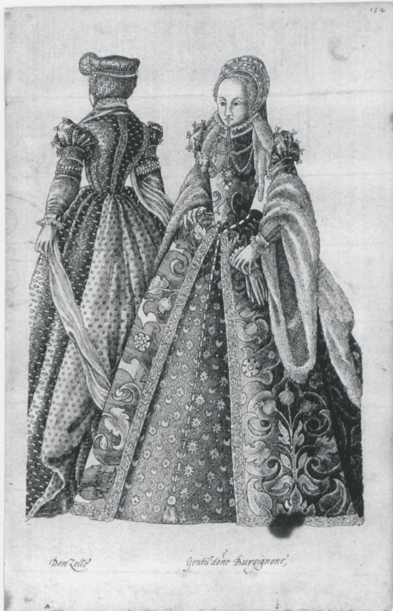
6 Jean Jacques Boissard, „Donzelle“, „Gentil’ don[n]e Burgignone“, in: Weimarer Trachtenbuch, fol. 137, Weimar, Herzogin Anna Amalia Bibliothek

Von den Trachtenbildern stellt die überwiegende Anzahl italienische Kostüme dar. Es finden sich vor allem venezianische Trachten, gefolgt von Kostümen aus Neapel, Rom, Florenz, Bologna, Siena, Pisa, Perugia und anderen italienischen Städten, die zum größeren Teil nur mit einem Bild bedacht sind. Bei den männlichen Figurinen finden sich nach den zahlenmäßig überlegenen italienischen Kostümen neben einigen deutschen, fran-