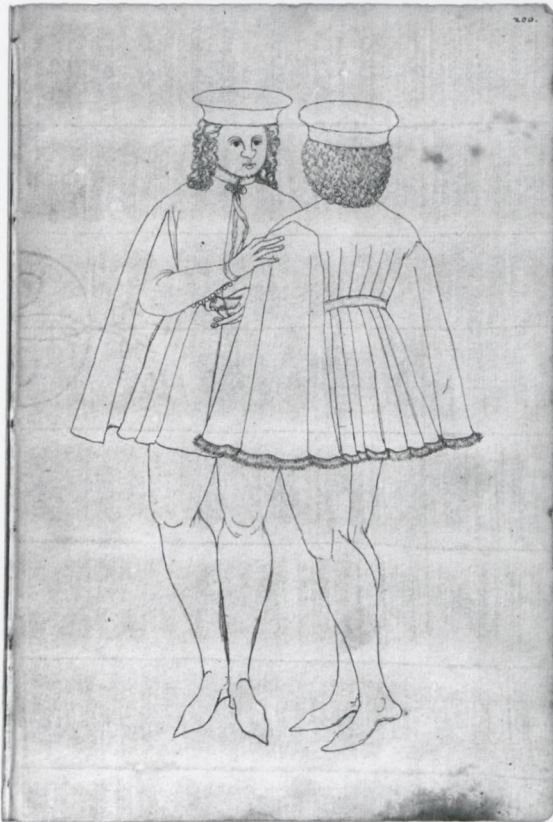
9 Jean Jacques Boissard, Italienischer Jüngling, in: Weimarer Trachtenbuch, fol. 200, Weimar, Herzogin Anna Amalia Bibliothek

nographischen Studien beruhendes Zeichnungsalbum vorzuliegen scheint, dessen Bedeutung für die Geschichte des illustrierten Kostümbuches noch zu präzisieren ist.