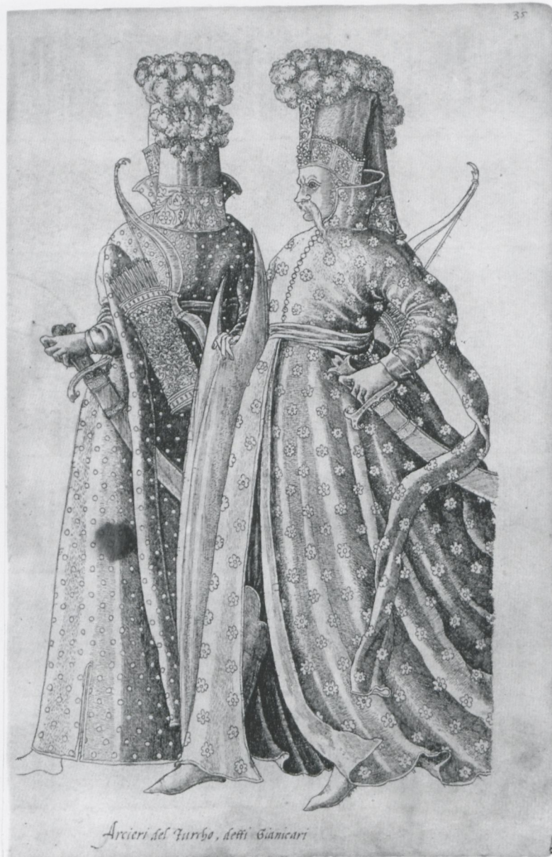
3 Jean Jacques Boissard, „Arcieri del Turcho, detti Gianicari“, in: Weimarer Trachtenbuch, fol. 35, Weimar, Herzogin Anna Amalia Bibliothek

wird, die mit guten Gründen auf die Einrichtung der Sammlung Herzog Albrechts V. bezogen werden kann, hat deutlich werden lassen, daß in München gerade die verstärkte völkerkundliche Ausrichtung über die Repräsentation des fürstlichen Territoriums im Mikrokosmos der Sammlung hinausging. 9 Boissards Trachtenbuch, zu dem sich in der Kunstkammer noch ein weiteres gezeichnetes, auf 1553 datiertes Kostümalbum ge-