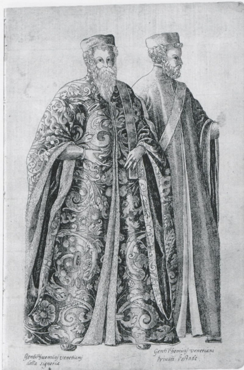
2 Jean Jacques Boissard, „Gentil’huominj uenetianj“, in: Weimarer Trachtenbuch, fol. 3, Weimar, Herzogin Anna Amalia Bibliothek

Goldschmiedearbeiten, aber auch Handschriften mit biblischen und historischen Illustrationen, handgemalte Kostüm-, Wappen-, Jagd- und Turnierbücher sowie gedruckte und handgeschriebene Architektur- und Festungsbücher. 8 Die Kostümdarstellungen dienten wie Genealogien und Wappenbücher, Karten, Städtebilder, Portraits und Tierbilder in Zeichnung, Kupferstich und Holzschnitt als Wissensträger und damit als un-