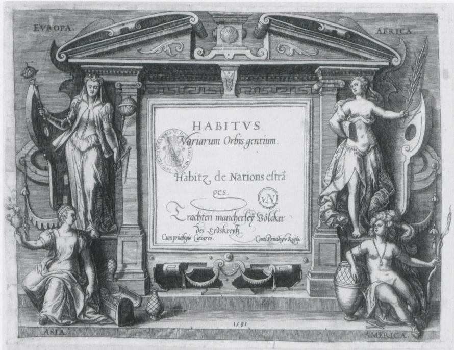
13 Jean Jacques Boissard, Tit elkupfer, in: Habitus variarum orbis gentium , Mecheln 1581

eine weiterführende Spekulation zur Funktion des Bildes in Boissards Manuskripten und Publikationen anknüpfen. Als Humanist und neulateinischer Dichter hat er auf bemerkenswerte Weise von Bildern Gebrauch gemacht und schon im Falle der naturphilosophischen Themen in Ovids ‚Metamorphosen‘ versucht, die erkenntnistheoretische Kluft zwischen Wissen und Poesie durch Bilder zu überbrücken. 40