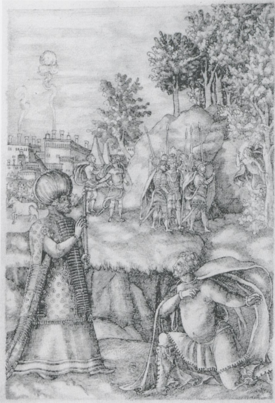
12 Jean Jacques Boissard, Cadmus vor Agenor, in: Ovids Metamorphosen, fol. 21v, Berlin, Kupferstichkabinett

ist wie die Berliner ‚Metamorphosen‘ (Abb. 12). Boissards Personalstil ist durch eine Synthese französischer, deutscher und italienischer Elemente gekennzeichnet, die der Zeichner zu einem eigenen Idiom verschmelzen ließ. Die frühe Prägung durch die französische Hofkunst unter Heinrich II., hier vor allem durch die graphischen Arbeiten von kunsthandwerklich ausgebildeten Künstlern wie Jean Cousin le Père und Jean Duvet, dessen manieristisch gelängte Figuren und motivischer horror vacui sich auch in Boissards Frühwerk beobachten lassen, wird durch die Kenntnis deutscher und italienischer Druckgraphik entschieden modifiziert. 38 Die Auseinandersetzung mit dem Medium des Kupferstichs ist in Boissards Zeichenstil deutlich, der auf eine druckgraphische Wirkung seiner Blätter abzielt. Die Zuschreibung des Weimarer Trachtenbuchs an Boissard wird durch den stilistischen Befund einwandfrei bestätigt, allein aus technischen Gründen müssen die