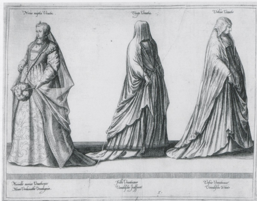
14 Jean Jacques Boissard, Venezianische Frauentrachten, in: Habitus variarum orbis gentium , Mecheln 1581, Taf. 5

Ausnahmefällen Variationen der bereits gedruckten Darstellungen sind. 44 Auch die künstlerische Qualität der Kupferstiche ist durchweg höher als bei den übrigen Kostümbüchern. Bei Boissards gedrucktem Trachtenbuch handelt es sich um eine eigenständige Folge, die sich durch ihre graphische Finesse und ihren kostümgeschichtlichen Detailreichtum auszeichnet. Schon die Vorrede des Verlegers Caspar Rutz betont explizit, daß die Trachtenbilder nach dem Leben – „diuersos populorum habitus ad viuum bona fide, summoque artificio delineatos“ 45 – gezeichnet seien, was in diesem Fall kein bloßer Topos zu sein scheint. Die starke Rezeption von Boissards gedrucktem Trachtenbuch von 1581 – etwa durch Bartolomeo Grassi, Jost Amman und Cesare Vecellio – bestätigt die Innovation seines Buchprojekts.