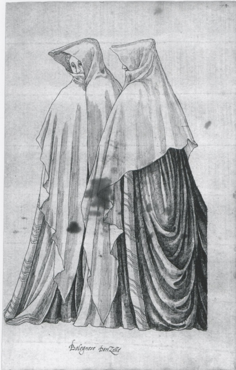
5 Jean Jacques Boissard, „Bolognese Donzelle“, in: Weimarer Trachtenbuch, fol. 74, Weimar, Herzogin Anna Amalia Bibliothek

ren Teil des Buches findet zwischen den Blättern eine Vermischung der Geschlechter statt, wobei durchgehend auf den einzelnen Buchseiten fast ausnahmslos gleichgeschlechtliche Paare erscheinen. Nach dem blattgroßen Wappen des Auftraggebers (Abb. 1), das von zwei Sensen und einem geflügelten Helm gebildet wird, und einem Kostümbild des Dogen von Venedig folgen 50 männliche Figurenpaare (Abb. 2–4), darauf (auf