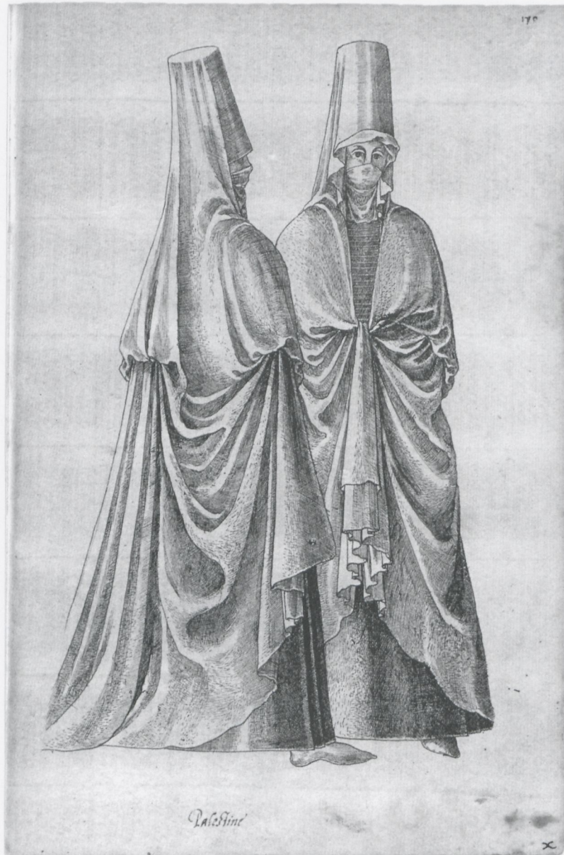
7 Jean Jacques Boissard, „Palestine“, in: Weimarer Trachtenbuch, fol. 170, Weimar, Herzogin Anna Amalia Bibliothek

Indien, Ägypten und Libyen ein. Eigenhändig versah der Zeichner die Blätter mit italienischen Bildunterschriften, wobei viele der Zeichnungen im hinteren Drittel der Handschrift keine Unterschriften mehr besitzen.