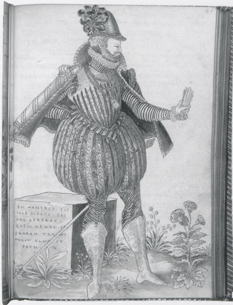
16 Jean Jacques Boissard, Edelmann in burgundischer Tracht, in: Carmina varia , fol. 71r, Berlin, Kupferstichkabinett

(Abb. 16). 48 Im Kontext der Handschrift, bei der es sich um ein authentisches Gedichtheft respektive eine Kompilation eigener Arbeiten handelt, die Boissard vermutlich dem 1571 in einer Seeschlacht gegen die Türken gestorbenen Freund Jacobus Guiasdovius gewidmet hat, 49 korrespondieren die Kostümbilder und eingestreuten Portraits oft mit den Gedichten, so daß ihnen mitunter die Funktion emblematischer picturae zukommt. Diese dem Gedichtheft eingefügten, zumeist lavierten Federzeichnungen sind beim derzeitigen Stand der Kenntnis von Boissards graphischem Werk später als die Berliner Bildhandschrift und das Weimarer Trachtenbuch zu datieren. Sein Frühwerk ist von