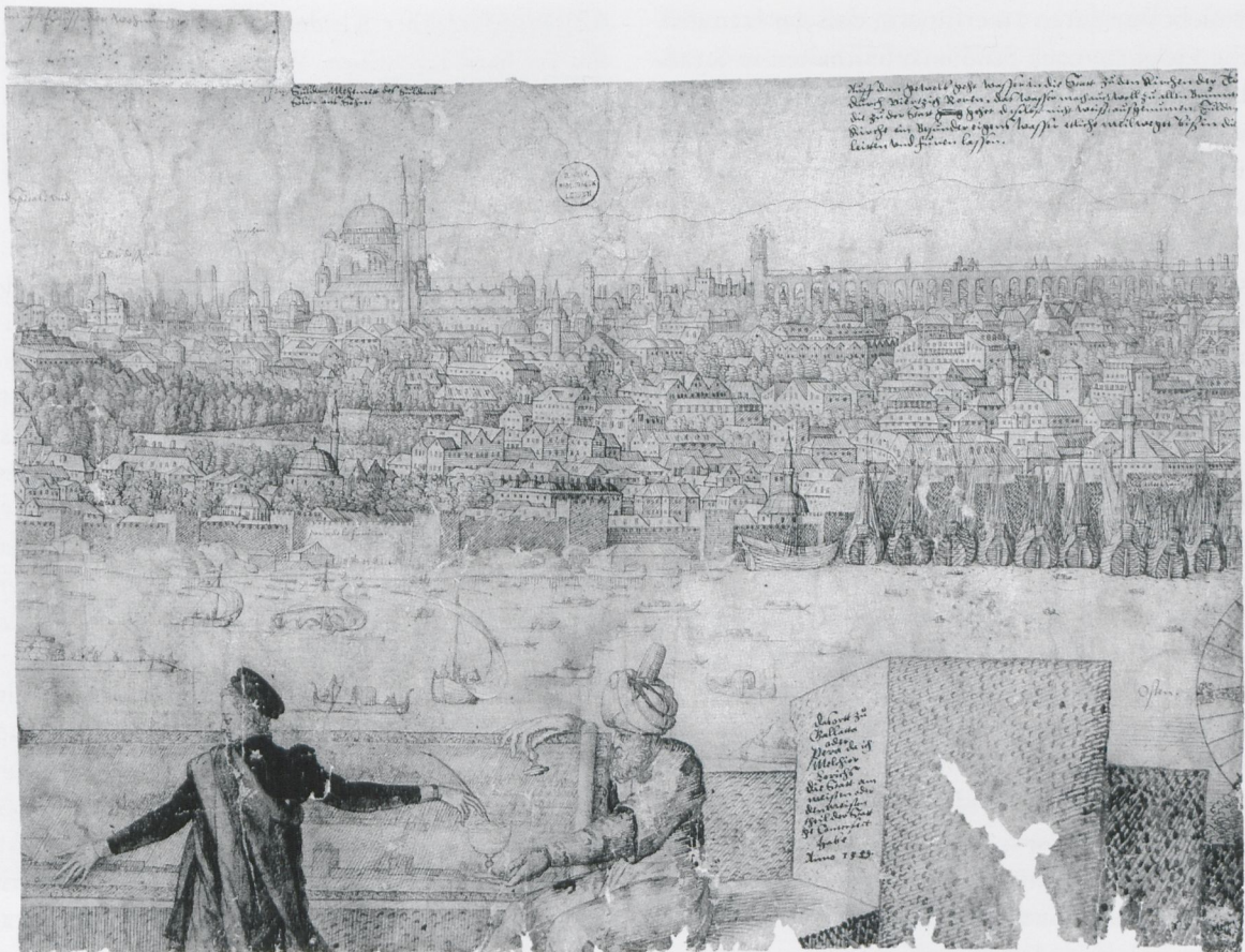
11 Melchior Lorck, Panorama von Konstantinopel, Detail, Leiden, Universitätsbibliothek

des Gegenstands zum Ziel hat, spiegeln Boissard und Melchior Lorck gleichermaßen den sich um die Jahrhundertmitte herausdifferenzierenden Künstlertypus des zeichnenden Antiquars.