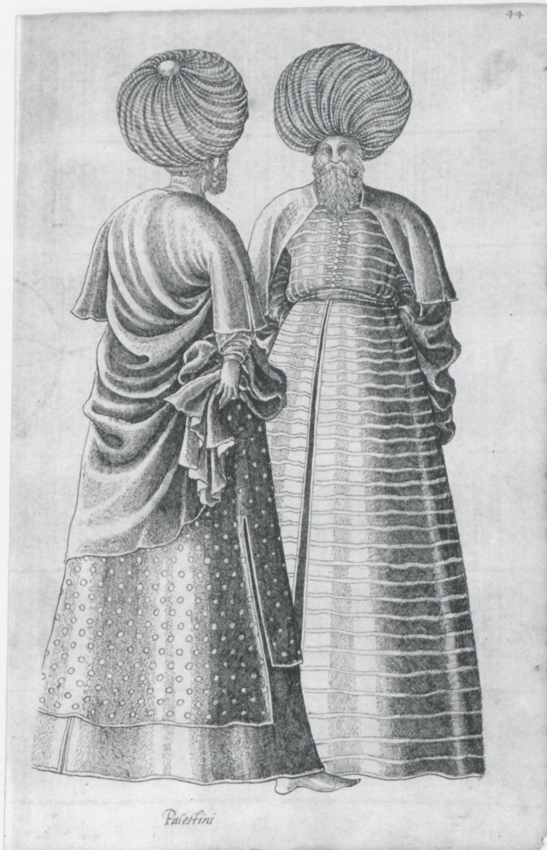
4 Jean Jacques Boissard, „Palestini“, in: Weimarer Trachtenbuch, fol. 44, Weimar, Herzogin Anna Amalia Bibliothek

Protagonisten. Im Verlauf des Dreißigjährigen Krieges wurde das Manuskript mit vielen anderen Büchern aus der Kunstkammer, die im Gegensatz zur Hofbibliothek zuvor nicht aus München entfernt worden war, durch einen der im Dienste des schwedischen Königs Gustav Adolf stehenden Weimarer Herzöge nach Sachsen-Weimar verschleppt. Demnach dürfte das Buch schon im Mai 1632 aus der Münchner Kunstkammer als