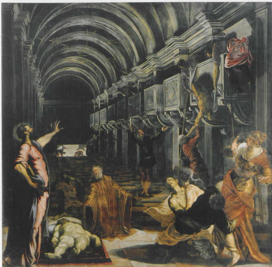
ABB. 6: Jacopo Tintoretto, Die Auffindung der Leiche des Heiligen Markus , 1562–66, Öl auf Leinwand, 405 × 405 cm. Mailand, Pinacoteca di Brera (Reg. Cron. 5959)

sich hier nicht um eine sogenannte kontinuierliche Erzählhaltung handelt, bei der der Heilige gleich dreimal auftaucht, von der entmaterialisierten Geistererscheinung im Gewölbe abgesehen – bei der ich mich im Übrigen frage, ob und woher sie Caspar David Friedrich gekannt haben kann. Die Seele des verstorbenen Kindes und der sie empfangende Engel schweben in Friedrichs unvollendetem Friedhofsbild von um 1825 sehr ähnlich unwirklich, mit hellen un-