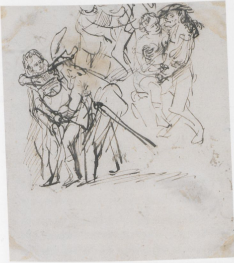
ABB. 13: Rembrandt, Studien zum Verlorenen Sohn , um 1635, Feder in Braun, auf Papier, 173 × 155 mm. Berlin, Staatliche Museen zu Berlin, Kupferstichkabinett (KdZ 2312)

hat, wird dadurch deutlich, dass die obere Szene beschnitten ist. Ganz offensichtlich handelt es sich um Szenen zum Verlorenen Sohn im Bordell, Federhut und Degen weisen ihn in der Bildtradition aus. 28 In der vorderen der drei Szenen ist der Verlorene Sohn kaum zu bremsen, er greift der Dame so unmittelbar zwischen die Beine, dass sie dies einerseits mit festem Griff der Rechten zu verhindern sucht und mit dem linken schwer ausholenden Arm dem in jeder Hinsicht verlorenen Sohn eines auf die Nase geben wird. Die obere Szene, die flüchtigste der drei, zeigt ihn wieder mit unverhohlenem Griff, ihre Reaktion bleibt offen. Die dritte rechte Szene hat zum Einverständnis geführt, beide scheinen erfreut, sie weitgehend nackt sitzt auf seinem Schoß, er ist oben und unten beschäftigt und stellt in seiner Freude offenbar auch noch das Einverständnis mit dem wohl männlich zu denkenden Betrachter her. Sie, das ist für die Folge nicht unwichtig, hat ihr rechtes