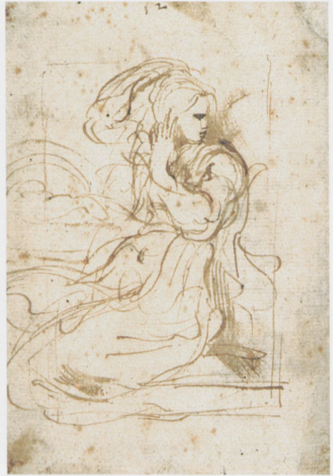
ABB. 2: Parmigianino, Frau, die sich kämmt , um 1525, Rötel, Feder in Braun, auf Papier, 143 × 100 mm. Parma, Galleria Nazionale (510/17)