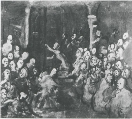
ABB. 7: Domenico Tintoretto, Skizze zur »Auffindung des Leichnams des Heiligen Markus« , Öl auf Papier, 265 × 305 mm. Privatsammlung

Auftraggeber Rangone handeln dürfte, er betrachtet den Leichnam des Wiederaufgefundenen, kann also nicht den agierenden Heiligen Markus oder die Geistererscheinung erfahren. Wie wir gleich sehen werden, weicht Tintoretto bei seiner Auffassung sowohl von der Legenden- wie der Bildtradition des Themas entschieden ab. Er stellt einen ganzen Prozess dar, der sich nicht in einem einzigen Moment verdichtet und insofern in doppelter Hinsicht zeitaufhebend ist. Auch dies wäre klassischer Erzählhaltung eher fremd gewesen.