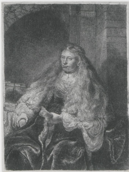
ABB. 10: Rembrandt, Die große Judenbraut , 1635, Radierung, 5. Zustand, 219 × 168 mm. Hamburg, Hamburger Kunsthalle, Kupferstichkabinett (6105)