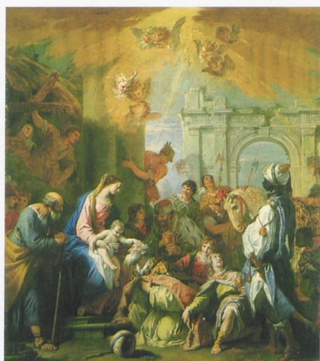
ABB. 24: Sebastiano Ricci, Anbetung der Könige , 1726, Öl auf Leinwand, 325,5 × 291,5 cm. Windsor Castle, Royal Collection (RCIN 405743)