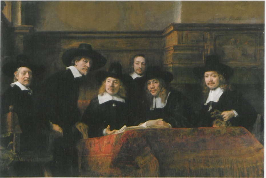
ABB. 15: Rembrandt, Die Staalmeesters , 1662, Öl auf Leinwand, 191,5 × 279,0 cm. Amsterdam, Rijksmuseum (C 6)

Es existieren drei zugehörige Zeichnungen, die auf den Prozess der Bildfindung aufmerksam machen können, ferner Röntgenaufnahmen,