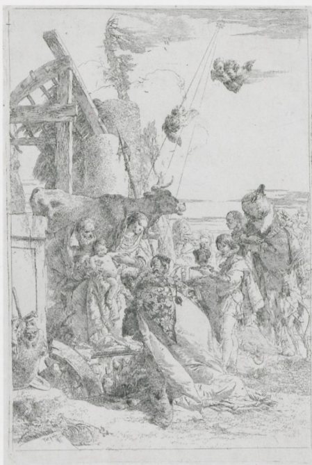
ABB. 23: Giovanni Battista Tiepolo, Anbetung der Könige , um 1750, Radierung (1. Zustand), 413 × 238 mm. Hamburg, Hamburger Kunsthalle, Kupferstichkabinett (2954)

zudem auf die Tiziansche Tradition des Themas anspielt, die auch nicht ganz ohne Ambivalenz auskommt. Doch wohl eher geht's, wundervoll gemalt, um die Fragwürdigkeit des Mythos und seiner Tradition in der Gegenwart. Es hat eine deutliche Sinnentleerung stattgefunden.