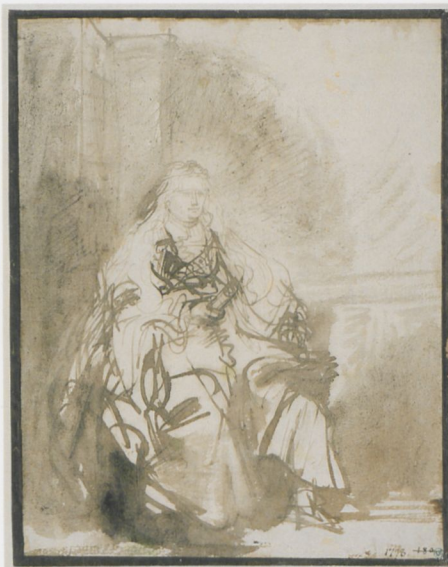
ABB. 9: Rembrandt, Zeichnung zur »Großen Judenbraut«, 1635, Feder in Braun, braun laviert, auf Papier, 240 × 190 mm. Stockholm, Nationalmuseum (NM 1992/1863)

Wie weit Entwurf und Ausführung auseinander liegen können, sei allein an Domenicos Fassungen des Wunders der Wiederauffindung des Leichnams des Heiligen Markus , der sogenannten Apparazione , wie die Fassung des Vaters für die Scuola Grande di San Marco gedacht, demonstriert (ABB. 7–8). 22 Hätten wir nicht in beiden Fassungen bei Domenico unten links die angeschnittene, sich stark aus dem Bild heraus umwendende Figur, so könnten wir kaum erkennen, dass es sich um einen Zusammenhang von Vor- und Nachbild handelt. Erst genauere Betrachtung stellt den Zusammen-