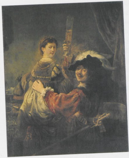
ABB. 14: Rembrandt, Rembrandt und Saskia in der Szene vom Verlorenen Sohn , um 1635, Öl auf Leinwand, 161 × 131 cm. Dresden, Staatliche Kunstsammlungen, Gemäldegalerie Alte Meister (Gal. Nr. 1559)

hat, wird dadurch deutlich, dass die obere Szene beschnitten ist. Ganz offensichtlich handelt es sich um Szenen zum Verlorenen Sohn im Bordell, Federhut und Degen weisen ihn in der Bildtradition aus. 28 In der vorderen der drei Szenen ist der Verlorene Sohn kaum zu bremsen, er greift der Dame so unmittelbar zwischen die Beine, dass sie dies einerseits mit festem Griff der Rechten zu verhindern sucht und mit dem linken schwer ausholenden Arm dem in jeder Hinsicht verlorenen Sohn eines auf die Nase geben wird. Die obere Szene, die flüchtigste der drei, zeigt ihn wieder mit unverhohlenem Griff, ihre Reaktion bleibt offen. Die dritte rechte Szene hat zum Einverständnis geführt, beide scheinen erfreut, sie weitgehend nackt sitzt auf seinem Schoß, er ist oben und unten beschäftigt und stellt in seiner Freude offenbar auch noch das Einverständnis mit dem wohl männlich zu denkenden Betrachter her. Sie, das ist für die Folge nicht unwichtig, hat ihr rechtes