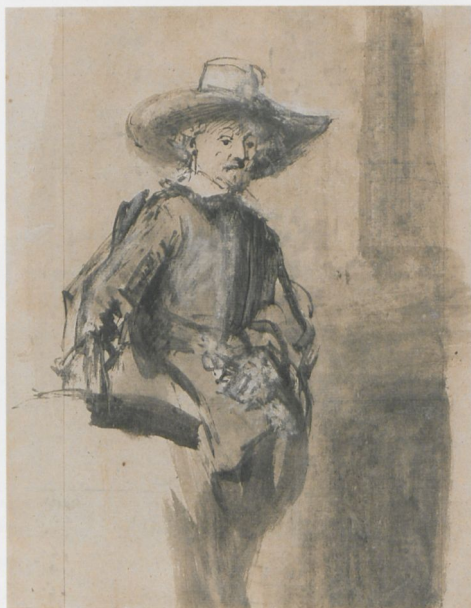
ABB. 17: Rembrandt, Studie zu den »Staalmeesters« , Figur des Volkert Jansz. , 1662, Feder in Braun, braun laviert, auf Papier, 225 × 175 mm. Rotterdam, Museum Boijmans Van Beuningen (R 133)

Die jeweilige Lösung bietet erst das Gemälde, besonders mit dem geradezu gewagten Motiv des ehemals Stehenden, der sich nun gerade erhebt – ein für ein dokumentierendes offizielles Gruppenporträt ungewöhnlich transitorisches