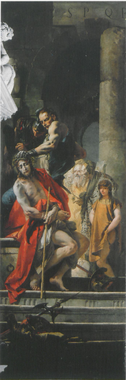
ABB. 20: Giovanni Battista Tiepolo, Dornenkrönung , 1738–40, Öl auf Leinwand, 450 × 135 cm. Venedig, S. Alvise

zeichnung gibt, schon dadurch, dass das Tempo der Federzeichnung rasant gewesen sein muss. Auch die Lavierung erfolgt mit gänzlicher Freiheit, beständig die angedeuteten Formen und Figurationen überschreitend. Sie deutet ebenfalls aufs flüchtigste den Lichteinfall an, in dem sie Schattenzonen markiert. Überzeichnungen mit der Feder besonders bezogen auf Kopfhaltungen sind nicht selten. Auch damit liegt eher eine Art Angebot für die Druckgraphik vor. 4. Die Zeichnungen ermöglichen ansatzweise eine szenische Vorstellung, die es in der Radierung zu verfolgen gilt, die aber auch dort eigenen Erfordernissen folgt, die sich erst im Prozess des Radierens ergeben. 5. Ein und dieselbe Zeichnung kann für verschiedene Capricci oder Scherzi genutzt werden.