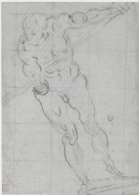
ABB. 5: Jacopo Tintoretto, Männliche Figurenstudie , um 1578–1580, schwarze Kreide, auf Papier, 262 × 191 mm. Rotterdam, Museum Boijmans Van Beuningen (I 452)

weise, durch gemäldetechnologische Untersuchungen gedeckt wird. Danach hat Jacopo Tintoretto Wachsfigürchen auf einer gerasterten Fläche platziert, sie unterschiedliche Posen einnehmen lassen und sie aus verschiedenem Blickwinkel betrachtet, um Staffellungen, Überschneidungen und räumliche Abstände erfahren zu können, er dürfte sie durch einen Visierahmen betrachtet haben, konnte sie auf der Fläche verschieben, um so eine Vorstellung einer sinnvollen Anordnung gewinnen zu können. Damit war eine doppelte Erfahrung möglich, eine räumlich-plastische in adäquater Zuordnung und eine flächenmäßige. Der mit Fäden bespannte und quadrierte Visierahmen ermöglichte eine direkte Übertragung dieser Grundkonstellation auf die Leinwand offenbar in flüchtigen Grisaille- bzw. Chiaroscuro-Farben,