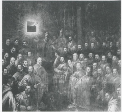
ABB. 8: Domenico Tintoretto, Auffindung des Leichnams des Heiligen Markus . Venedig, Scuola Grande di San Marco

Jacopo Tintoretts Sohn Domenico hat in vielerlei Hinsicht das Werk und die Werkauffassung des Vaters fortgeführt, unterscheidet sich in einem Punkt jedoch deutlich von ihm und ist damit offensichtlich traditionsstiftend geworden. Domenico scheint auf das Studium der Wachsfiguren in ihrer Anordnung auf dem Schachbrett verzichtet zu haben. Dafür hat er sich auf Chiaroscuro-Zeichnungen in Öl auf Papier verlassen, als flüchtige Kompositionsentwürfe. Man kann fragen, warum er das Verfahren des Vaters nicht fortgeführt hat. Die Antwort dürfte darin zu sehen sein, dass die Übertragung von räumlich Gesehenem und von nur