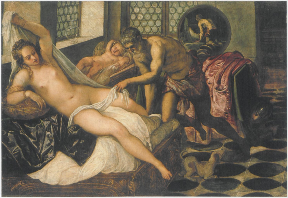
ABB. 4: Jacopo Tintoretto, Vulkan überrascht Venus und Mars , um 1555, Öl auf Leinwand, 134 × 196 cm. München, Bayerische Staatsgemäldesammlungen, Alte Pinakothek (9257)

bei dem der freie, geradezu wilde Lauf der Feder fast zum Selbstzweck wird (ABB. 2), das heißt, ornamentale Formen annimmt und auf „bravura“ als solche zielt. 10 Bei Raffael dient der Federfluss letztlich immer einem Bildzweck. Und dennoch ist auch Raffael bewusst geworden, dass die zeichnerische Form künstlerische Qualitäten für sich gewinnt, sonst hätte er seine Zeichnungen nicht druckgraphisch reproduzieren lassen und sie zu Sammelobjekten werden lassen. So sehr die Druckgraphik auf eine verfestigte Form und auf die Fixierung einer Bildidee zielt, sie bewahrt dennoch Züge des Zeichnerischen auf, zielt nicht auf ein Äquivalent für farbige Bildmäßigkeit. Selbst bei den Clairobscurholzschnitten von Ugo da Carpi nach Raffaels Hampton Court-Kartons bleibt der Kartoncharakter anschaulich. Die Vorstel-