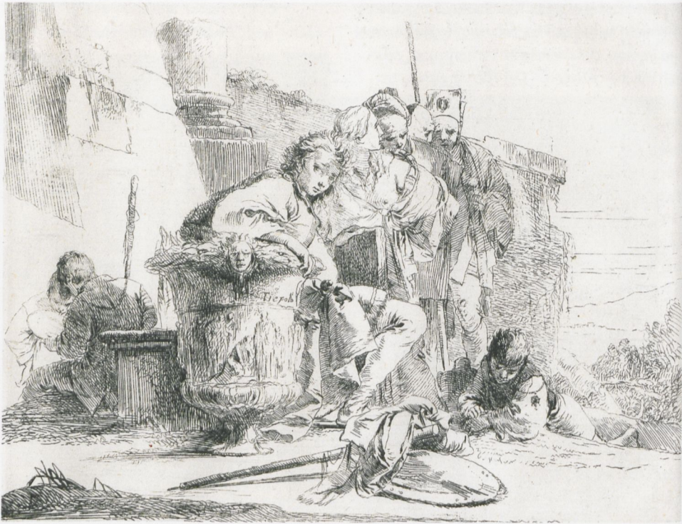
ABB. 18: Giovanni Battista Tiepolo, Blatt 1 der »Capricci«, 1740er Jahre, Radierung, 140 × 180 mm. London, British Museum, Department of Prints and Drawings (1851,0308.1098)

3. Mein drittes Beispiel gilt dem, wie es immer so schön in der Literatur heißt, letzten barocken Klassiker Italiens, der, wie zu zeigen sein wird, zwar die offiziellsten Bilder, die sich überhaupt denken lassen, malt, dies aber so unklassisch tut, dass man nur staunen kann. Gemeint ist Giovanni Battista Tiepolo. Um zu begreifen, welche Rolle die Zeichnung bei