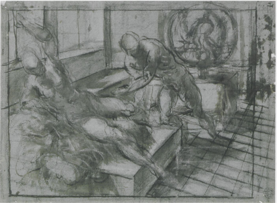
ABB. 3: Jacopo Tintoretto, Venus und Vulkan , um 1555, Feder und Pinsel in Braun, grau und braun laviert, auf Papier, 201 × 272 mm. Berlin, Staatliche Museen zu Berlin, Kupferstichkabinett (KdZ 4193)

Reinzeichnung dann bekleidet wird, sie bildet den sogenannten „modello“ und 5. häufig in größerem Format, wenn nicht in der Größe des geplanten Bildes, der Karton, der zur direkten Übertragung ins Bild dient. Er kann quadriert sein, um die Übertragung im Maßstab oder, vor allem beim Wandbild, in einem stufenweisen Prozess auch durch Schüler zu erleichtern. Dabei können die verschiedensten Übertragungsverfahren zur Anwendung kommen, Paus- und Durchdruckverfahren etc. 9 Der Katalog führt für so gut wie all diese Stufen einschlägige Beispiele an. Auch wird darauf hingewiesen, dass Raffael die zeichnerischen Medien je nach Stufe und vor allem Funktion variiert: Beim Modellstudium, wo es auf die Fixierung bestimmter Posen, vor allem in der Verkürzung, ankommt, verwendet Raffael zu-