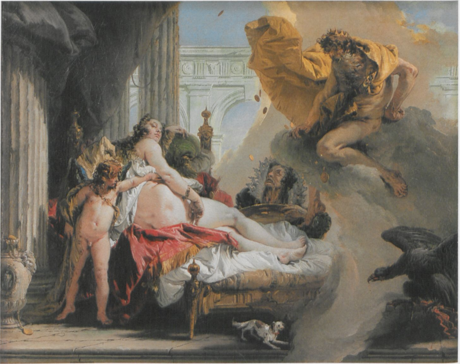
ABB. 22: Giovanni Battista Tiepolo, Danae und Jupiter , 1734–36, Öl auf Leinwand, 41 × 53 cm. Stockholm, Universitäts-sammlung, J. A. Berg Collection (230)

dem handelnden Schergen? Die drei sind eine geisterhafte Erscheinung. Warum stehen sie vor einer ebenso fahl erleuchteten Urne mit Satyrsmaske, wie sie sich hundertfach bei Tiepolo findet und die nicht selten ein Zitat oder eher noch eine Variante aus Montfaucons Monumentalwerk „L'antiquité expliquée“ darstellt, und worauf sitzt Christus, handelt es sich um einen Sarkophag? Geht man nah an das Bild heran, so sieht man, dass der Knabe (ABB. 21), vielleicht ein venezianischer Straßenjunge, weint, also in klassischer Weise nach Albertischer Anweisung unsere eingeforderte Emotion vorgibt. Und beim Patriarchen sieht man, dass er eine Kette mit einem Medaillon trägt, die Tiepolo ohn' Unterlass darstellt, auf den Capricci und Scherzi ,