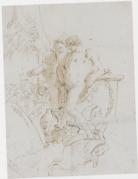
ABB. 19: Giovanni Battista Tiepolo, Junger Mann und Magier am Altar , 1740er Jahre, Feder laviert, auf Papier, 207 × 153 mm. London, Victoria & Albert Museum (D 1825.41-1885)

Sieht man die im Zusammenhang mit den Graphikfolgen stehenden Zeichnungen (ABB. 19) durch – und es gibt weitere in anderen Sammlungen – dann wird schnell deutlich: 1. Es gibt motivische Übernahmen aus den Zeichnungen in die Graphiken, doch keinen einzigen vollständigen Entwurf, dem gefolgt worden wäre. 2. Die Zeichnungen umkreisen permanent verwandte Konstellationen von zwei oder mehr Personen, die immer neu kombiniert werden, wobei sie in der Zeichnung nur flüchtig angedeutet sind. Offenbar ist die Variation der Konstellation wichtiger als das, was sie bezeichnen könnte. 3. Trotz der ausgeprägten Flüchtigkeit der Zeichnungen sind sie fast immer zuerst auf noch flüchtigere Weise mit schwarzer Kreide angelegt, um dann mit der Feder und häufig auch mit Lavierung übergangen zu werden, wobei es gehörige Abweichungen von der Unter-