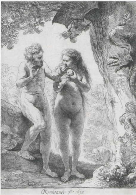
ABB. 12: Rembrandt, Adam und Eva , 1638, Radierung, 162 × 116 mm. Hamburg, Hamburger Kunsthalle, Kupferstichkabinett (6135)

Als zweites Beispiel auch ein entschiedenes Erotikon, das aber nur gewählt wurde, weil hier gleich drei differierende Momente sich auf einer Zeichnung (ABB. 13) finden und auch die Folge aus dem Ausloten der Möglichkeiten eines Motives in Form eines Gemäldes vorhanden ist. Es handelt sich um eine Berliner Zeichnung, deren Revers, das aber schließlich wohl zum Avers wurde, eine Beweinung Christi unter dem Kreuz zeigt, die in weiterem Zusammenhang mit der Londoner Beweinung steht, die auf ölgetränktem Papier Federkreide und Ölfarben aufweist und wie die hier in Frage stehende Zeichnung um 1635 zu datieren ist, auch dort ist ein im Vergleich zur Zeichnung abweichender Moment dargestellt. Dass es sich bei der Darstellung der drei Momente ursprünglich um die Hauptseite der Zeichnung gehandelt