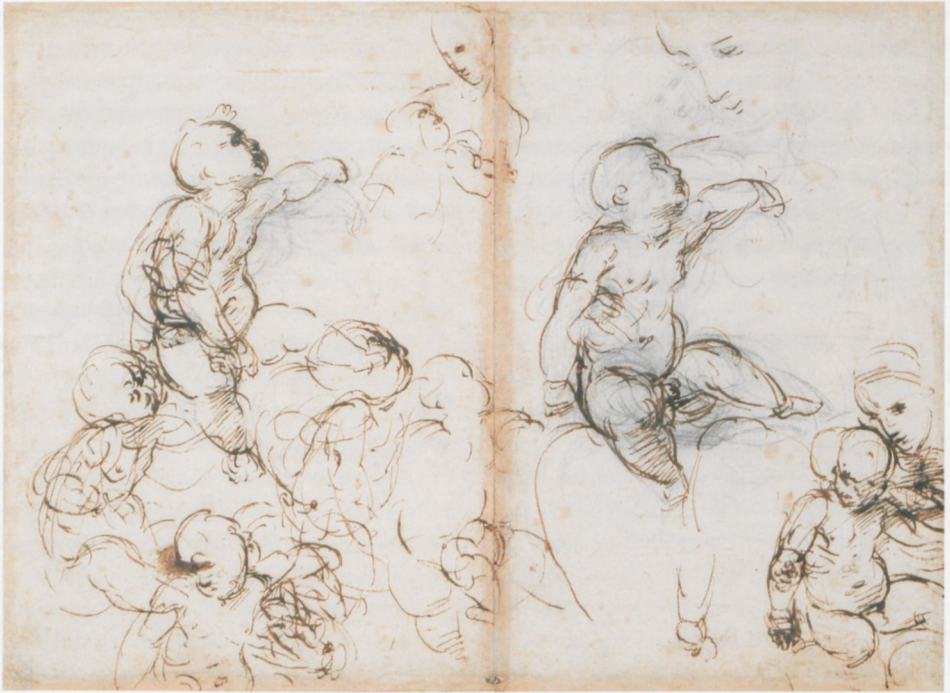
ABB. 1: Raffael, Studien zu Maria mit dem Kind , um 1508, Feder in Braun, über schwarzem Stift, auf Papier, 230 × 313 mm. Paris, Ecole Nationale Supérieure des Beaux-Arts (inv. 310)