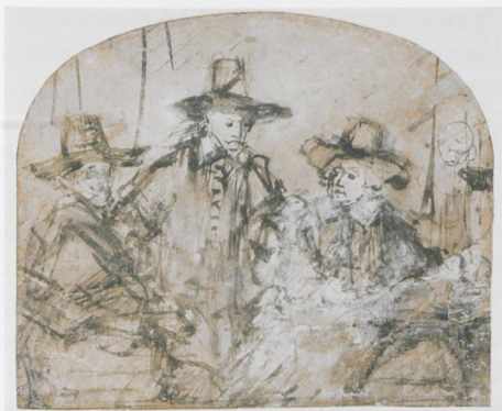
ABB. 16: Rembrandt, Studie zu den »Staalmeesters« , 1662, Feder in Braun, braun laviert, weiß gehöhlt, auf Papier, 173 × 205 mm. Berlin, Staatliche Museen zu Berlin, Kupferstichkabinett (KdZ 5270)

die vor allem geradezu eine Rochade der einzigen nicht mit einem breiten Hut ausgezeichneten Person, des Dieners im Hintergrund, deutlich machen können. 30 Der Diener wanderte von ganz rechts erst zwischen die beiden rechts am Tisch sitzenden Tuchmeister, um schließlich, wiederum von weiteren Änderungen begleitet, seinen jetzigen etwas beengten Platz zwischen zweiter und dritter Figur von rechts zu finden. Die erhaltenen zugehörigen Zeichnungen beschäftigen sich allein mit der linken Gruppe. Auf der Berliner Zeichnung (ABB. 16) in grober Rohrfeder in Braun mit brauner Lavierung und Weißhöhung, die sowohl markiert als auch zur Korrektur Partien überdeckt, auf braunem, offenbar aus einem Kassenbuch stammendem Papier, sind die drei linken Figuren dargestellt. Die Zeichnung ist beschnitten, da rechts die Hutkrempe der vierten Figur noch zu sehen ist, darüber findet sich das bloße Rund einer Kopfform: offenbar des Dieners, der hier erst ganz am Schluss seinen Platz gefunden hat. Insofern kann es sich nicht um einen ersten Entwurf handeln, sondern eben um eine intermediäre Zeichnung, bei der es, wie zu vermuten ist, um die