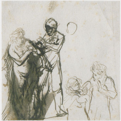
ABB. 11: Rembrandt, Studie für »Adam und Eva« , 1638, Feder in Braun, braun laviert, auf Papier, 115 × 115 mm. Leiden, Prentenkabinet Universiteit Leiden (AW 1097)

Nun gibt es bei Rembrandt nicht nur eine Suche nach Detailformen, bei der klassische Künstler auf das Modellstudium zurückgegriffen hätten, sondern auch eine ausgeprägte Suche nach Motivmöglichkeiten. Man kann sich das gut klar machen an Rembrandts mit seinen Schülern unternommenen Zeichnungsübungen nach dem posierenden Modell oder, wie wir auch annehmen müssen, nach einer im Atelier gestellten szenischen Konfiguration. 26 Die Schüler und ihr Lehrer haben, wie zwei Zeichnungen aus dem Rembrandtkreis deutlich machen, im Kreis um das Modell oder die szenische Gruppe herumgesessen, so dass jeder Schüler seinen eigenen, vom Nebenmann und erst recht vom Gegenüber abweichenden Blickwinkel auf das Gesehene einnahm und die Szene folglich in unterschiedlicher Perspektive mit wenig oder eben auch mehr Überschneidungen oder Verkürzungen wiedergegeben hat. Anschließend dürften die Zeichnungen zusammengelegt worden sein, und Rembrandt wird