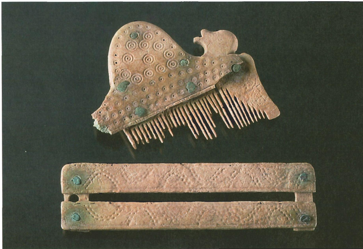
Kamm mit geschwungener Griffplatte und seitlichen Tierprotomen aus Bad Schönborn-Mingolsheim (Kreis Karlsruhe). Karlsruhe, Badisches Landesmuseum