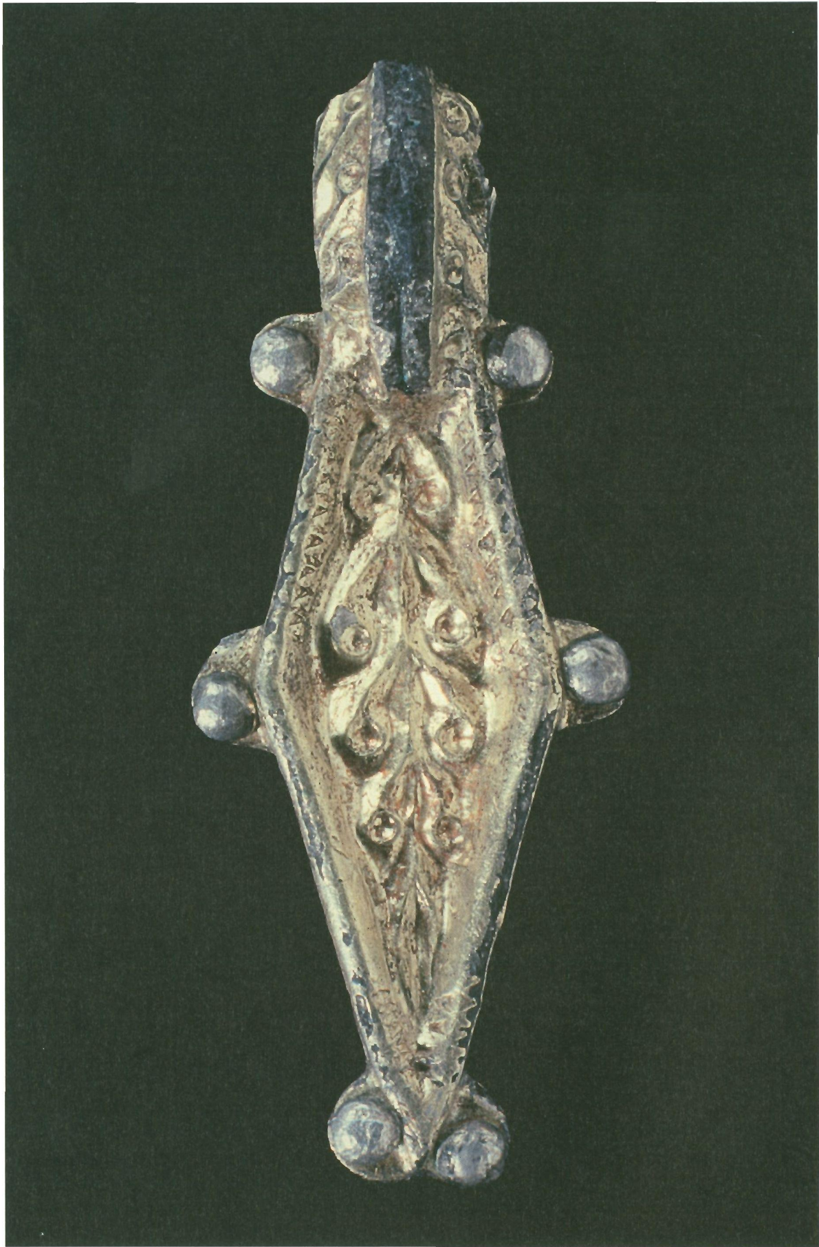
Bügelfibelfragment mit Kerbschnittdekor aus Walldorf (Rhein-Neckar- Kreis)