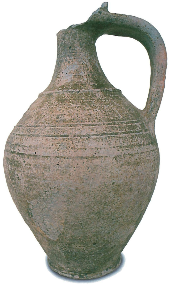
Krug der pannonischen glasierten Ware aus Wiesloch (Rhein-Neckar-Kreis). Wiesloch, Städtisches Museum

Bei den metallenen Objekten fällt es – abgesehen von der eingangs erwähnten dreiflügeligen Pfeilspitze – schwerer, eindeutige östliche Funde zu benennen, zumal die noch vor kurzem als donauländisch betrachteten frühen Schnallen mit Zellwerk und Almandinbesatz, wie sie rechts des Rheins aus Edingen, linksrheinisch vom Speyerer Germansberg oder aus dem pfälzischen Bobenheim-Roxheim nahe Worms vorliegen, inzwischen auch als mediterranen Ursprungs angesehen werden können. Belege aus Gräbern in Wolfenheim bei Mainz zeigen allerdings, dass sie sehr wohl mit Ostgermanen an den Ober- und Mittelrhein gelangt sein können. Auch im Besitzer des prunkvollen