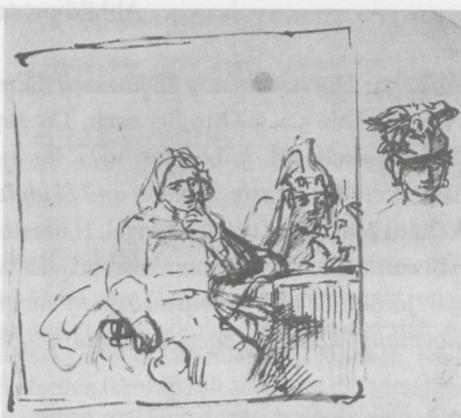
Abb. 5.6 Rembrandt, Nachdenklicher Mann am Tisch sitzend , o.J. Zeichnung, Paris, Fondation Custodia

Weise entgeht dem Scheitern nicht. 78 Aber wichtiger als diese existentielle Erkenntnis und die damit verbundene Selbstbescheidung erscheint mir jene der Aufhebung der Gegensätze und des Eigennutzes zugunsten der Freundschaft. Der griechische Philosoph schreibt in der „Nikomachischen Ethik“ über die edelste der drei Arten von Freundschaft: „Diese Freundschaft also ist hinsichtlich der Zeit und der übrigen Bedingungen vollkommen; in ihr wird jedem seitens des anderen in allem dasselbe und das gleiche zuteil, wie es bei Freunden sein muß.“ 79 So wie sich im Aristoteles -Gemälde Tast- und Sehsinn ergänzen, so stehen auch die Künste in einem freundschaftlichen Verhältnis zueinander. Dabei kann keine Kunst von sich behaupten, edler als eine andere zu sein. 80 Was lehrt uns das alles? Das Schicksal vermag niemand aufzuhalten. Den Verlust von Reichtum und Anerkennung kann Kunst nicht kompensieren, den Tod nicht abwenden. Aber wie die Freundschaft ist sie ein hohes Gut. Noch in der Darstellung des Scheiterns vermittelt sie Trost und Empathie. Ein anhaltendes Gespräch über Jahrhunderte hinweg.