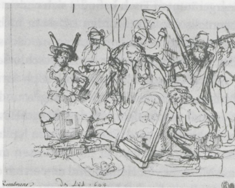
Abb. 5.3 Rembrandt, Satire auf die Kunstkritik , 1644, Federzeichnung, New York, The Metropolitan Museum of Art

eigentlichen Inhalt? Um über die bestehende Forschung hinauszugelangen, müssen wir uns erneut der Bilderzählung zuwenden. Für Held war das Moment der Vanitas zentral. So als würde Aristoteles über die Frage der Vergänglichkeit des Ruhms nachdenken, als würde er bezweifeln, dass seine Fama wie jene Homers die Zeiten überdauern wird. Diese Deutung sei zurückgewiesen, um in Bezug auf die Bilderzählung und ihren Protagonisten im Folgenden eine stärker biographische Deutung zu vertreten. So berichtet Diogenes Laertius in seiner Lebensbeschreibung, dass sich Aristoteles nach dem Tode Alexanders wegen seiner großen Nähe zum makedonischen Königshaus und der damit zusammenhängenden Anklage der Gotteslästerung gezwungen sah, Athen, die Akademie und seine Familie zu verlassen, um seiner Verurteilung zum Tode durch eine heimliche Flucht nach Chalkis zu entgehen. 47 Dort sei er wenig später gestorben. Dieser existenzielle Kontext ist für das Gemälde maßgebend.