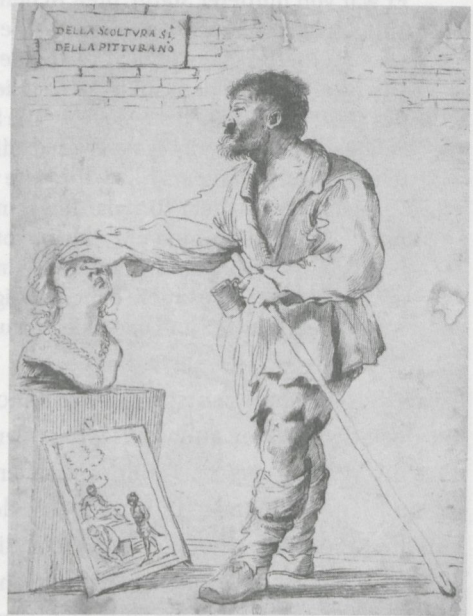
Abb. 5.4 Guercino (Umfeld), Allegorie von der Überlegenheit der Skulptur über die Malerei , um 1620, Federzeichnung, Paris, Musée du Louvre

wertenden Kommentar, wenn es heißt: „DELLA SCOLTVRA SI. DELLA PITTVRA NO.“, womit zugleich das eigentliche Thema im Sinne des Wettstreits von Skulptur und Malerei deutlich benannt wird.