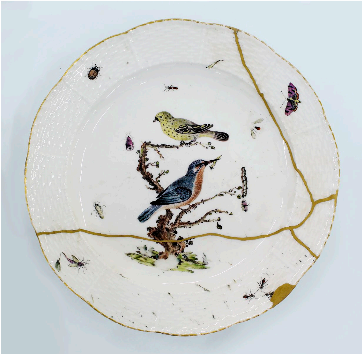
6 – Teller mit Vogeldekor, Porzellan, Meissen, um 1760

Von der Porzellansammlung Dresden 2010 an die Erben nach Gustav von Klemperer restituiert, seit 2010 Sammlung Edmund de Waal, London