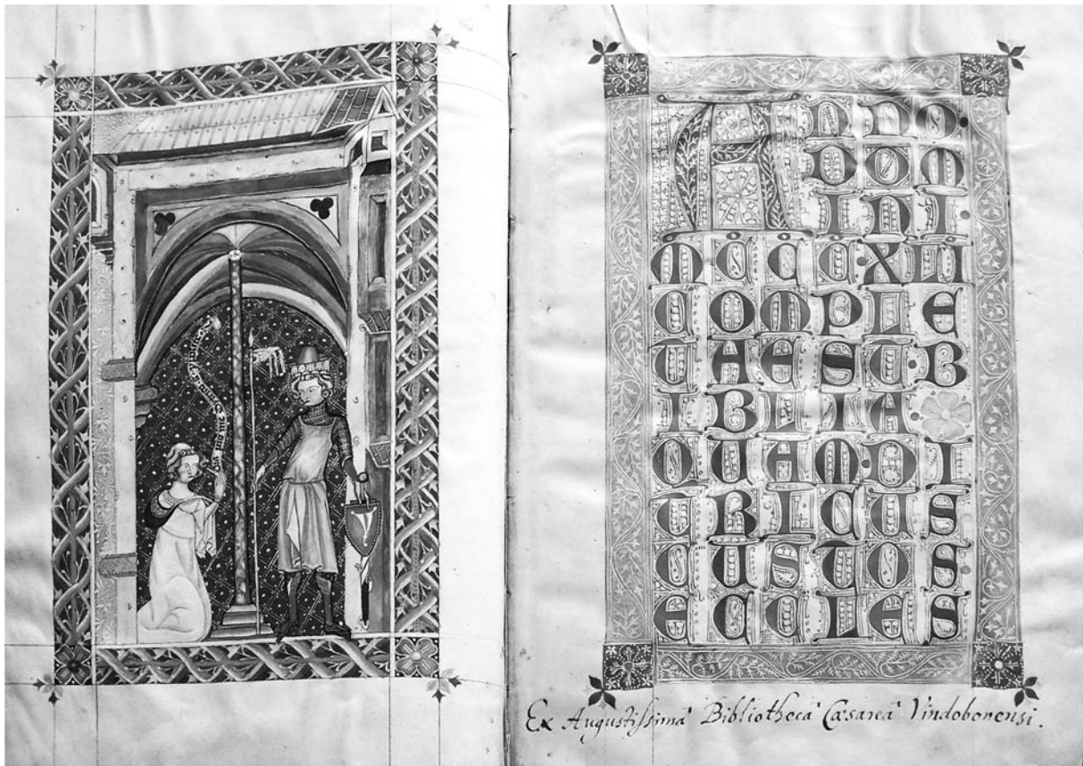
Abb. 4: Wien, Österreichische Nationalbibliothek, Cod. 1203, Ditracus-Bibel, fol. Iv–1r. St. Pölten 1341.

Ob das Doppelblatt fol. 1–2 immer am Beginn des letzten Bandes der Bibel stand, kann bezweifelt werden; vielleicht befand es so wie bei den karolingischen Bibeln ganz am Ende 80 . Vorbilder — seien es karolingische Bibeln und/oder ottonische Dedikationsdiptycha — können mit guten Gründen vermutet werden.