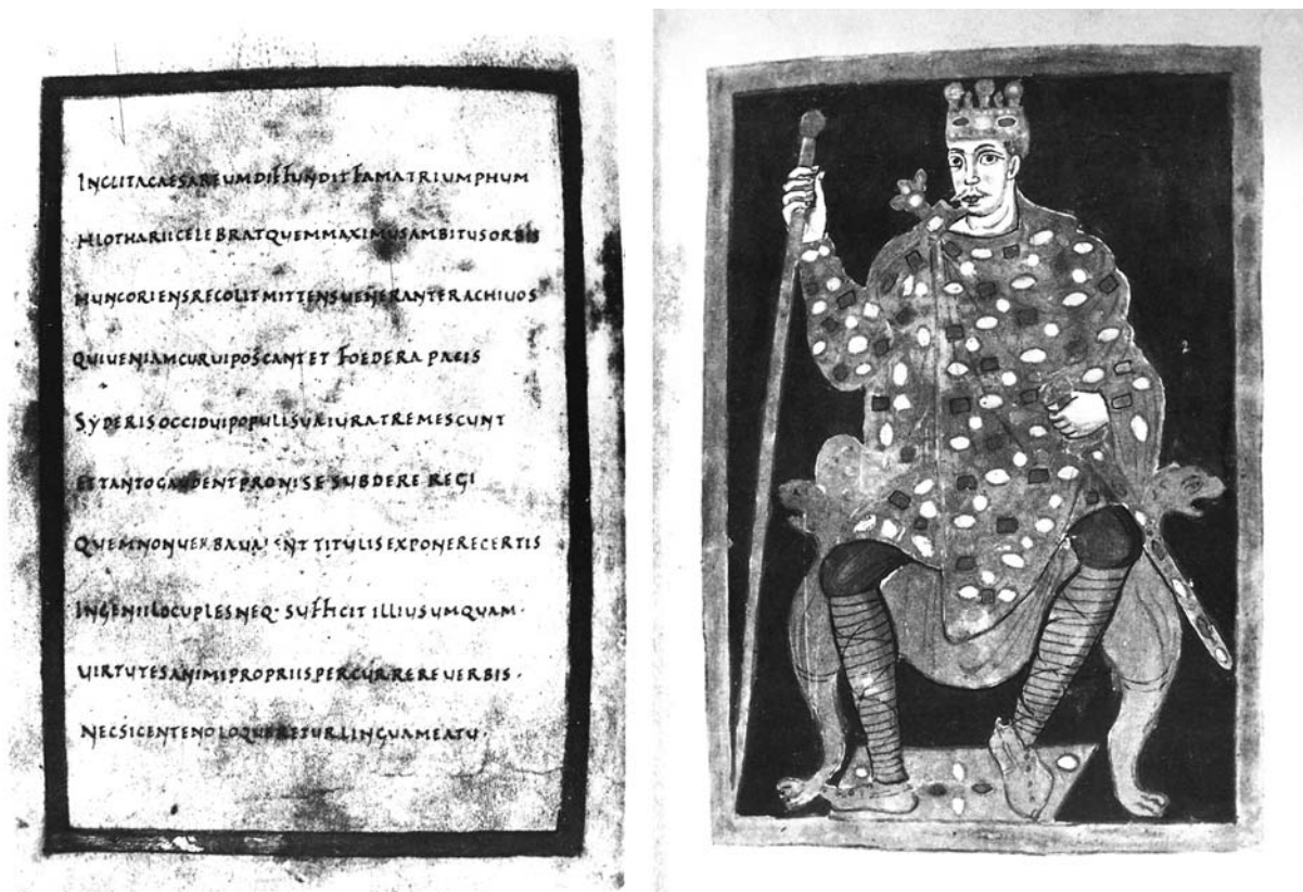
Abb. 1: London, British Library, Ms. Add. 37.768, Psalter Kaiser Lothars, fol. 3v–4r. Hofschule Kaiser Lothars, unmittelbar nach 842.

Das erste vollgültige Beispiel stellt der wohl unmittelbar nach der byzantinischen Gesandtschaft von 842 (auf die in den Versen Bezug genommen wird) entstandene Psalter Kaiser Lothars 12 dar (Abb. 1). Auf fol. 3v befinden sich die mit einem einfachen goldenen Rahmen umgebenen und in Capitalis rustica (ein für unsere Zwecke offenbar besonders beliebter Schriftgrad) geschriebenen Verse 13 . Auf fol. 4r steht diesen das Bild des alleine thronenden Kaisers gegenüber, auf das sich die Verse beziehen. Sie loben Lothar und erwähnen als einziges konkretes Ereignis die für die Datierung wichtige Botschaftsreise an seinen Hof. Das von seiner Größe her eher private und seiner Qualität nach eher bescheidene Buch wird durch die voll ausgebildete Text-Bild-Botschaft als Eigentum Lothars ausgewiesen. Eine weiterreichende propagandistische Verwendung (etwa im permanent schwelenden Streit Lothars mit seinen Brüdern) ist — anders als bei den nun vorzustellenden Werken — kaum zu vermuten.