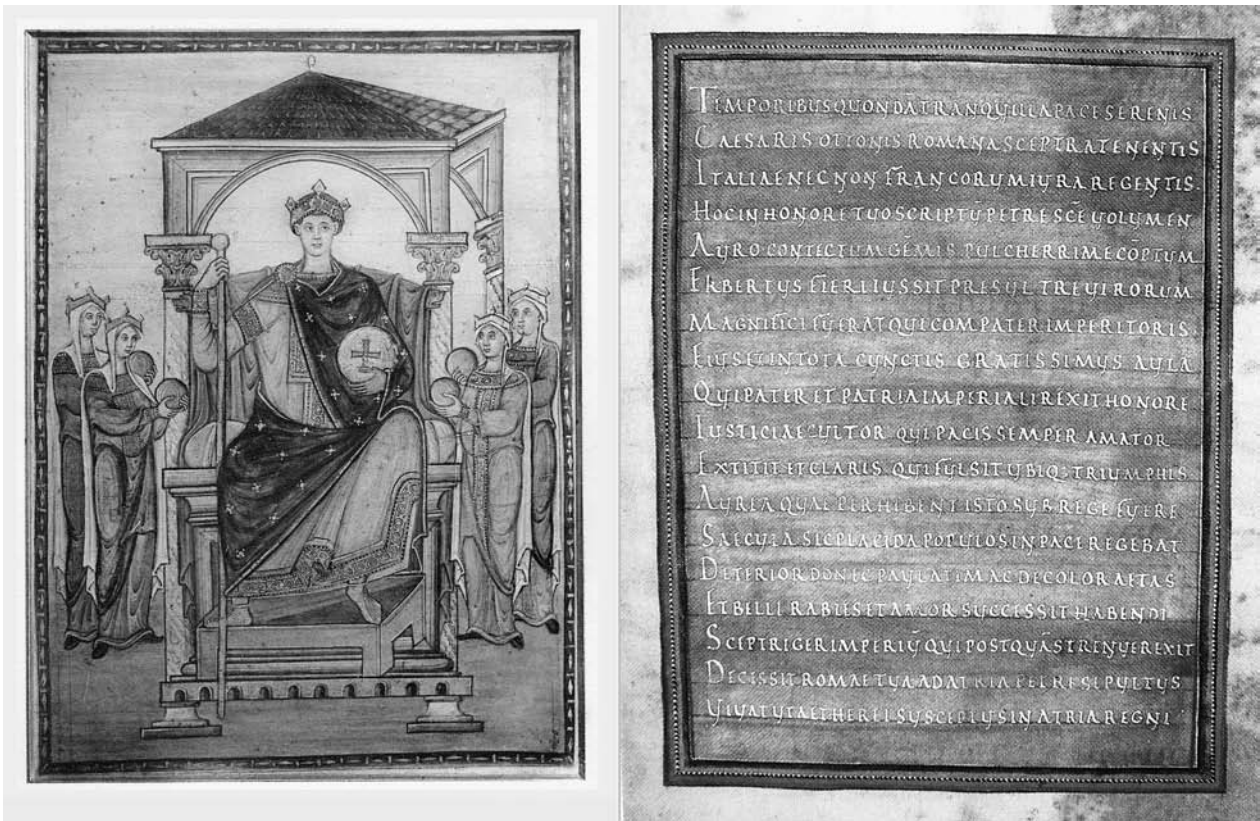
Abb. 2b: Chantilly, Musée Condé, Nr. 15654 (Thronender Herrscher) und Trier, Stadtbibliothek, 171a (Dedicatio). Meister des Registrum Gregorii, zwischen 983 und 993.

Carl Nordenfalk geht z. B. davon aus, daß die beiden Miniaturen ein Diptychon gebildet hätten (Abb. 2a) und begründet dies mit den identischen Rahmen und der Tatsache, daß die Figuren gleich groß seien 43 . Die seitwärts gerichtete Haltung Gregors ist jedoch wesentlich weniger auf sich selbst bezogen als der frontal thronende Kaiser. Noch gewichtiger ist die Tatsache, daß der Kaiser signifikant höher im Bildfeld thront als der Papst. Dies sind kompositorische Mittel um Subordination anzuzeigen. Selbst wenn nicht der verehrte Kirchenvater Gregor sondern ein gleichzeitig der Kirche vorstehender Papst gemeint wäre, ist eine derartige bildimmanente Unterordnung beispiellos 44 .