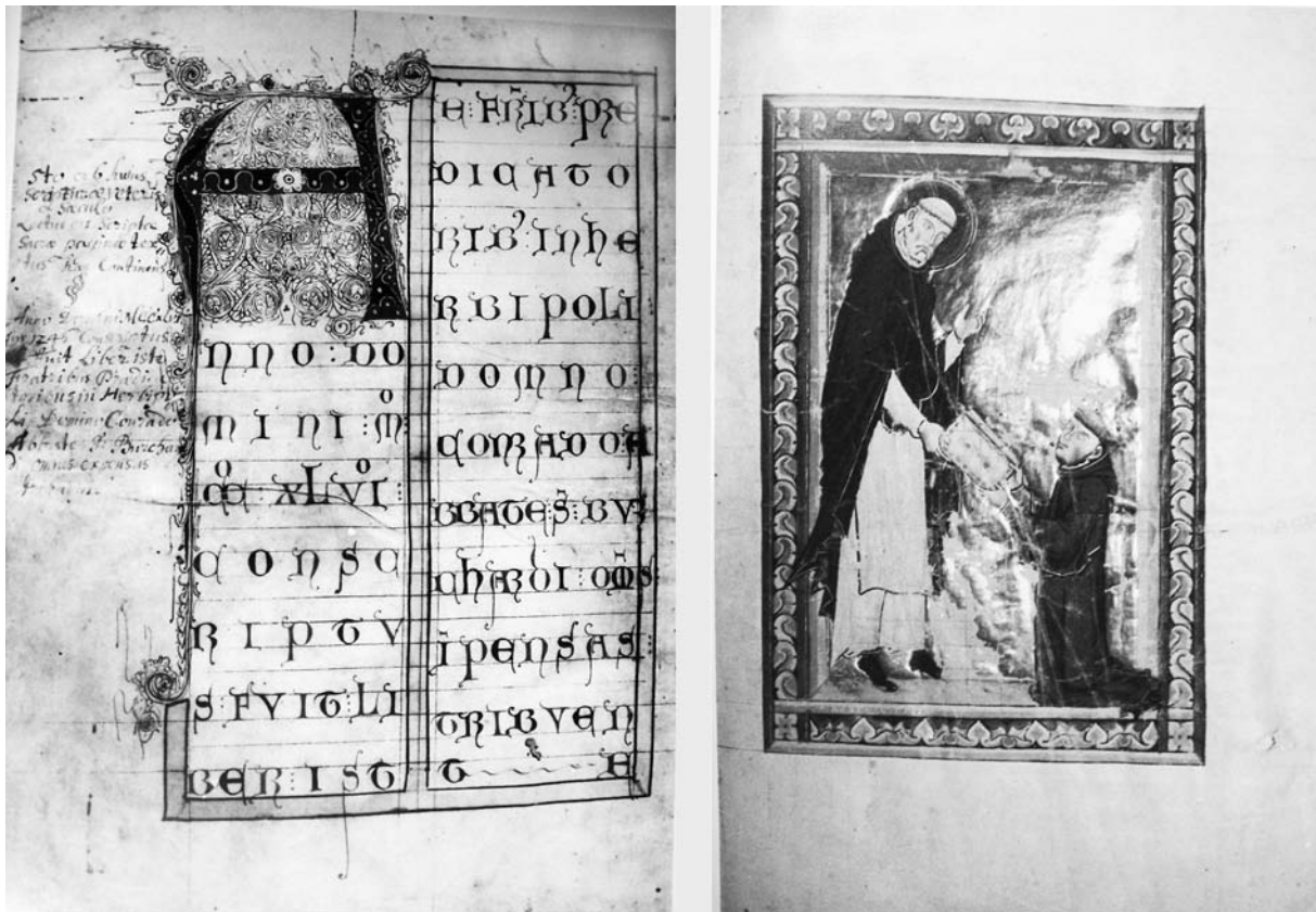
Abb. 3: Würzburg, Universitätsbibliothek, M. p. th. f. m. 9 (Bibl. fol. max. 9), Bd. 4, Dominikaner-Bibel, fol. 1v–2r. Würzburg 1246.

Hohes zumindest angestrebt wurde, zeigen der Rahmen und die aufwendige Fleuronné-Initiale. Gegenüber (fol. 2r) kniet der Abt vor dem hl. Dominicus 78 , dem er ein Buch übergibt (Abb. 3). Der Buchmaler vermerkt seinen Namen klein unter dem Heiligen auf der inneren Rahmenleiste 79 .