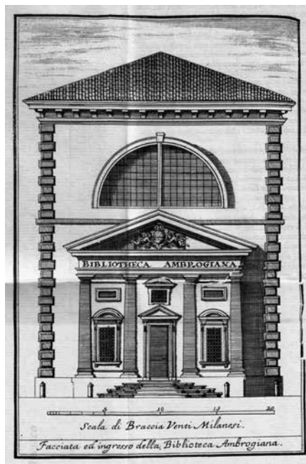
2. Anonimo, Facciata di ingresso della Biblioteca Ambrosiana , in Serviliano Latuada, Descrizione di Milano ornata con disegni in rame Delle Fabbriche più cospicue, che si trovano in questa Metropoli , Milano, 1738, IV, pp. n.n.