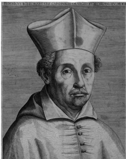
1. Anonimo, Ritratto del cardinale Federico Borromeo , 1631-1632 circa, Milano, Castello Sforzesco, Civiche Raccolte delle Stampe «Achille Bertarelli»