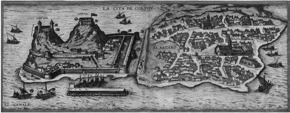
4. Frans Hogenberg, Corfù , in Georg Braun - Frans Hogenberg, De praecipuis, totius universi urbibus, liber secundus , Köln, 1593, II, pp. n.n.