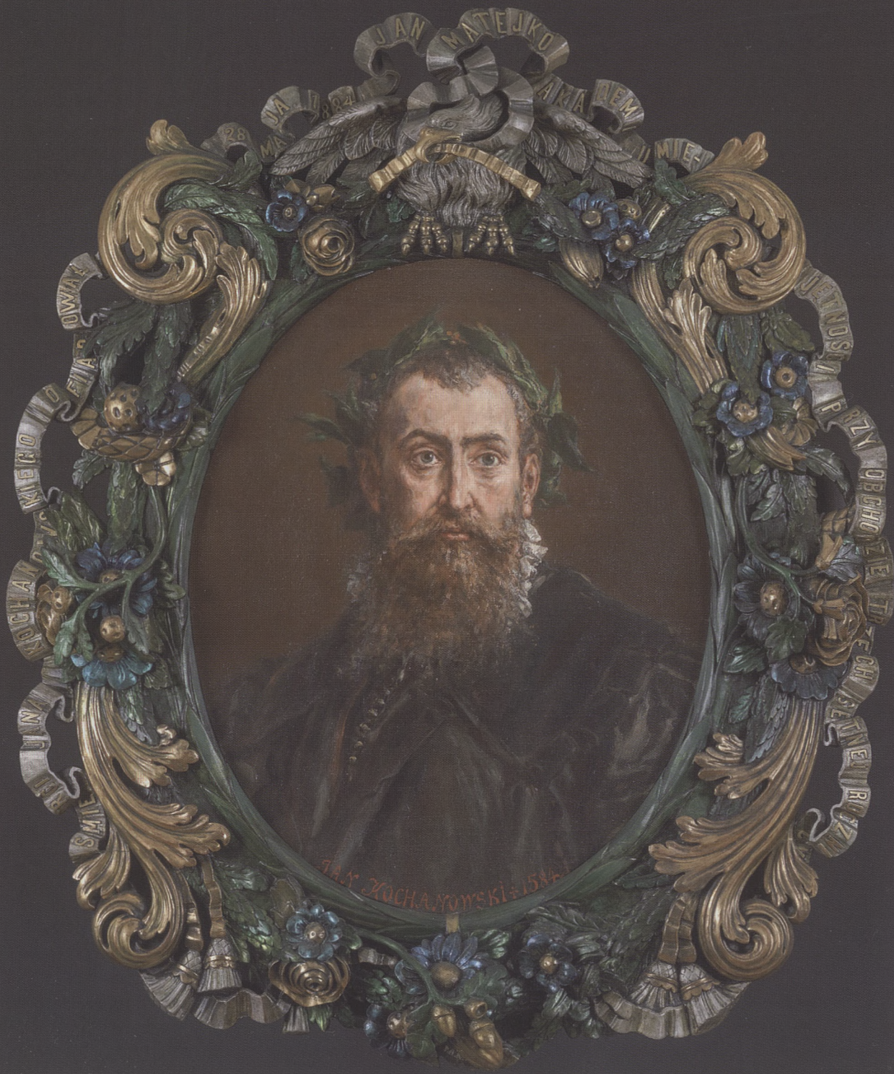
54. Jan Matejko, Imaginacyjny portret Jana Kochanowskiego , 1884