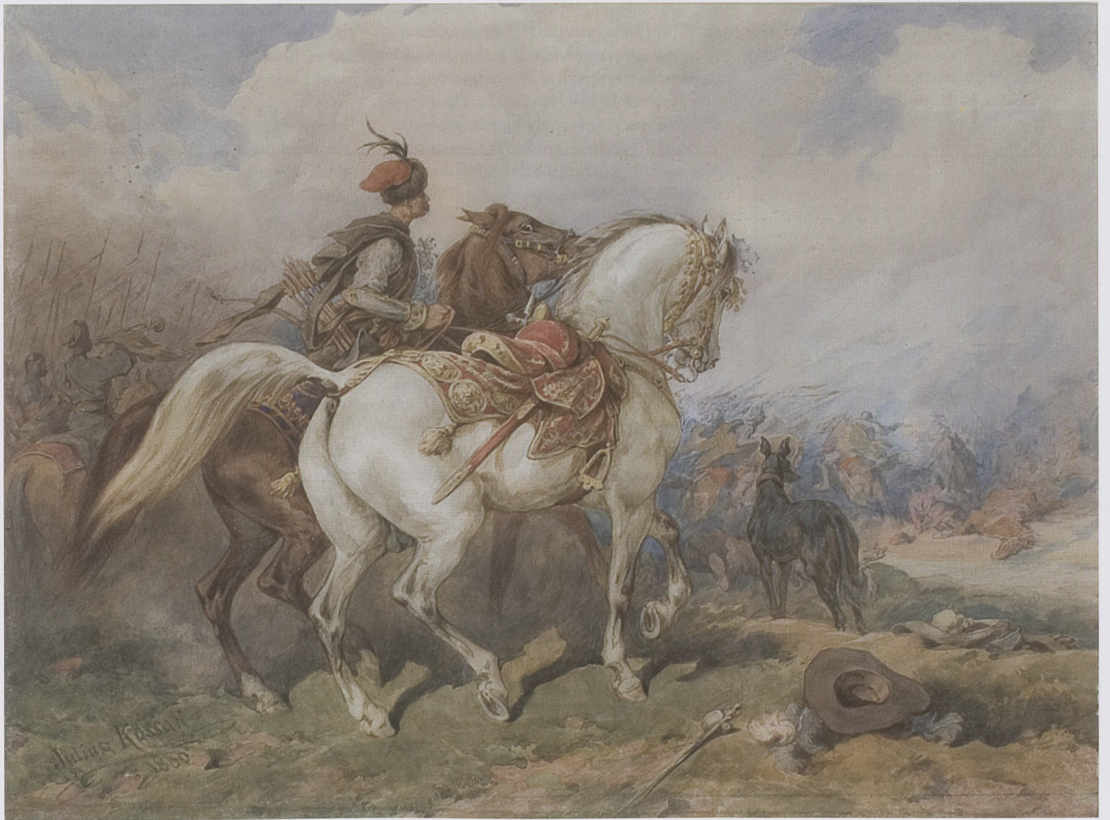
55. Juliusz Kossak, Luzak husarski na tle pola bitwy, 1880