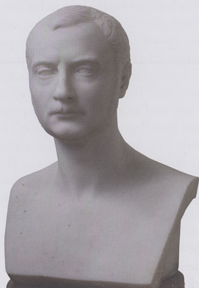
58. Pietro Tenerani, Portrait of Zygmunt Krasiński