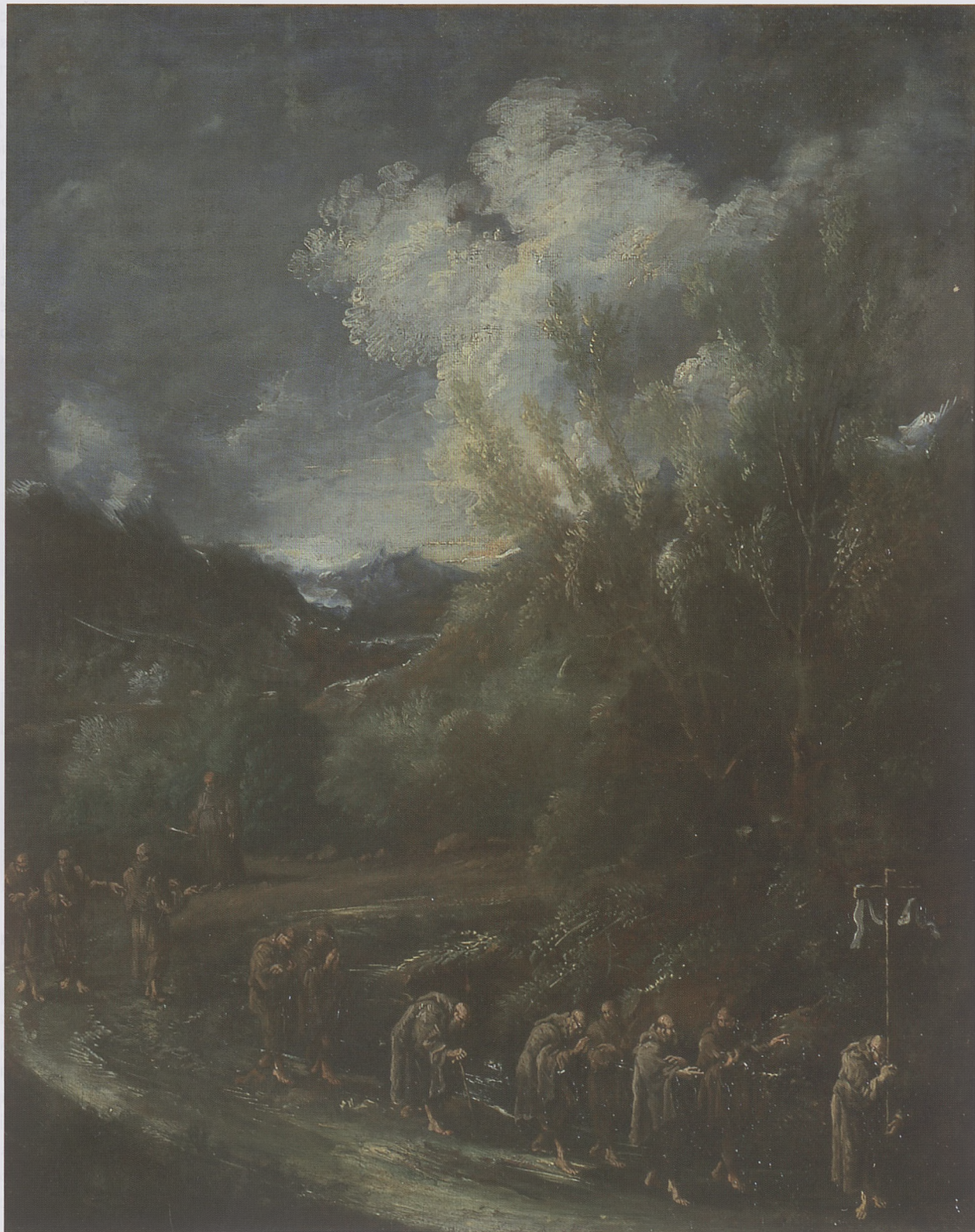
51. Alessandro Magnasco (krąg), Procesja mnichów , XVIII w.