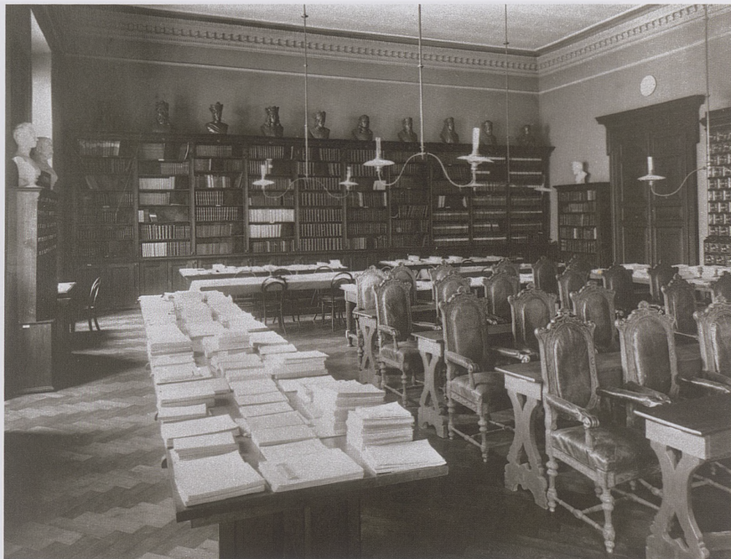
48. Duża Aula Akademii Umiejętności w kierunku północnym, ok. 1894–1897