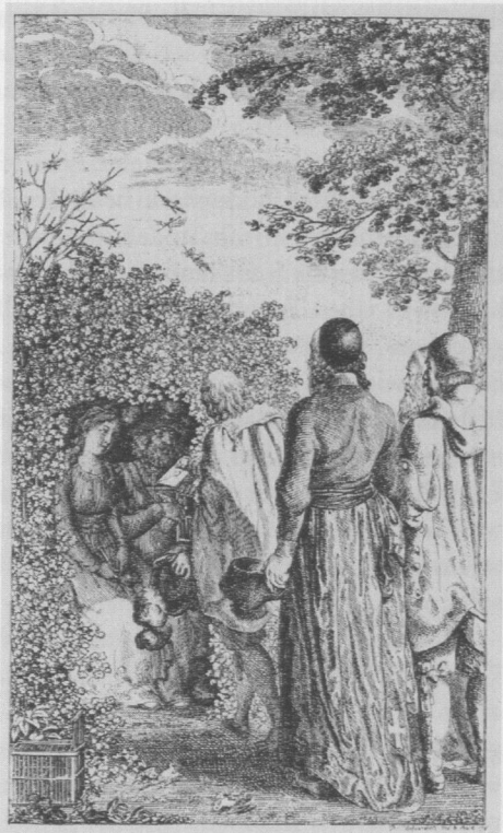
Abb. 2 Daniel Chodowiecki, Heinrich I. mit seiner Gemahlin auf dem Vogelheerde , aus: 18 Blätter zur deutschen Monatsschrift für 1795–1800 (Blatt 3), Radierung, ca. 16,3 x 9,4 cm

schen Kaiser des Mittelalters wurde, sollte dem Betrachter schon im Blick auf die Ausgangssituation plausibel werden. Ein wenig seltsam erscheint die Darstellung dem heutigen Betrachter nichtsdestoweniger, vor allem dann, wenn er sich in der geläufigen absolutistischen Herrscherikonographie auskennt.