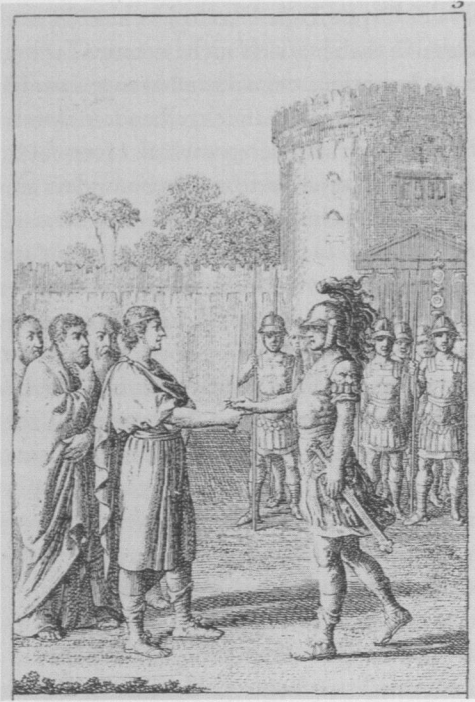
Abb. 3 Daniel Chodowiecki, Marc Aurel, aus: Zwölf Blätter zu der älteren, mittleren und neueren Geschichte, in: Genealogischer Kalender zur angenehmen und nützlichen Unterhaltung auf das Jahr 1794, 1793, Radierung, 8,6 x 5,2 cm

lent. Je mehr er ihn sentimentalisch auflud, desto mehr verlor dieser seine Dominanz. Je mehr er ihn vermenschlichte, desto mehr verschmolzen die beiden Körper des mystischen Königums zu einem einzigen. Indirekt zeigt sich das an einem weiteren Blatt aus der Serie zur Geschichte Peters des Großen. 40 Der Zar wird dort an der Seite eines promiskuitiven Hoffräuleins gezeigt, das mehrfach hintereinander seine neugeborenen Kinder getötet hat und dafür jetzt hingerichtet werden soll. Und obwohl Peter selber für eines dieser Neugeborenen verantwortlich zeichnete, begnadigt er die Frau nicht, sondern rät ihr zu Reue und tapferem Tod auf dem Schafott. Denn: »Göttlichen und Landesgesetzen zuwider kann ich dich nicht retten.« 41 Darauf läuft es letztlich hinaus: Auch der König ist den Gesetzen unterworfen, er wird zum Funktionsträger und Element des sich universalisierenden Staatswesens. Zeitenössische Darstellungen von Friedrich dem Großen, auf die ich hier weiter nicht eingehen will, zeigen in die gleiche Richtung.